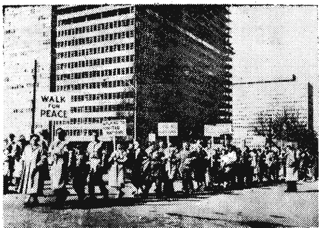
W Filadelfii (USA) zorganizowano „marsz pokoju” na znak protestu przeciwko kontynuowaniu prób z bronią nuklearną. Uczestnicy marszu udają się do siedziby ONZ w Nowym Jorku, gdzie przylączą się do nich inne delegacje: nowojorska i z New Haven.