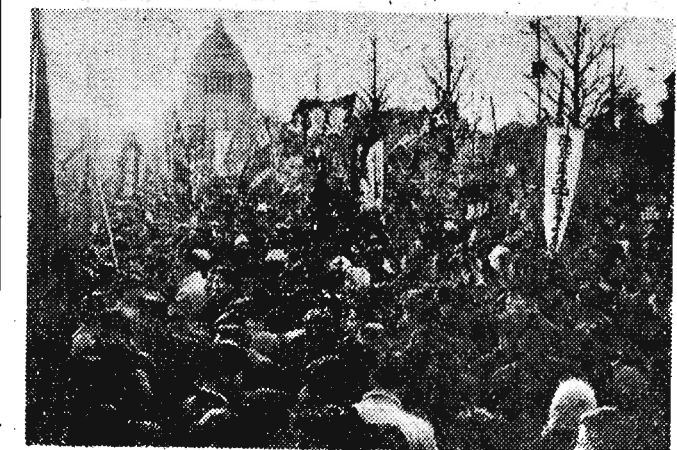
Ok. 20.000 robotników — członków związku pracowników państwowych i przedsiębiorstw publicznych — demonstrowało przed parlamentem w czasie debaty nad ustawą o budżecie na 1958 r.

Na zdjęciu: Robotnicy udają się z petycją do parlamentu.