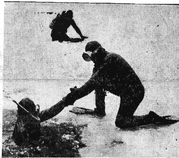
...i trenują nawet pod lodem...