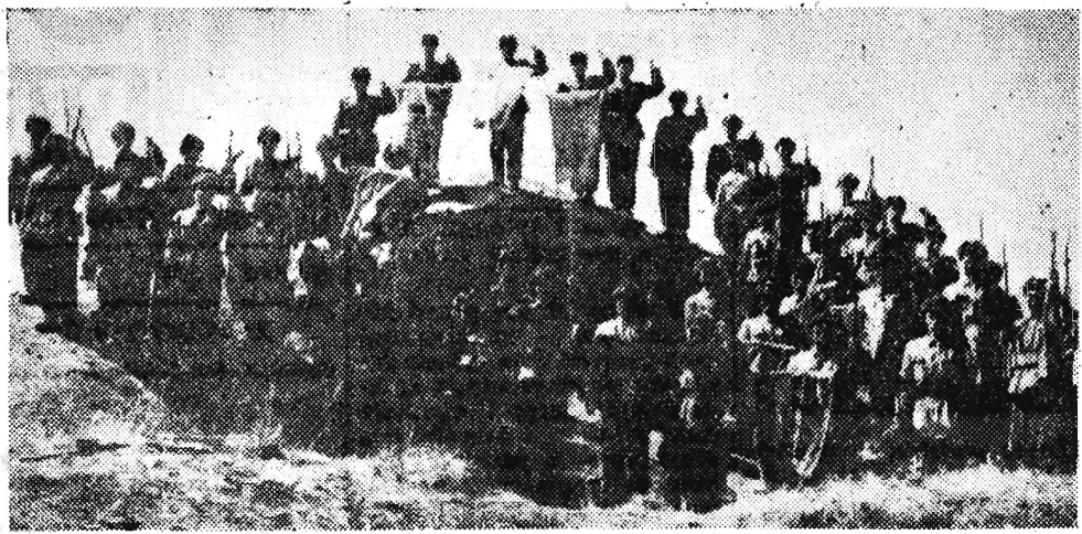
Podjęta została stopniowa ewakuacja oddziałów ochotników chińskich z KRL-D. Na zdjęciu: Oddział opuszczający Koreę ochotników chińskich przybył przed wyjazdem do ojczyzny na miejsce pamiętnych walk o Jeng Za San.

Byłoby dobrze, gdyby przygotowania do konferencji na najwyższym szczeblu odbyły się jak najszybciej