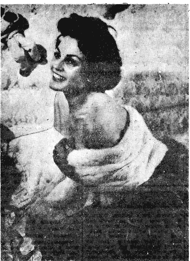
Gwiazda kinematografii hiszpańskiej Carmen Sevilla.

ważny dla mieszkańców m. Rzeszowa Miejskie Przedsiębiorstwo Wodociągów i Kanalizacji w Rzeszowie, zawiadamia, że w dniu 23 marca 1958 r. w godzinach od 17 do 5 rano dnia następnego przeprowadzana będzie dezynfekcja sieci wodociągowej. W związku z tym zwiększona ilość chloru uniemożliwi korzystanie z wody wodociągowej. Zlikwidowanie nadmiaru chloru w wodzie dokonać można przez przegotowanie jej względnie przez napowietrzanie. K-439/2