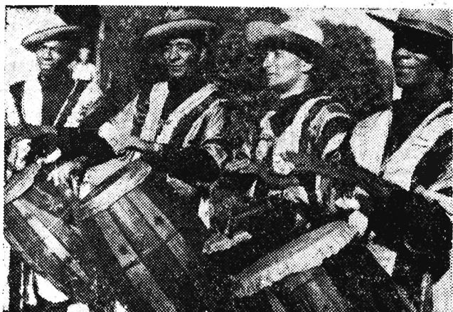
Urugwaj jest jedynym krajem Ameryki Południowej, w którym nie ma zupełnie Indian, znajduje się natomiast pewien procent ludności murzyńskiej. Ludności tej zawdzięcza Urugwaj najbardziej charakterystyczny i oryginalny taniec pod nazwą Candombe. — Candombe to taniec afro-urugwajski, wywodzący się z tańców plemienia Bantu i rytuału koronacji królów plemion afrykańskiego Konga. Pochodzi on z końca XVIII wieku.