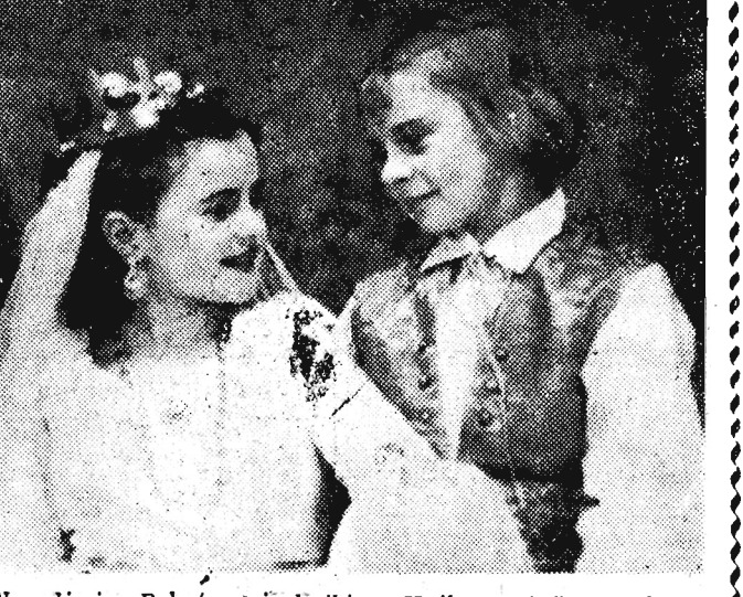
Na zdjęciu: Bohaterowie bajki — Królowa i Szewczyk.