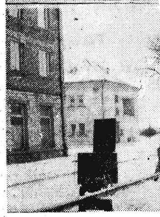
Na zdjęciach: Trwają prace przy instalacji gazociągu na ulicy Czackiego.

O d lipca ubr. rzeszowianie ze szczególnym zainteresowaniem śledzą postępy robót przy gazyfikacji naszego miasta. Patrząc na rozkopane ulice, na zakładanie rur, wielu z nich oczekuje gazu w mieszkaniach już w tym roku, a najdalej w dwu latach następnych. Tymczasem do chwili, kiedy w mieszkaniach przy ul. 3 Maja, czy Szopena, gotować będziemy obiady na kuchenkach gazowych, upłynie jeszcze sporo czasu. Plan gazyfikacji miasta przewiduje wykonanie gazowej sieci ulicznej do końca roku 1960. W tej chwili roboty są już poważnie zaawansowane. Na odcinku 7 km — poprzez ulice Pułaskiego, Kra-