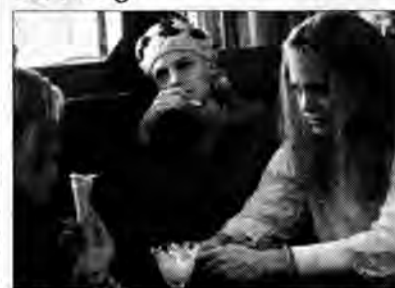
CLEA DUVALL (Georgina), ANGELA BETTIS (Janet) i ANGELINA JOLIE (Lisa)

reż. James Mangold, USA wyst. Winona Ryder, Angelina Jolie, Vanesa Redgrave, Whoopi Goldberg