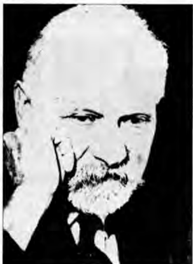
Robert Barany, zdjęcie z 1930 roku.

Gdy w marcu 1915 roku, po wielomiesięcznym oblężeniu, padła twierdza Przemysł, wśród wziętych do rosyjskiej niewoli jeńców był węgierski lekarz – Robert Barany. Udając się do niewoli, nie wiedział on, że w tym samym czasie, w Sztokholmie, przyznano mu nagrodę Nobla w dziedzinie medycyny.