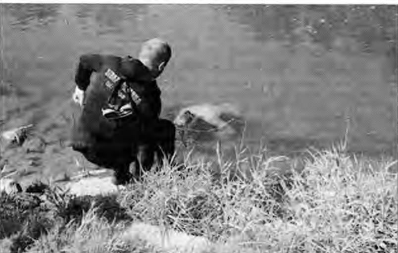
18 sierpnia strażacy znaleźli topielca w Samie.