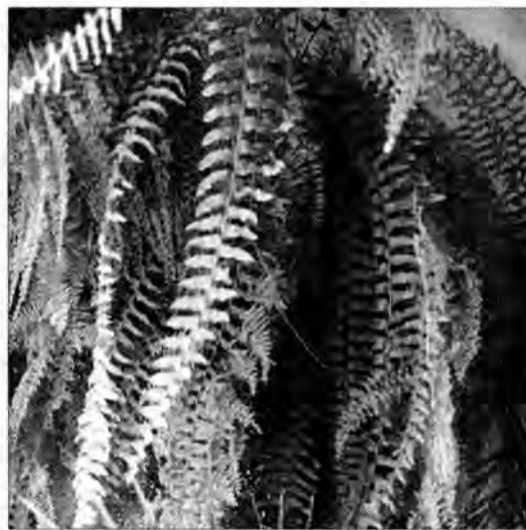
Papaw najefektywniej pochłania formaldehyd

Wakacje dobiegły końca. Coraz częściej będziemy przesiadywać w pomieszczeniach, poświęcając się pracy lub odpoczywając w domowym zaciszu. Zachęcam więc do przeniesienia "kawałka ogrodu", odrobiny zieleni do miejsc, gdzie najdłużej przebywamy.