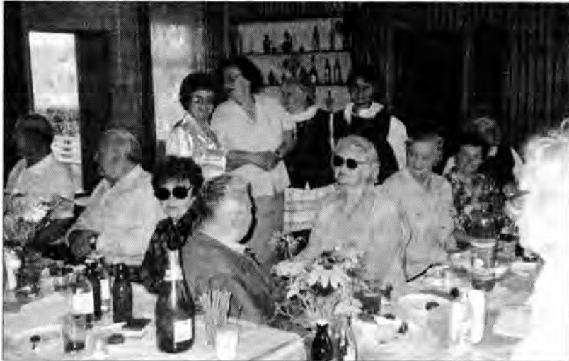
Gościliśmy np. w Jarosławiu w na działkach pracowniczych. Spotkanie odbyło się w świetlicy działko-

– W naszej organizacji emeryckiej w planach pracy kulturalno-oświatowej postawiliśmy sobie za zadanie nawiązanie współpracy z sąsiednimi związkami emeryckimi. Celem tej współpracy jest wymiana doświadczeń, wspólne spędzenie czasu, wytworzenie miłego nastroju, przyjaźni i wzajemnej życzliwości.