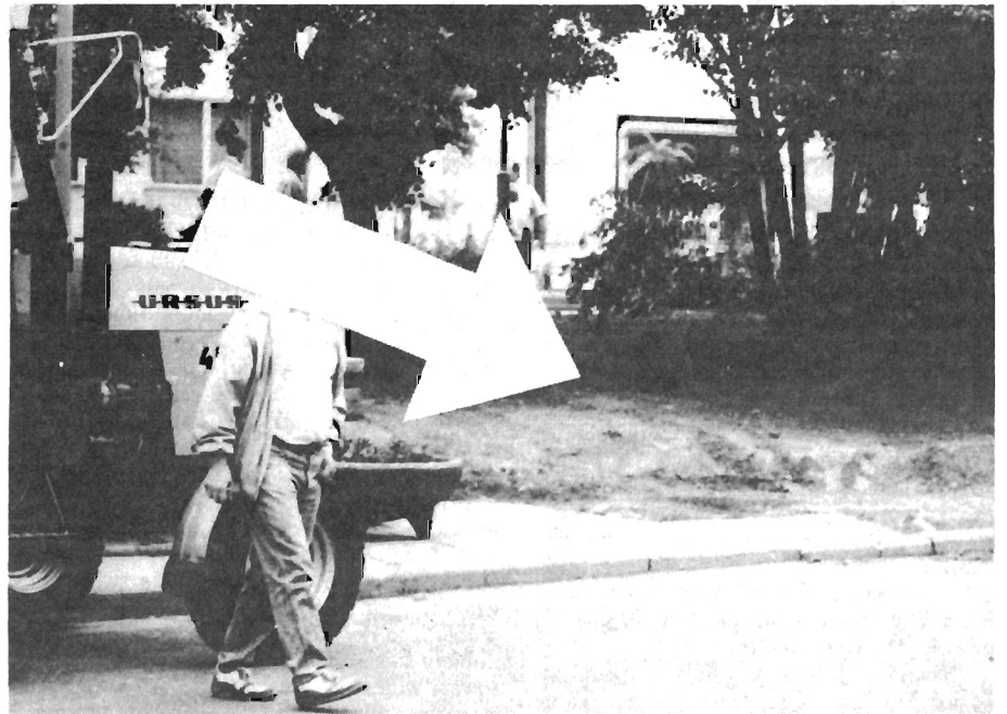
W tym miejscu był szalet