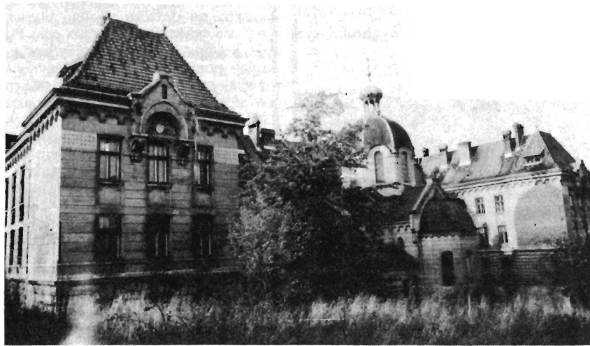
II LO w Przemyślu.