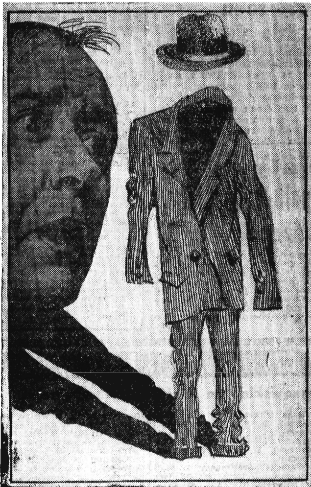
„Tak krawiec kraje, jak materii staje”.