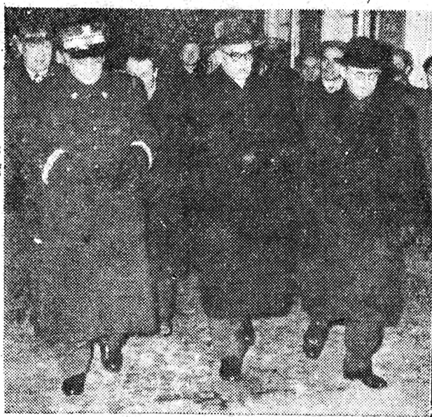
Dnia 21. XI. 1957 r. wieczorem powróciła z Moskwy polska delegacja partyjno-rządowa. Na zdjęciu: Powitanie delegacji na Dworcu Głównym w Warszawie.