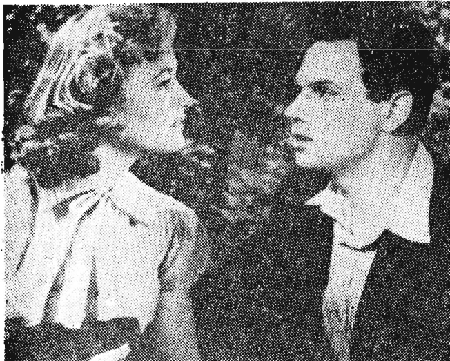
1) Dlaczego przzerwano nadawanie Szekspira...

A oto przykład wypełnienia kuponu: Zdjęcie z filmu „PIĘKNE DNI” — aktor L. Charitonow Tekst z filmu „CZTERDZIESTY PIERWSZY” — aktor I. Izwicka, O. Strizhenow.