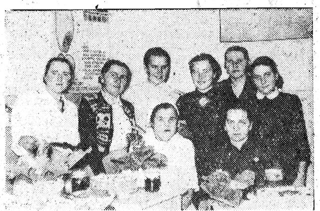
Z tego zdjęcia słuchaczki kursu będą miały wspólną pamiątkę.

W wyniku tego ogólnego "tloku" sklepy wzorcowe z konieczności muszą być wykorzystywane (np. sklep nr 4) na magazyny.