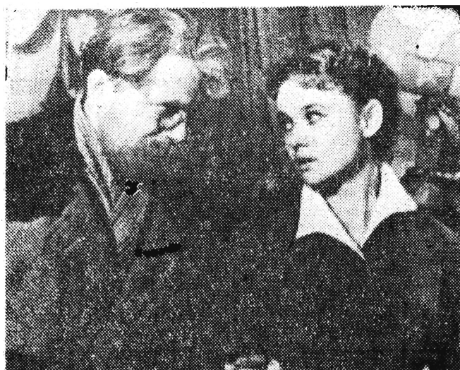
2) Na jaką uczelnię chcesz wstąpić...