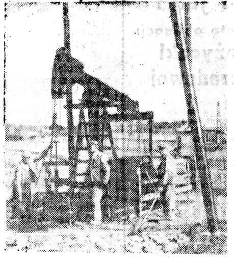
... leniwie i ciągle ruszają się ramiona kiwonów. W ślad za nimi pompy z głębi ziemi tłoczą ciemnobrunatny płyn.