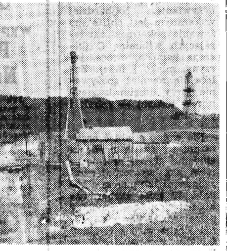
... W Węglówce i gdzie indziej jest jeszcze w głębi ziemi ropa. Trzeba jej jednak szukać. Na budowę takich szybów jak ten na zdjęciu geolodzy chcą uzyskać fundusze.