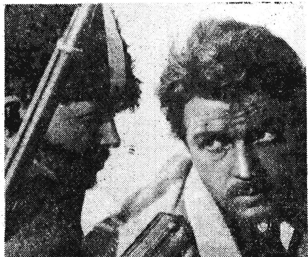
3) My walczymy za światową rewolucję...