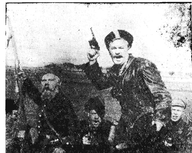
4) Szkoda chłopców, tak głupio utonęli...