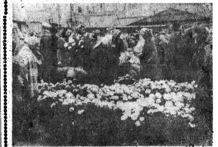
W dniu Święta Zmarłych ukwiecą groby bliskich.