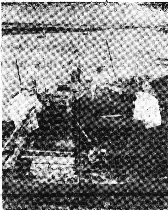
W Rybackim Zespole Knyszyn (woj. białostockie). Pierwsza partia z odłowu (około 30 ton) przeznaczona jest na eksport do Czechosłowacji. Na zdjęciu: Wybieranie s łodzi odłowionych karpia.