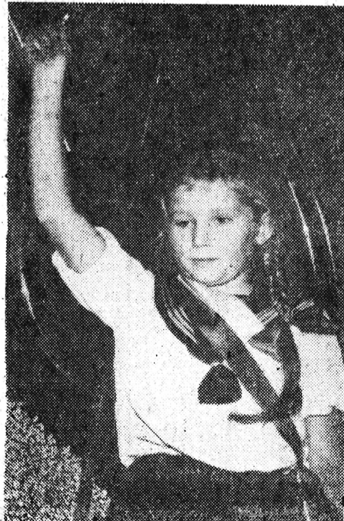
Na zdjęciu: Losowanie.

W dniu 25. X. br. odbyło się w sali kina „Niespodzianka” w Warszawie pierwsze losowanie nieoprocenowanych książeczek PKO premiowych samochodami. W losowaniu wzięło udział 51.756 książeczek. 51 posiadaczy szczęśliwych książeczek otrzymało samochody. W ten sposób rozlosowano 30 „Warszaw” i 14 „Wartburgów” i 7 sztuk „P-70”.