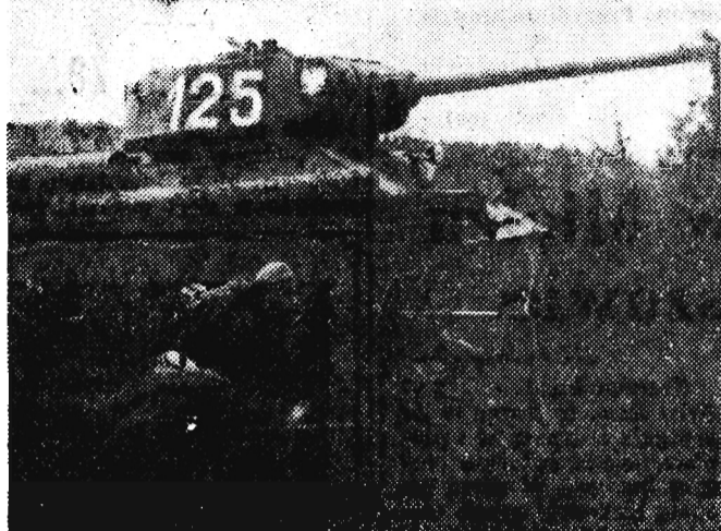
Na zdjęciu: Żołnierze i pułku piechoty w czasie „boju” pod osłoną czołgów...

ze dzisiaj liczyć także na wychowawczą rolę, jaka powinno spełnić wojsko w stosunku do młodzieży. W warunkach zerwania z „kapralstwem”, dretwym „upolitycznianiem”, które odnosiło odwrotny od zamierzonego skutek, istnieją