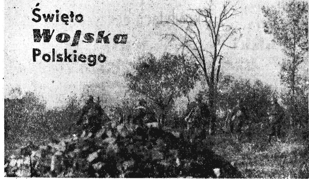
Święto Wojska Polskiego

Poszliśmy im i przesyłamy im nasze serdeczne życzenia. Walka rządu polskiego z pewnymi osobami, które próbują zmienić ustroj ustaloną przez naród polski — to walka o umocnienie demokratycznych podstaw kraju. I walka ta cieszy się poparciem przeważającej większości mas pracujących Polski. Ci, którzy przeciwdziałają tej walce, są w istocie rzeczy agenturą reakcyjnej burżuazji i nie reprezentują interesów narodu polskiego. Rząd polski i Polska Zjednoczona Partia Robotnicza mają dość odwagi i doświadczenia, aby uporać się z sytuacją i osiągnąć dalsze sukcesy w rozwoju swego socjalistycznego państwa. Jeśli chodzi o nasze sympatie, to są one całkowicie po stronie narodu polskiego, Polskiej Zjednoczonej Partii Robotniczej, budujących socjalizm w swoim kraju. Wierzymy w lud polski, który nikomu nie odda swych zdobyczy socjalistycznych. („Trybuna Ludu”)