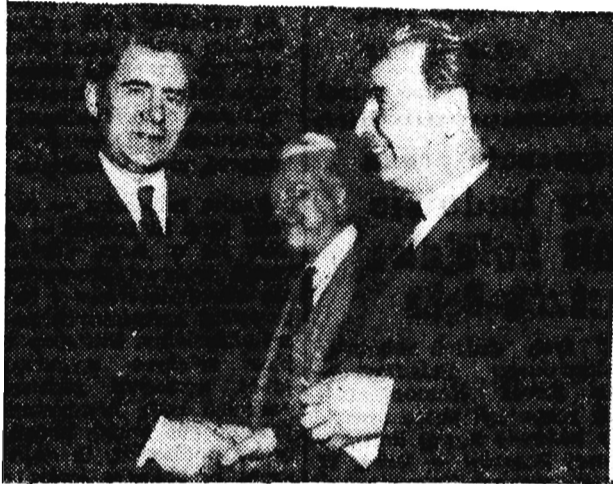
Na zdjęciu: Przewodniczący delegacji polskiej minister spraw zagranicznych Adam Rapacki oraz przewodniczący delegacji radzieckiej minister Andrzej Gromyko.