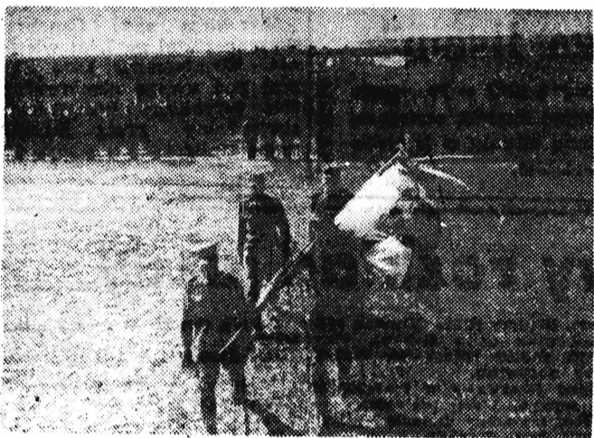
Na zdjęciu: 15 lipca 1943 r. — defilada oddziałów I Dywizji im. Tadeusza Kościuszki...