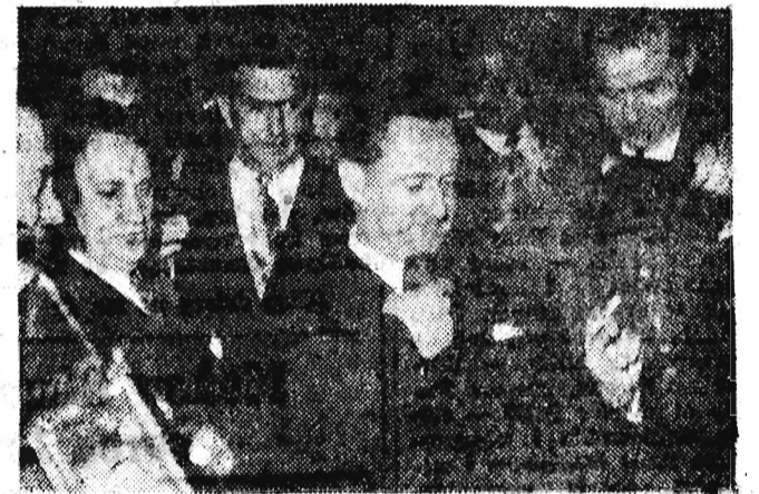
Na zdjęciu: Bourges-Maunoury po złożeniu dymisji...