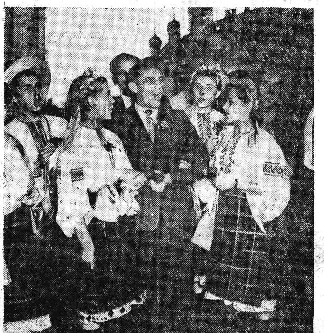
Grupa młodzieży polskiej i ukraińskiej na Kremlu.