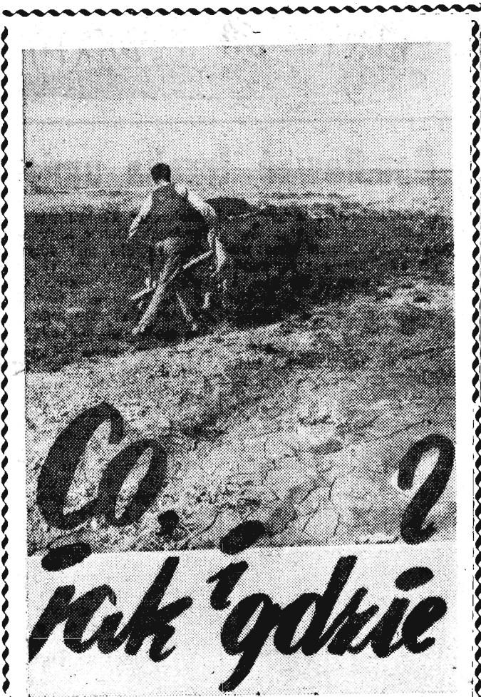
Iran — tak wygląda orka w okręgu Veramine.