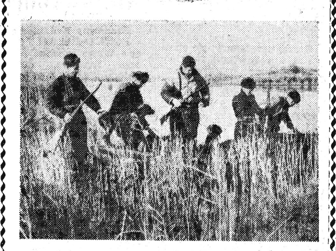
W Gruzji, na nizinie Kolchidzkiej, znajdują się bogate tereny łowieckie...