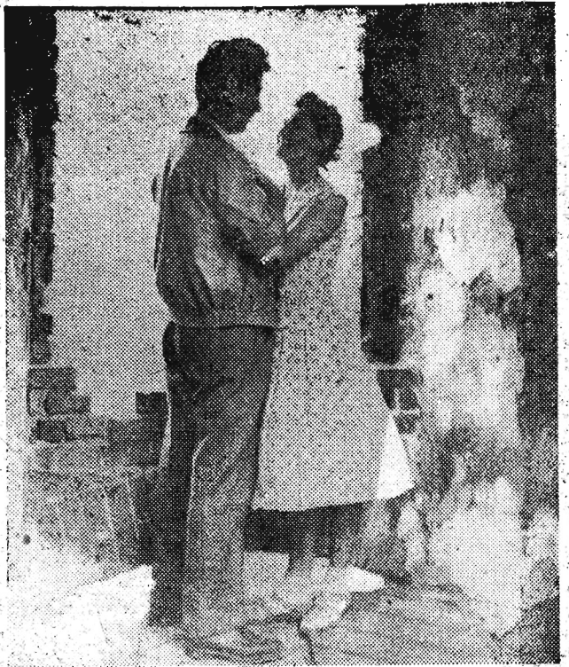
...to nowy polski film reżyserii Róże Wiczka. Film przedstawia życie kobiet w obozie koncentracyjnym, które przyrzekają sobie do końca życia nie rozłączać się z sobą. Czy przyrzeczenia dotrzymają, przekonamy się o tym sami oglądając film.