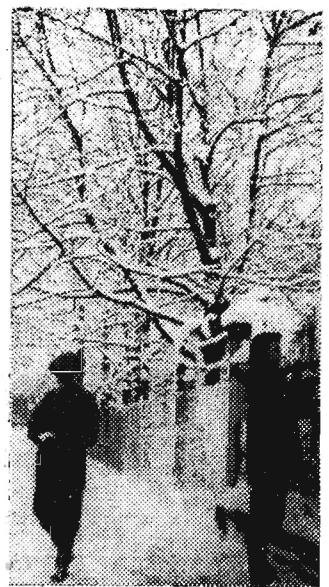
Wiadomo, dzieci z najżywszą uciechą przyjeły lejący z nieba śnieg. Lepiej śnieżki i bawia się wesolo.