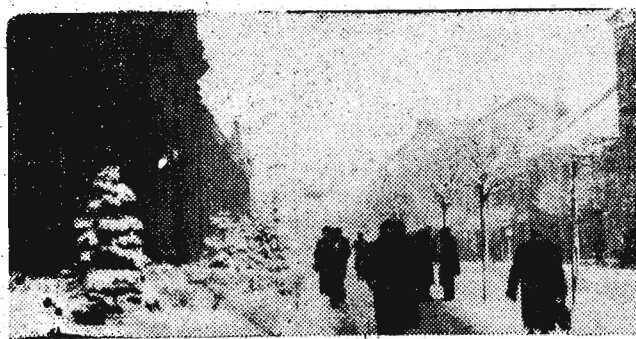
Ale swoją drogą Rzeszów przykryty śniegiem jakoś estetyczniej wygląda. Nic dziwnego, śnieg ukrył wszystkie brudy...