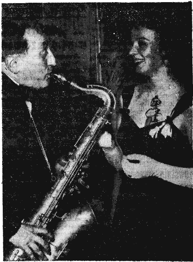
Na zdjęciu: Ona i on, a w środku... saksofon.