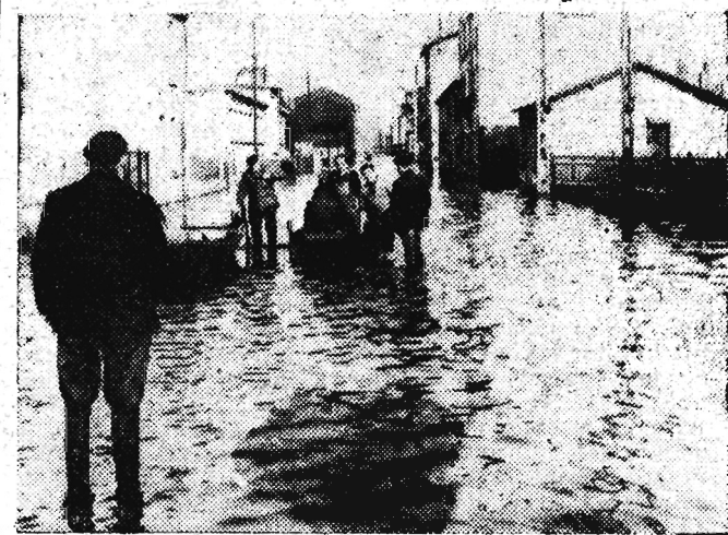
Na zdjęciu: W Oullins (dep. Rhone) żywność do zalanych dzielnic przewozi się łódkami.