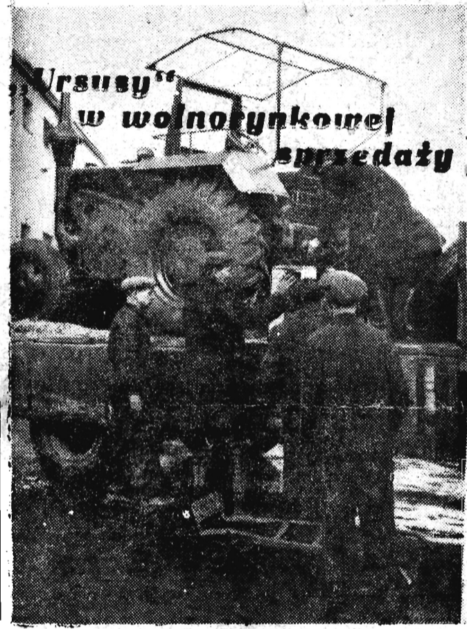
Ursusy w wolnorynkowej sprzedaży

Od chwili zniesienia zakazu wolnorynkowej sprzedaży ciągników do chwili obecnej Centrala Zaopatrzenia Rolnictwa sprzedała chłopom 500 traktorów „Ursus”.