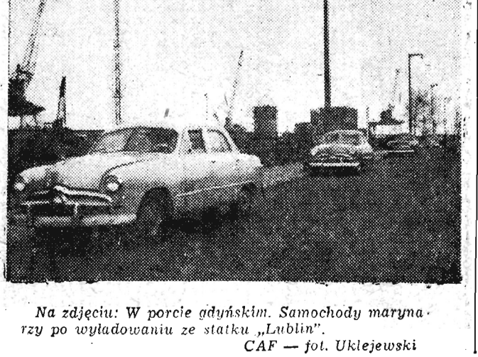
Na zdjęciu: W porcie gdynskim. Samochody marynary po wyładunku ze statku „Lublin”.