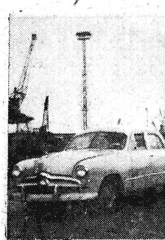
Na zdjęciu: W porcie gdynskim. Samochody marynary po wyładunku ze statku „Lublin”.