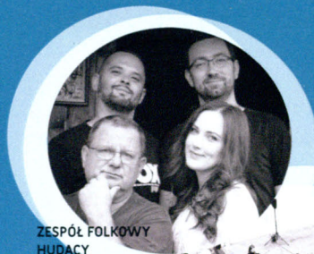
ZESPÓŁ FOLKOWY HUDACY