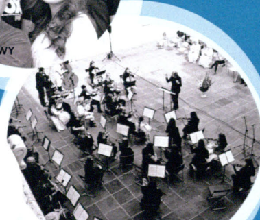
NADSAŃSKA ORKIESTRA KAMERALNA