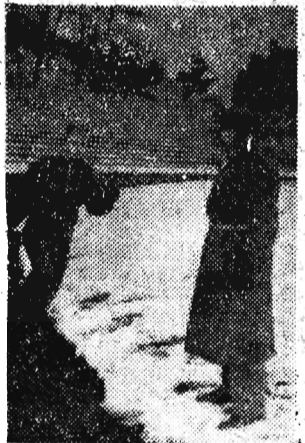
Na zdjęciu: Trening kontroly Zimnego na stadio- nie Budowlanych w Gdańsku. Z prawej — trener Zylewicz.