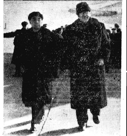
Na zdjęciu: Premier Otto Grotewohl i premier Czou En-lai na lotnisku.

PEKIN (PAP). Bawiąca w Chinach delegacja rządowa Niemieckiej Republiki Demokratycznej, której przewodniczy premier Otto Grotewohl, przybyła 14 bm. do Szanghaju. Ponad 10 tys. mieszkańców miasta zgromadziło się na lotnisku, aby powitać gości niemieckich.