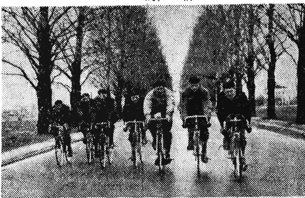
Na zdjęciu: Kolarze na treningu.

KOLARZE PRZYGOTOWUJĄ SIĘ DO WYŚCIGU POKOJU WARSZAWA — BERLIN — PRAGA Kolarze objeżdżają regularnie treningi na szosach podwarszawskich. Oprócz normalnej jazdy na treningach uprawiają oni także sporty uzupełniające: gimnastykę, podnoszenie ciężarów, jazdę na rolkach, co przyczyniło się niewątpliwie do ogólnego podniesienia sprawności i kondycji fizycznej zawodników.