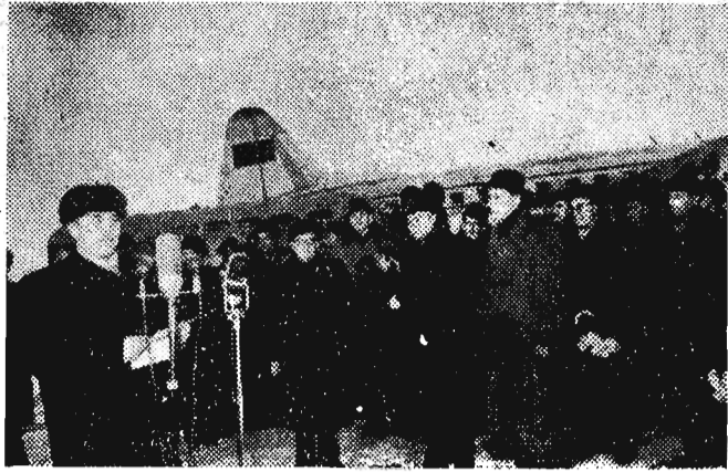
Od 8 grudnia br. bawi w ZSRR, przybyła na zaproszenie Rady Najwyższej ZSRR, 10-osobowa delegacja Sejmu PRL. Na zdjęciu: Na lotnisku we Wnukowie.

MOSKWA (PAP). Specjalny wysłannik PAP donosi: Dnia 15 bm. w godzinach południo- wych przybyła do Leningradu delegacja Sejmu PRL.