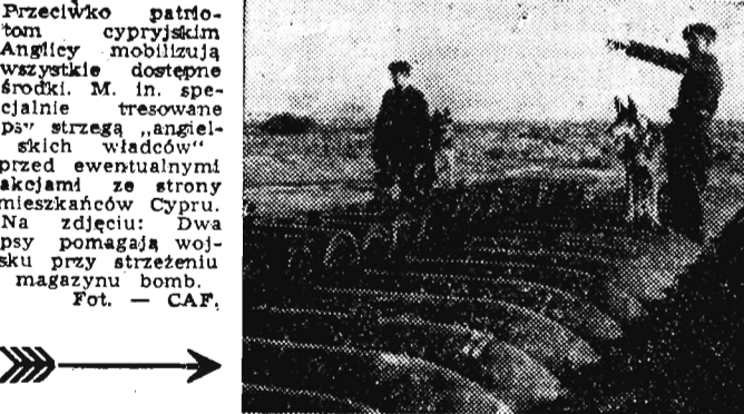
Przeciwnicy patriotom cypryjskim Anglijczy mobilizują wszystkie dostępne środki. M. in. specjalnie tresowane psy strzegą „angielskich władców” przed ewentualnymi akcjami ze strony mieszkańców Cypru. Na zdjęciu: Dwa psy pomagają wojsku przy strzeżeniu magazynu bomb.

PEKIN (PAP). Jak podaje Agencja Nowych Chin, dnia 13 bm. 8 samolotów czangkajszekowskich produkcji amerykańskiej „F-84” wdarłoby do obszarów powietrznych Chińskiej Republiki Ludowej ostrzeliwując i bombardując miejscowości Santuso, Hwancki i Tunuzun w prowincji Fukien. Inżynierowie śmigłowy samoloty Chińskiej Armii Ludowo-Wyzwoleńczej, otworzyła również ogień ar-