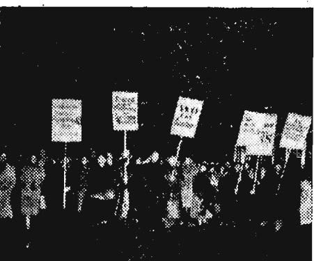
Wypuszczenie na wolność gestapowca — Santschera wywołało falę protestów wśród społeczeństwa austriackiego.