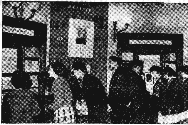
W Państwowej Bibliotece im. Lenina otwarto dużą wystawę, poświęconą setnej rocznicy śmierci wielkiego poety polskiego Adama Mickiewicza Na zdjęciu: Fragment wystawy.