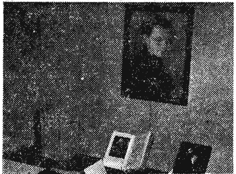
Na zdjęciu: Fragment wystawy ilustrujący okres pobytu poety w Wilnie.

W zbiorach Muzeum Adama Mickiewicza otwartego w dniu 25 br. w mies. na Rynku Starego Miasta w Warszawie znajduje się szereg niezwykle cennych pamiątek z życia wielkiego poety. Między innymi zobaczymy tam jeden z trzech istniejących rękopisów Mickiewicza a mianowicie rękopis „Grażyny”.