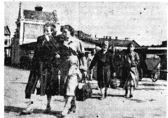
Codziennie rano obciążone torbami idą mieszkanki Rzeszowa z targu do domów. Każdego dnia zastanawiają się nad tym dlaczego Prezydium MRN w Rzeszowie tak mało troszczy się o potrzeby mieszkańców...

Po drugie nawet obecny plac, na jakim odbywa się sprzedaż warzyw i nabiału