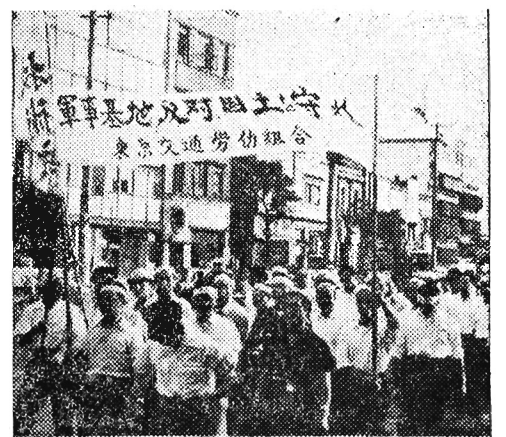
Na zdjęciu: Fragment demonstracji.

W Tokio odbył się 50-tysięczny wiec, którego uczestnicy demonstrowali przeciwko wojnie, stosowaniu broni atomowej i obcym bazom wojskowym na terenie Japonii.