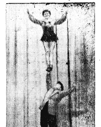
Duet Fergell popisuje się węgierską sztuką cyrkową.

artystów zaliczyć należy w zespole Cyrku Nr 6 zespół rekwizytów pod kierownictwem Jana Hordeckiego i zespół chińskiej akrobacji parterowej pod kierownictwem Eugeniusza Monasterycha.