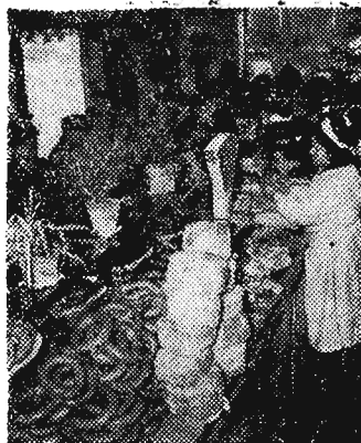
Miejski Handel Mięsem zaopatrzył sklepy w zwiększony asortyment mięsa i wyrobów wędliniarskich.

Roszarniczych w Lubaczowie wykonali roczny plan w 100 proc. i do chwili obecnej dają państwu dodatkową produkcję o wartości 136,2 tys. złotych.