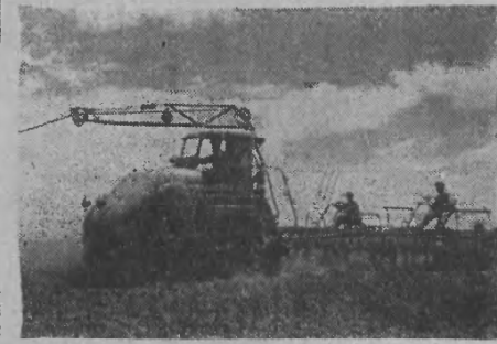
Zdjęcie nasze przedstawia jedną z najdoskonalszych zdobyczy radzieckiego prze myślu maszyn rolniczych. Jak nazywa się ta maszyna?

„Co wiesz o Związku Radzieckim?” Kupon konkursowy Nr 7 Należy również śmieiej niż