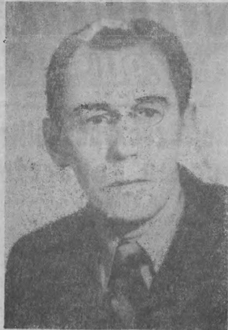
Prof. JAN DEMBOWSKI Marszałek Sejmu