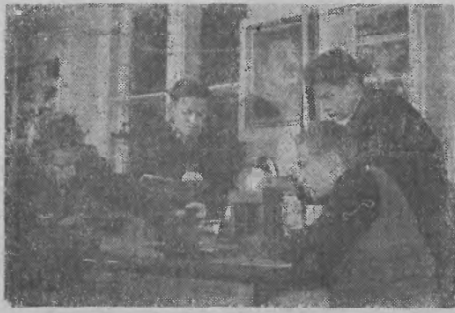
Miejsce pracy Domu Kultury przy ulicy Kosmonautów w Warszawie, posiada następujące działy: nauki, techniki, wychowania artystycznego i wychowania fizycznego. Młodzi „architekci” i „konstruktorzy” mają do dyspozycji doskonale wyposażone pracownie techniczne, modelarskie i warsztaty. Na zdjęciu: uczestnicy pracowni fizyki przeprowadzają doświadczenie.