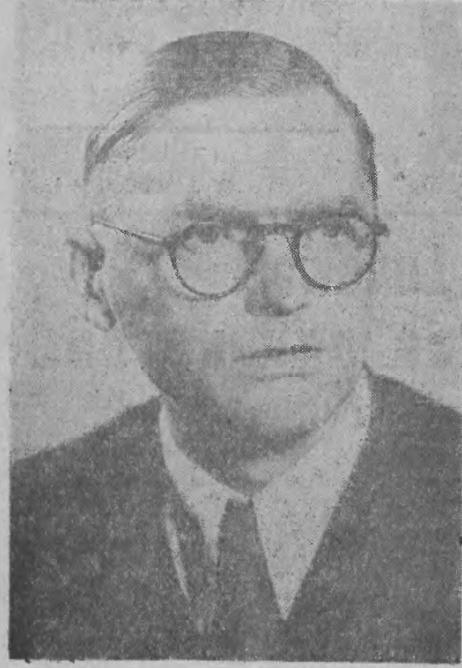
ALEKSANDER ZAWADZKI Przewodniczący Rady Państwa

W dniu jutrzejszym podamy przemówienie ministra Bezpieczeństwa Publicznego Stanisława Radkiewicza o projekcie ustawy o amnestii — wygłoszone na posiedzeniu Sejmu Polskiej Rzeczypospolitej Ludowej w dniu 22 listopada 1952.