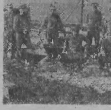
SPORTOWCY BUDUJĄ STADION — GIGANT

Na dołek organizatorzy także nie stanęli na wysokości zadania popijając dopiero o godzinie 11 samochodów po piłkarzy i w rezultacie zawody rozpoczęły się z przeszło 40 min. opóźnieniem.