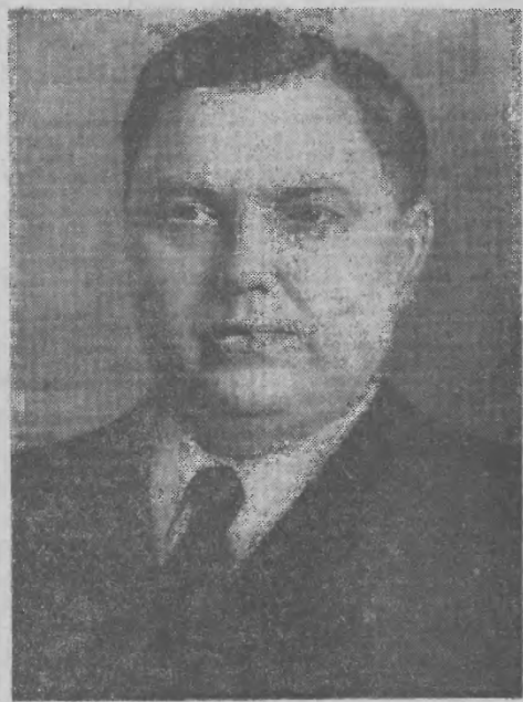
DO TOWARZYSZA G. M. MALENKOWA KOMITET CENTRALNY WKP(b)