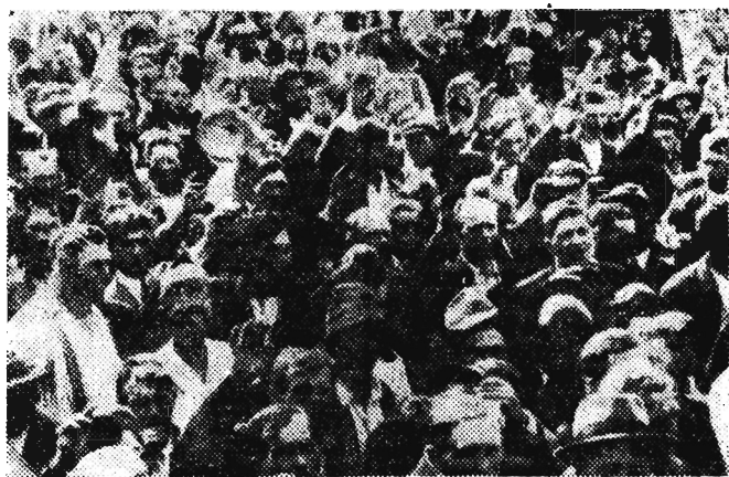
Na zdjęciu: Zgromadzenie ludowe na rynku w Przeworsku 15. VIII. 1937 r. uchwała powszechny strajk chłopski.

„Podniesienie wydajności rolnictwa jest dziś najistotniejszą sprawą ogólnonarodową i wspólnym zadaniem robotników i chłopów złączonych braterskim sojuszem” (BIERUT)