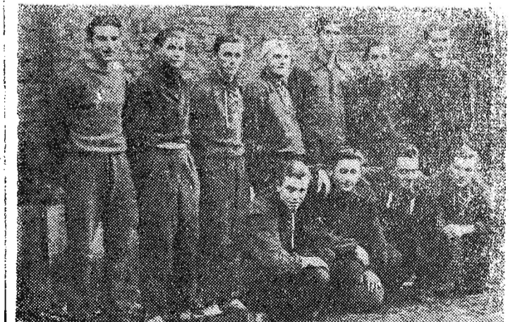
Mistrzowska drużyna koszykówki woj. rzeszowskiego ZKS „Kolejacz” Przemysł.

Mecz prowadzony był w ostrym i szybkim tempie, a Spójnia z Dębicy miała wyraźną przewagę przez 90 minut. Bramki zdobyli Witkowski, Kutruba, Maciejewski i Malinowski. Księżek