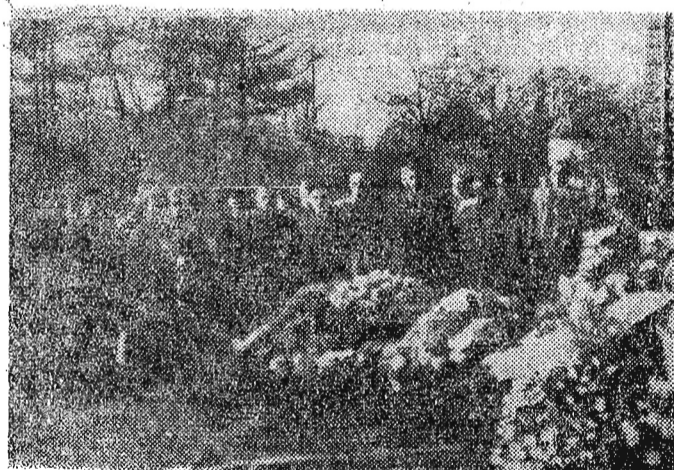
Na zdjęciu: Grupa piłkarzy radzieckich przy grobie Nieznanego Żołnierza w Krakowie.