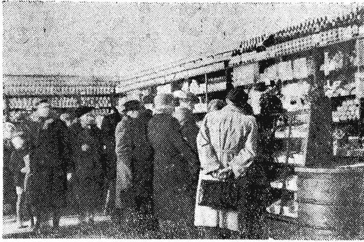
Wielki sklep spożywczy MHD w Rzeszowie, jest w stanie w ciągu jednego dnia obsłużyć i zaopatrzyć nawet 12 tys. mieszkańców