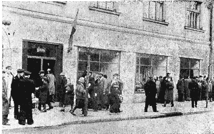
Przy ul. 3 Maja, nieopodal sklepu odzieżowego MHD, powstaje wielki sklep papierniczy.