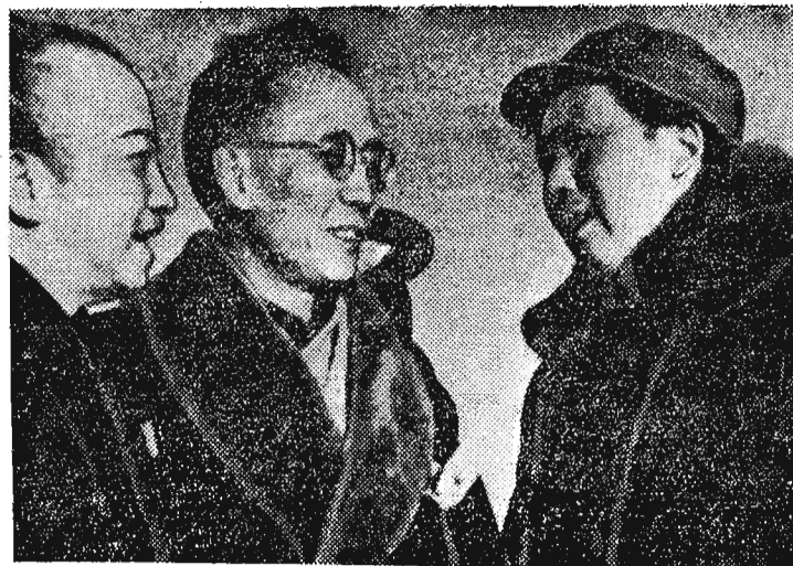
Po obradach Politycznej Konferencji Konsultatywnej ukonstytuował się pierwszy w dziejach Chin rząd ludowy, na którego czele stanął tow. Mao-Tse-Tung. Na zdjęciu premier Chin Ludowych tow. Mao-Tse-Tung w rozmowie z członkami rządu.

Rok I. Rzeszów — Przemyśl — Krosno, 4 października 1949 Nr. 20