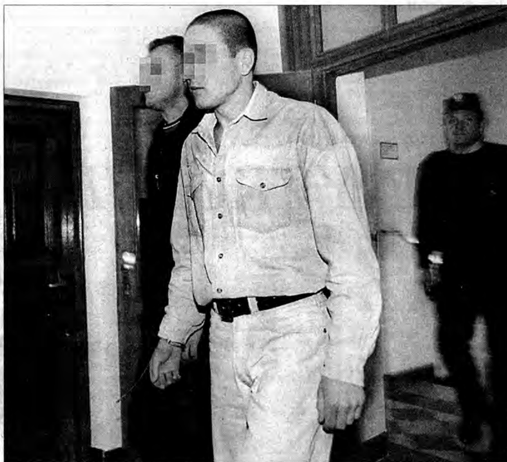
Nie karani, w większości żonaci, ze średnim wykształceniem

Dzisiaj kolejne przesłuchania w procesie gangu przemytników broni