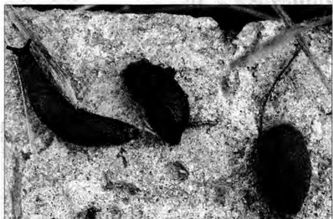
Rozwojowi populacji ślimaków sprzyja zachwianie równowagi biologicznej i brak ich naturalnych wrogów.