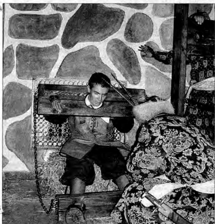
Zbrojownia-katownia. Polscy rycerze zakuwają w dyby „Szweda”