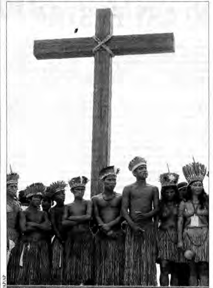
Indianie z plemienia Pataxo stoją na miejscu, gdzie 1500 roku odprawiono pierwszą mszę na ziemi brazylijskiej.

W 500 lat po pierwszej mszy odprawionej na terenie Brazylii Kościół katolicki przeprosił Indian i Murzynów za „grzechy i błędy”, popełnione przez jego duchownych w pięciu minionych stuleciach. Indian to jednak nie zadowoliło.