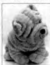
Tereska Szczygielska - Medyka