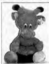
Kuba Woźny - Rzeszów

W sprawie odbioru nagród prosimy o kontakt do przyszłego piątku z działem marketingu „N”, R-press, 35-016 Rzeszów, ul. Unii Lubelskiej 3 Tel. (017) 862-67-77