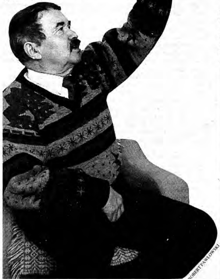
Nagle oglądam się i oczom swoim nie wierzę. Z nieba leci coś jasnego: długi płomień, pochodnia, płonąca ryba.