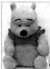
Krzysiu Wilk - Bircza