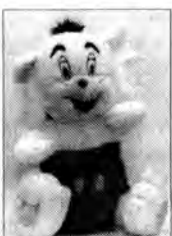
Renatka Motyka - Rzeszów