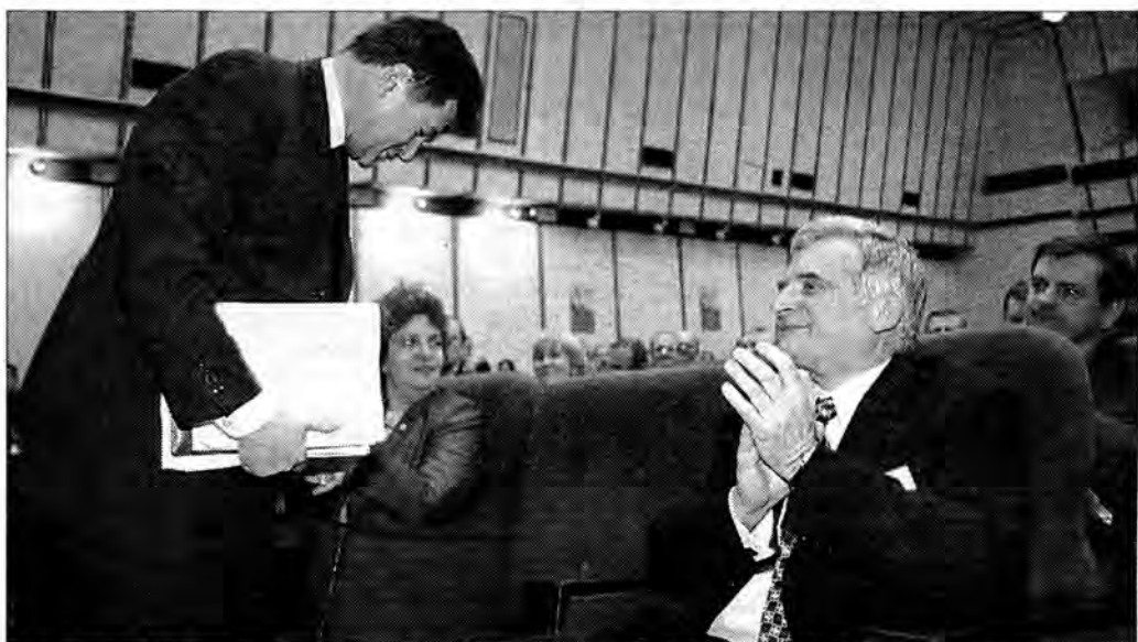
Marian Krzaklewski zgodził się być kandydatem Ruchu Społecznego AWS na prezydenta.