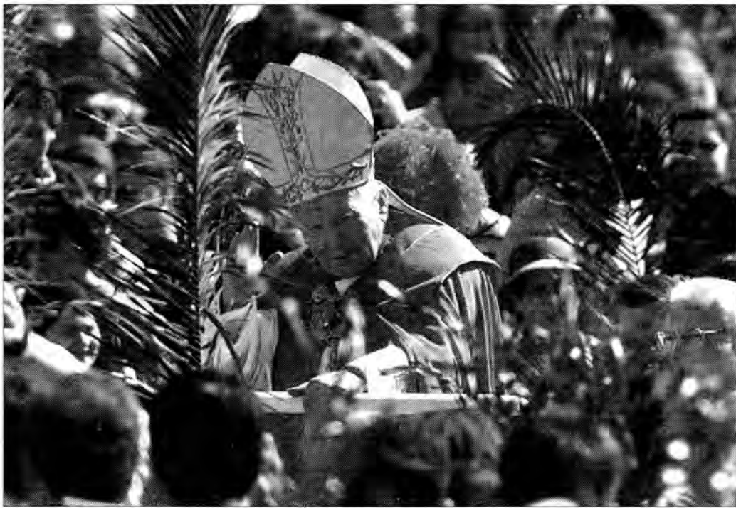
Wśród wiernych i palm na placu Świętego Piotra.

Jan Paweł II poświęcił liście palm i gałązki oliwne