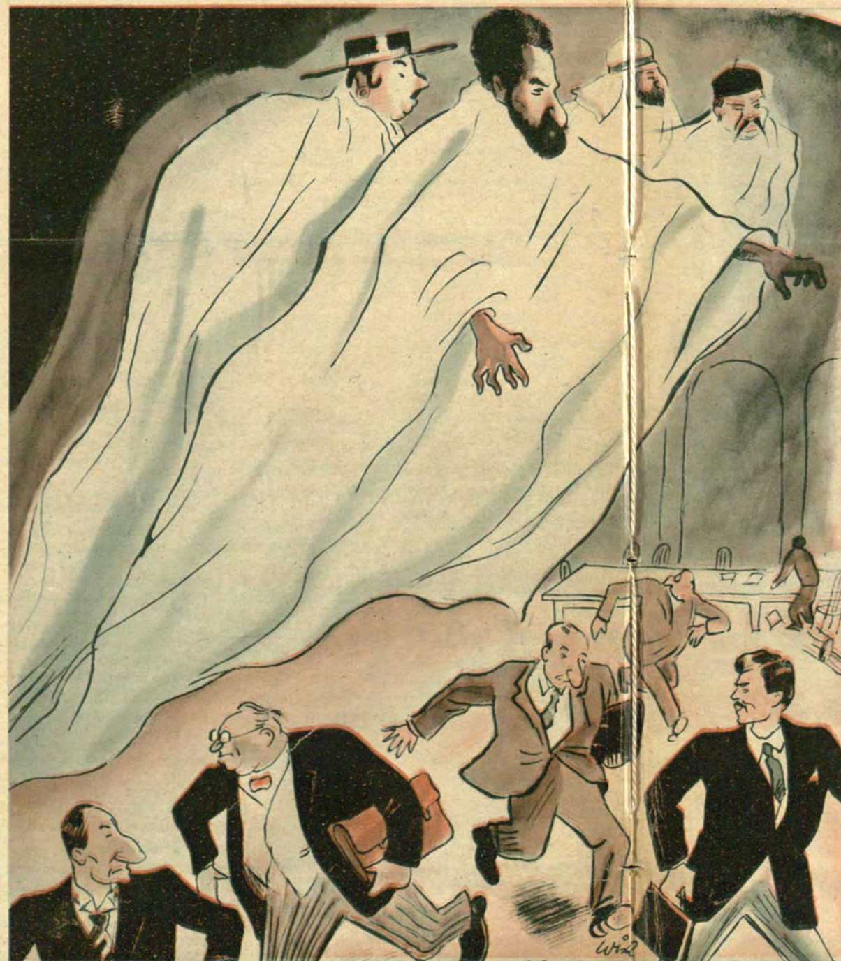
Gdy złe duchy straszą w Genewie...