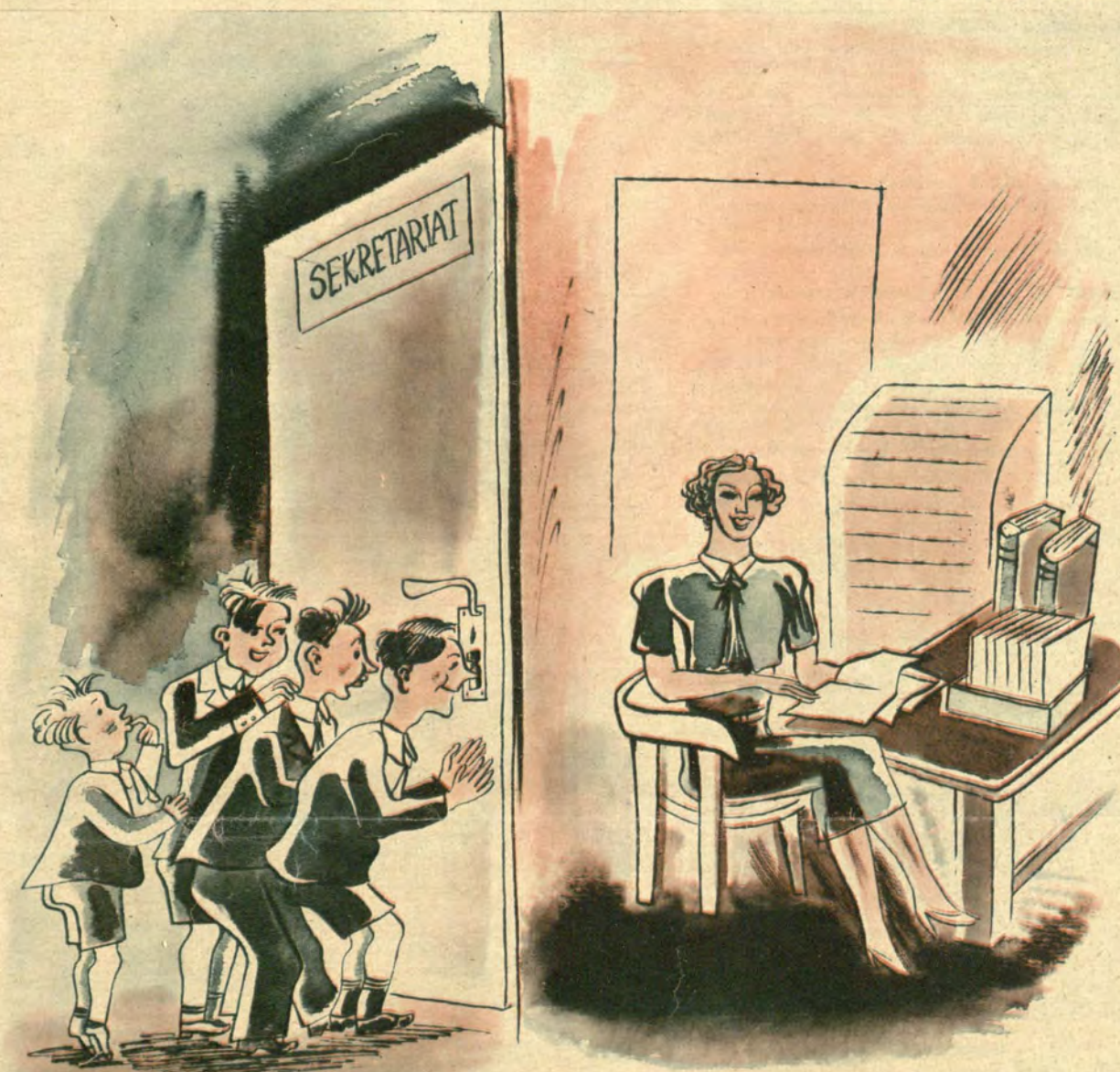
Poglądowa metoda nauczania...