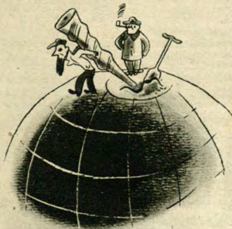
Złośliwe przesunięcie osi ziemskiej przez Trockistów!