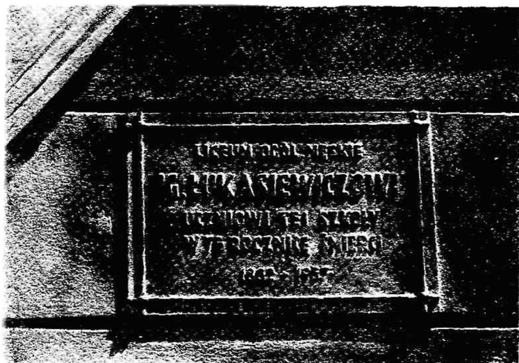
Dnia 19 maja 1957 r. uroczystie odsłonięto pamiątkową tablicę z okazji 75-letniej rocznicy I. Łukasiewicza

Pierwszą studnię o głębokości 40 m. wykopano w Palance. Poszukując źródeł ropy Łukasiewicz przenosi się z miejsca na miejsce — wreszcie osiada w Chorkowie, gdzie spędza prawie połowę swego życia. Życie Łukasiewicza było wypełnione twórczą pracą, zawsze czynny, w swoich zamierzeniach stanowczy i konsekwentny, cecho-