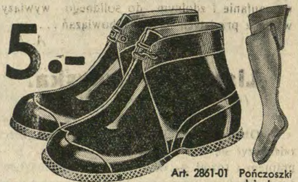
Art. 2861-01 Pończoszki dziecięce Gołogumowe dziecięce śniegowce na największą słotę. Nr. 27-34 Zł. 7.— Zł. 0.90-1.70