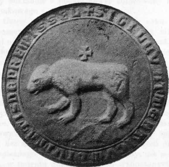
PIECZĘĆ MIASTA PRZEMYŚLA Z XIV. WIEKU.