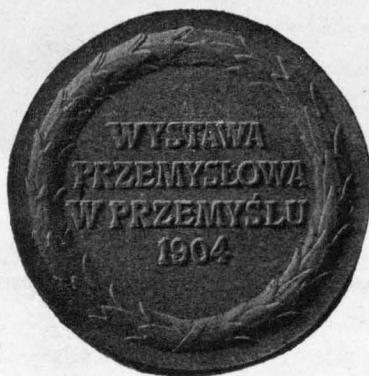
MEDAL Z WYSTAWY PRZEMYSKIEJ W 1904 ROKU.

Ze zbiorów Muzeum Narodowego w Krakowie.