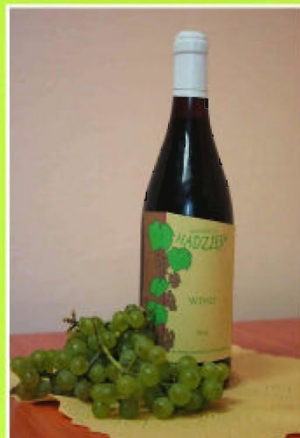
Butelka wina z etykietą winnicy