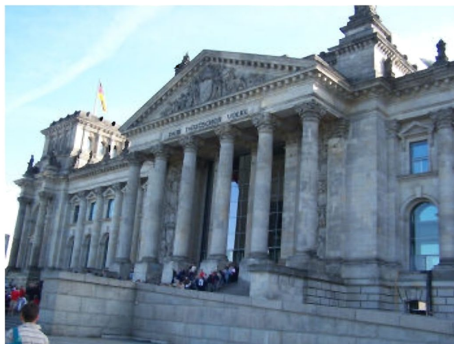
W kolejce do Reichstagu