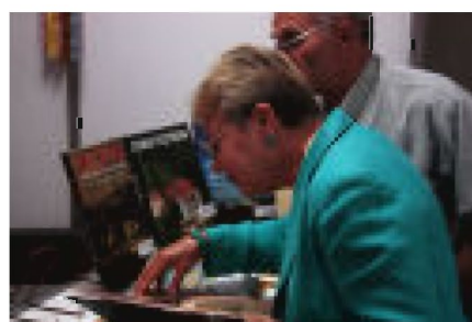
Stoisko Gminy Tyczyn. Dużym zainteresowaniem cieszyły się książki i albumy o Gminie Tyczyn