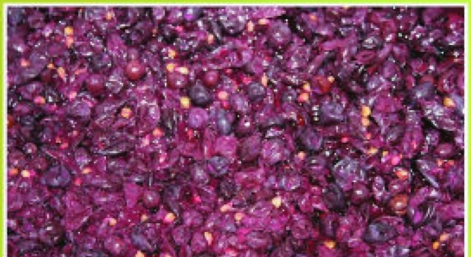
Każdy rodzaj wina zbierany jest do osobnych pojemników

Do zrobienia wina potrzebna jest nie tylko umiejętność łączenia odpowiednich smaków, ale także maszyny, dzięki którym praca sprawniej idzie