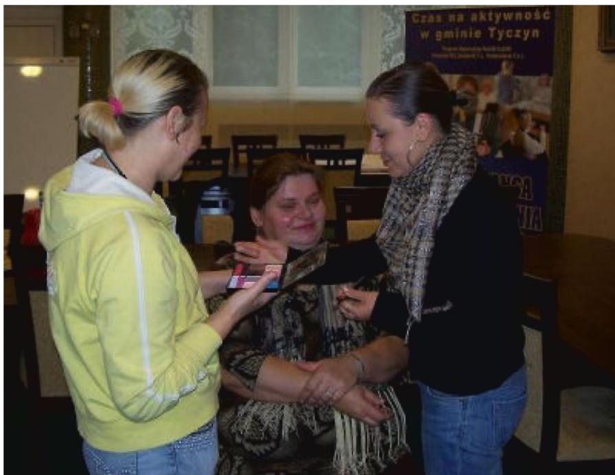
Uczestniczki kursu z zakresu wizażu, makijażu i stylizacji paznokci

Szkolenie z zakresu sprzedawcy z obsługą komputera i kasy fiskalnej, w którym bierze udział 15 uczestniczek, obejmuje 120 godzin szkoleniowych (w tym zajęcia teoretyczne 30 godz., praktyczne 90 godz.) i ma na celu przygotowanie do pracy w placówkach handlowych z wykorzystaniem kasy fiskalnej i komputera oraz naukę fachowej obsłu-