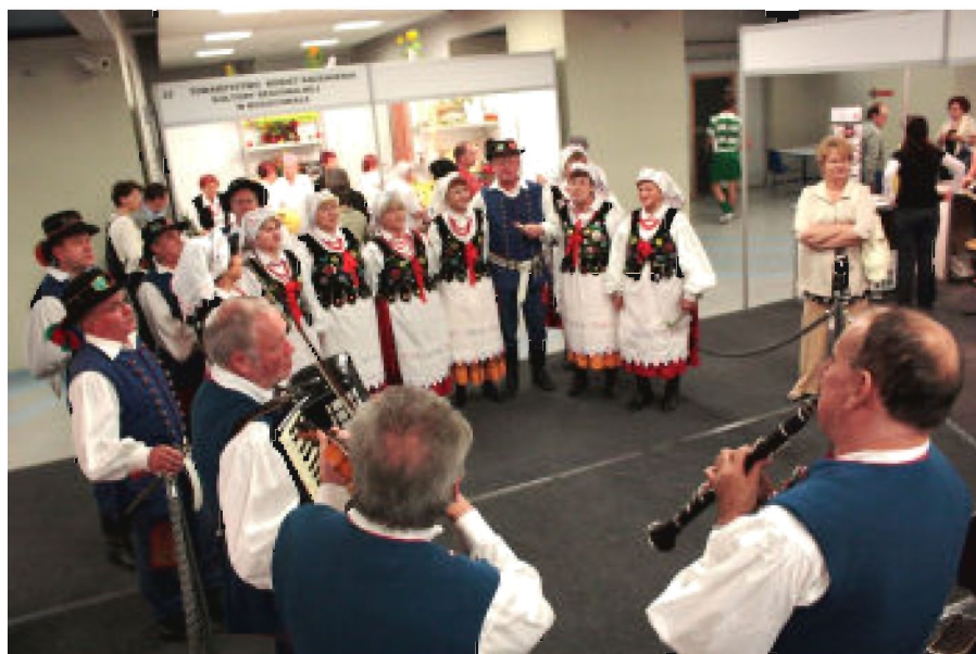
„Kapela Wójta Tycznera” i „Tyczyniaczy”

Nasza gmina znana jest z wydawnictw książkowych, których również nie mogło zabraknąć na sobotniej imprezie. Szczególną popularnością cieszyły się wspaniale ilustrowane albumy.