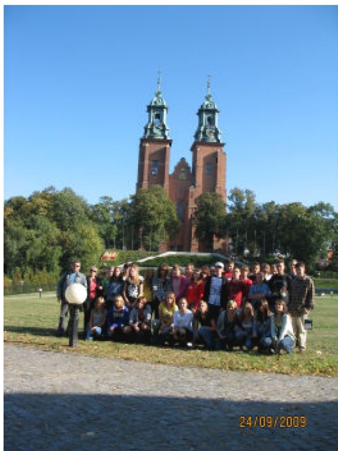
Katedra w Gnieźnie

W trakcie wycieczki zobaczyliśmy miejsca związane z początkami państwowości polskiej: katedrę w Gnieźnie - miejsce spoczynku pierwszego patrona Polski - świętego Wojciecha, wspaniałe Drzwi Gnieźnieńskie, na których przedstawiono życie i śmierć świętego - jest to jedyny tego typu obiekt w Europie, w katedrze miały także miejsce koronacje pięciu władców Polski.