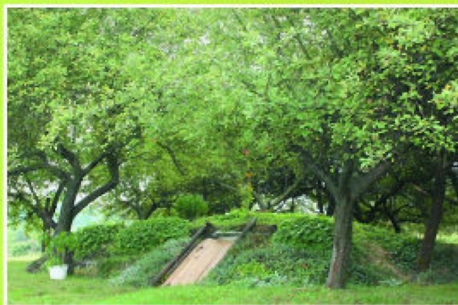
Efektowna piwniczka, obsadzona roślinami i kwiatami