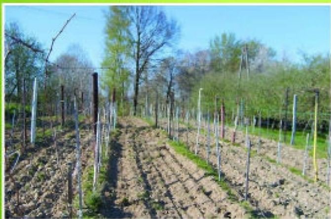
Wiosną wino odradza się do życia