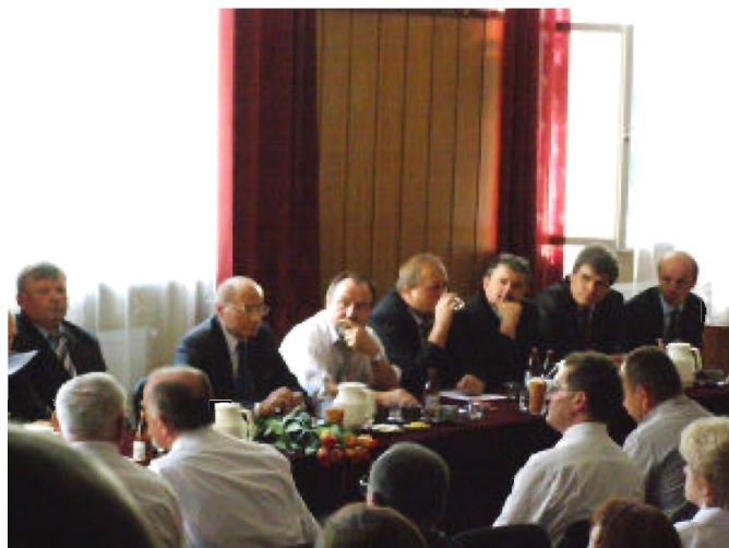
Fot. i tekst Agnieszka Malinowska

Spotkanie z mieszkańcami rozpoczęło się o godz. 14.00 w sali Domu Ludowego i trwało prawie 3 godziny. Prezydent obiecał przeznaczyć na Budziwoj w 2010 r. 6 mln zł. Na zakończenie wręczył podziękowania osobom, które aktywnie działały na rzecz przyłączenia Budziwoja do Rzeszowa.