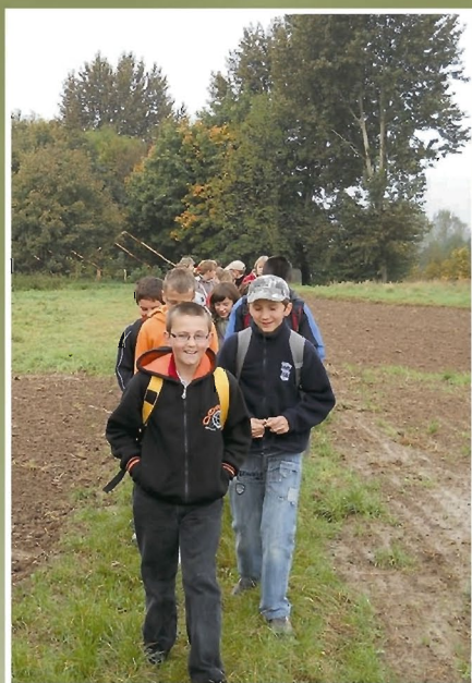
Grupa z SP w Kielnarowej na szlaku