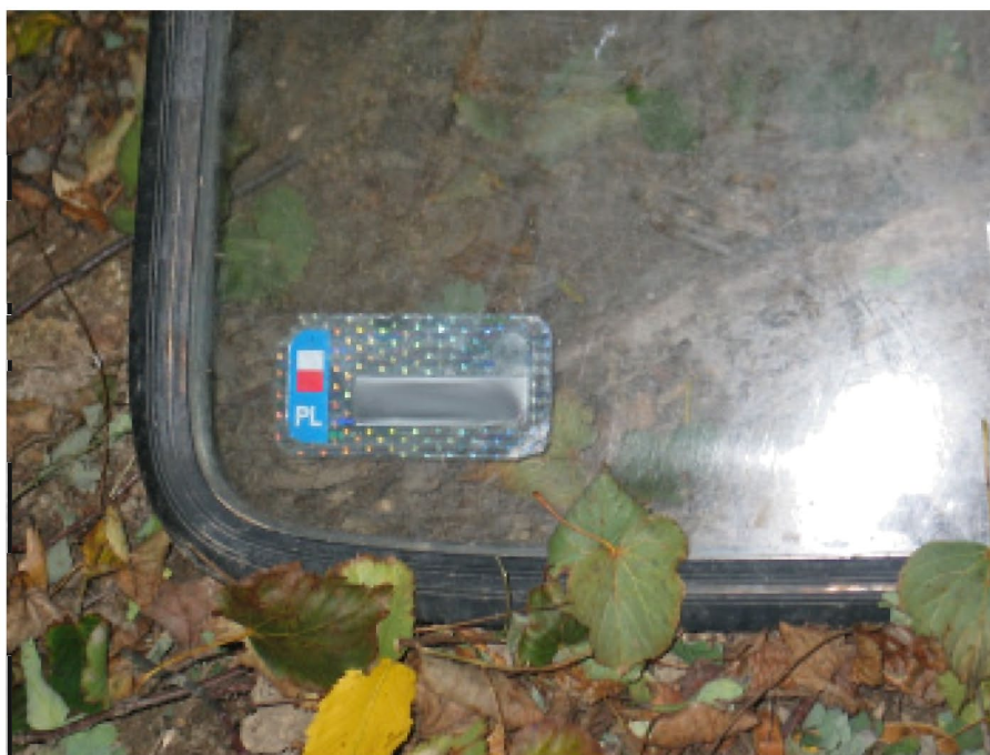
Na wyrzuconej szybie widoczne są numery rejestracyjne samochodu, które w związku z ochroną danych osobowych zamazujemy

„Życzliwemu” za przesłany materiał serdecznie dziękujemy! Cieszymy się, że wśród nas są ludzie dla których ochrona środowiska jest ważna. Bez wątpienia właściciel wyrzuconej szyby poniesie zasłużone konsekwencje.