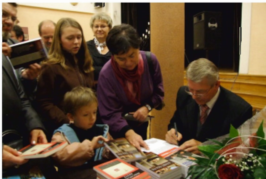
Senator Czesław Ryszka podpisuje swoje książki