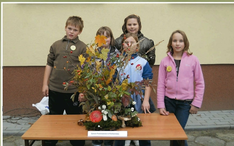
Uczestnicy konkursu plastycznego z wykonaną pracą