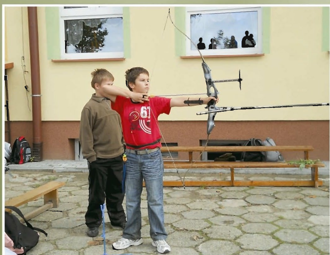
Pokaz strzelania z łuku sportowego