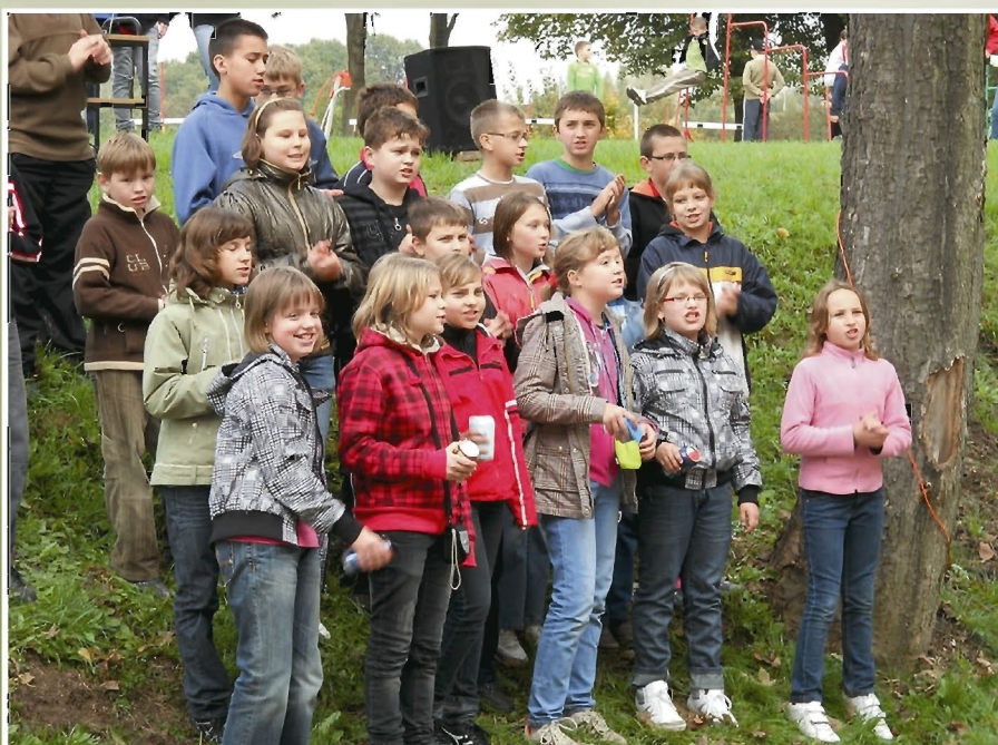
Konkurs na piosenkę rajdową

2 października odbył się XXVIII Rajd Pieszy Uczniów Szkół Podstawowych Gminy Tyczyn. Z pięciu szkół naszej gminy na samodzielnie opracowane trasy, dostosowane do możliwości uczniów i pogody, wyruszyły grupy uczniów wraz z opiekunami. Wszystkie trasy wiodły do Kielnarowej, gdyż nasza szkoła była organizatorem tegorocznego rajdu.