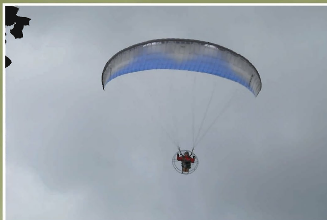
Pokaz lotu na paralotni