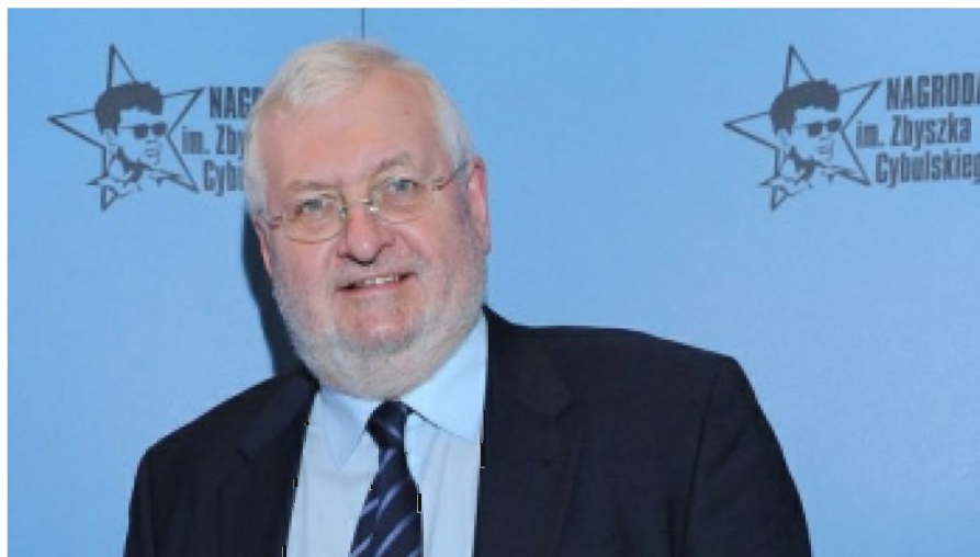
Janusz Zaorski reżyser filmu „Syberia polska”