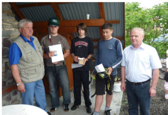
Zwycięzcy zawodów w kategorii wiekowej 15-16 lat