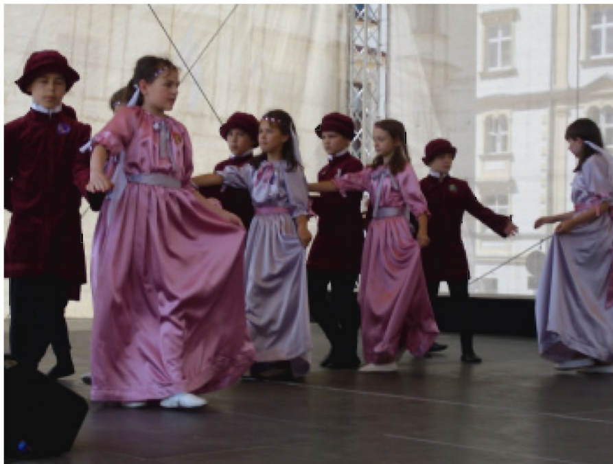
Kl. III SP w Hermanowej podczas występu na rzeszowskim Rynku