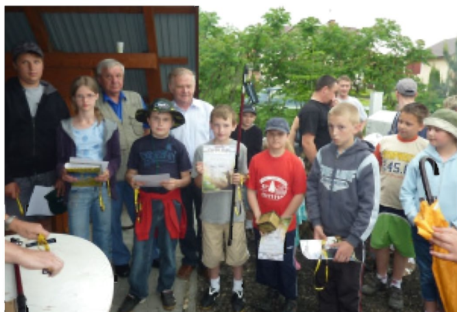
Zwycięzcy zawodów w kategorii wiekowej 11-14 lat