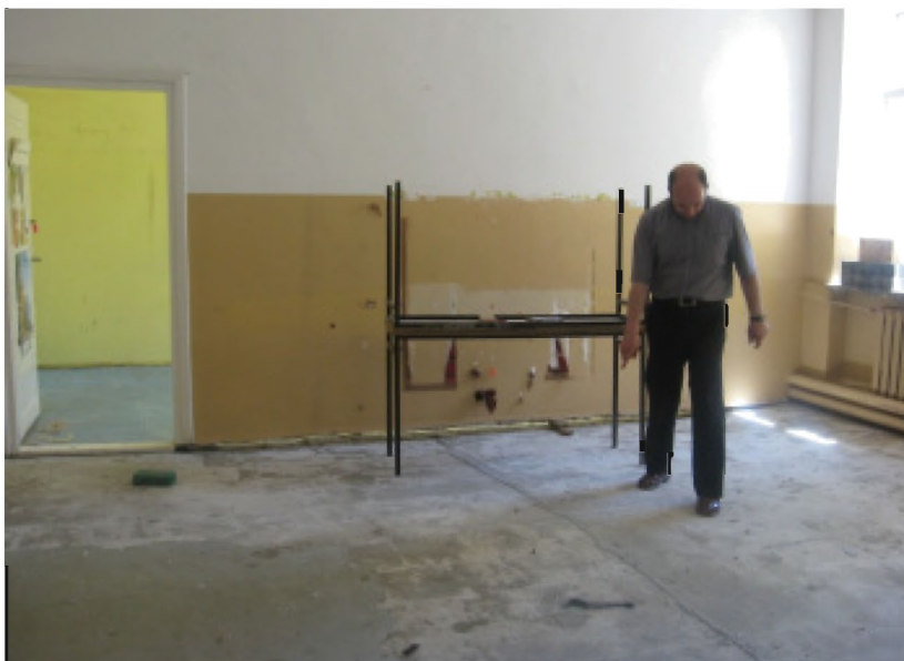
W trakcie powodzi zostały zniszczone sale lekcyjne w Szkole Podstawowej w Sobowie

Przebywając na tych terenach bardziej uświadamiamy sobie, jakie ma znaczenie istota ludzka w tym wielkim