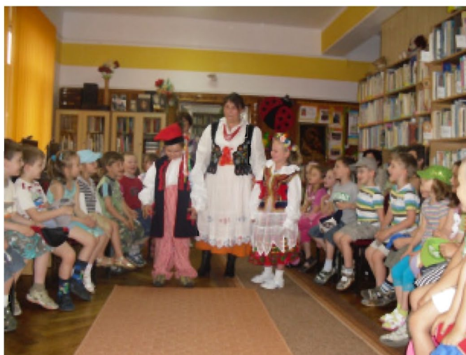
Przedszkolaki w dawnych strojach