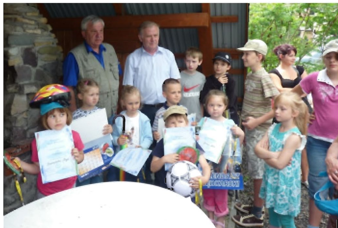
Zwycięzcy zawodów w kategorii wiekowej 3-6 lat