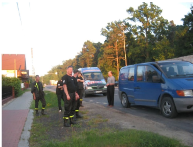
W drodze do terenów poszkodowanych