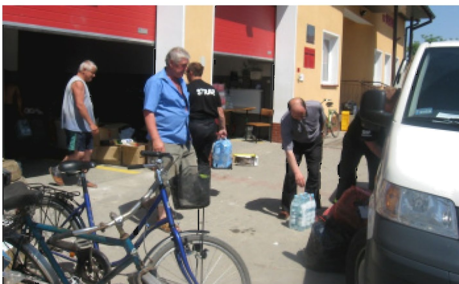
Pomoc dla Sobowa

Choć towarzyszą im łzy, załamanie, depresja i dominuje strach przed kolejną powodzią to nawzajem się pocieszają. Martwią się o żywy dobytek –