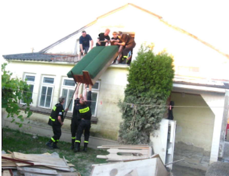
Strażacy z Hermanowej pomagają powodzianom