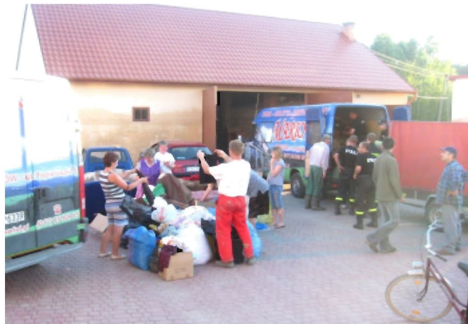
Załadunek darów i przekazanie ich mieszkańcom Sokolnik

krowy, świnię, dla których brakuje pa-szy. Dostawy od darczyńców nie wy-starczają, a na polach tylko błoto i tu li-czą na pomoc ludzi dobrego serca. Na-szą zachętą do dalszej pomocy jest ich ogromna wdzięczność, jaką okazują nam ofiarodawcom.