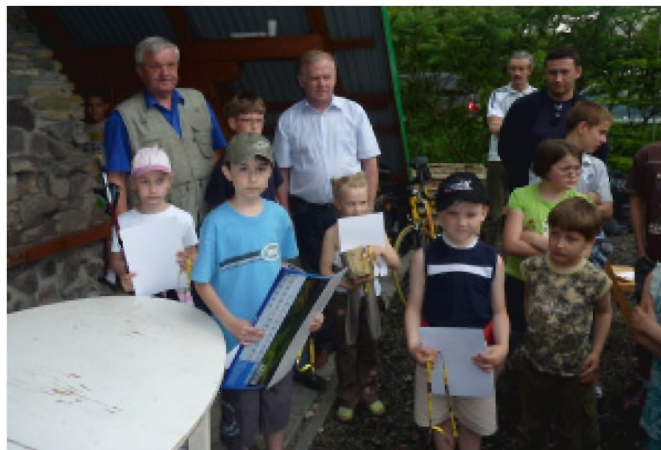
Zwycięzcy zawodów w kategorii wiekowej 7-10 lat