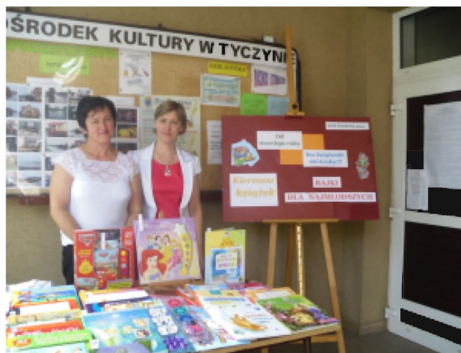
Kiermasz książek dla dzieci