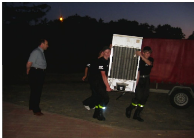
Przekazanie powodzianom w Sobowie zebranego sprzętu AGD

wszechświecie – jedna chwila i dobytek całego życia się rozpada. Wszyscy stają się równi, ten, co posiadał piękną willę czy prosty normalny dom – wszyscy mają jedno, błoto, muł w mieszkaniach, wodę w piwnicach do dziś, stopy zalanych mebli, odzieży leżą przed każdym domem – jednym słowem na ten widok wielka rozpacz ogarnia człowieka.