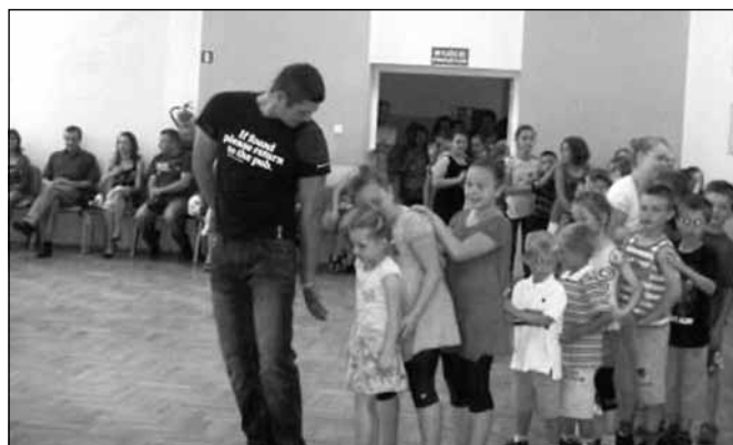
Piknik rodzinny w Woli Zgłobieńskiej

W Ośrodku Kultury w Kielanówce dorośli i dzieci bawili się podczas pikniku rodzinnego „Dla małych i dużych”.