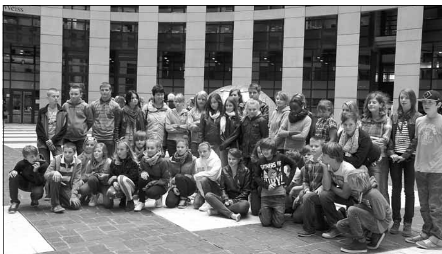
Grupa na dziedzińcu Parlamentu Europejskiego w Strassburgu

Na szczególną uwagę zasługuje fakt, że młodzież z obu krajów świetnie się wspólnie bawiła, nie było problemów z porozumiewaniem się, a wszyscy bardzo się polubili i ciężko było się rozsta-