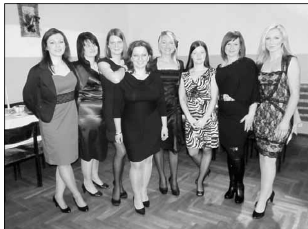
Członkinie Koła Gospodyń Wiejskich w Zarzeczcu

gdyż wbrew stereotypom, członkiniami Koła są coraz młodsze kobiety – pełne zapału do działania, otwarte na zmiany, szukające nowości, pragnące w czymś się realizować i rozwijać umiejętności.