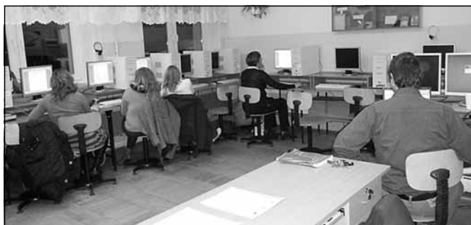
Realizacja projektu „ Moje życie w moich rękach”

Lokalny Ośrodek Kultury „Wspólnota” w Zgłobniu w okresie 01.09.2011 – 29.02.2012 realizował projekt pt: „Moje życie w moich rękach” w ramach działania 7.3 – Inicjatywy lokalne na rzecz aktywnej integracji współfinansowany przez Unię Europejską w ramach Europejskiego Funduszu Społecznego. Uczestnikami projektu było 20 osób bezrobotnych z terenu Gminy Boguchwała.