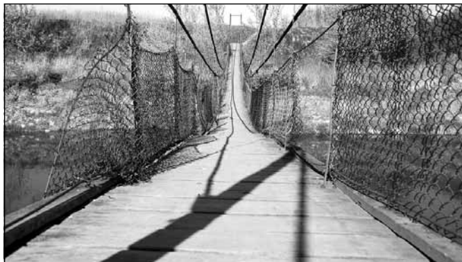
Kładka nad Wisłokiem w Boguchwale

Mówi się, że koszt inwestycji to około 14 mln złotych. Pięniądze na realizację mają przekazać miasto Rzeszów i Gmina Boguchwała. Władze gminy planują pozyskać środki z Unii Europejskiej i z powiatu rzeszowskiego. Są szanse, że prace ruszą już w przyszłym roku.