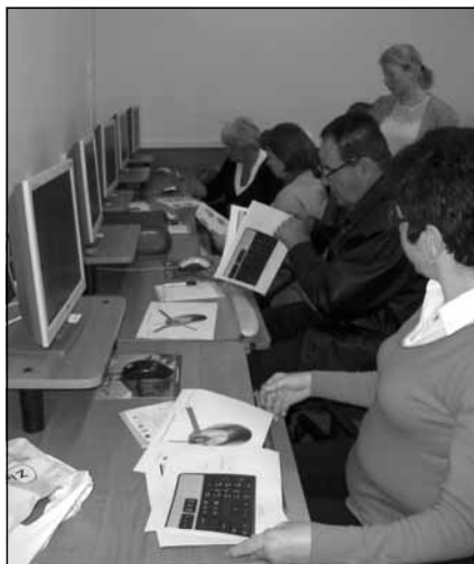
Uczestnicy kursu komputerowego w Mogielnicy

Gminna Biblioteka Publiczna w Boguchwale ul. Tkaczowa 146, telefon: 17 87 15 355