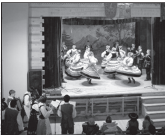
Albigowianie podczas występu w Bukowinie Tatrzańskiej.