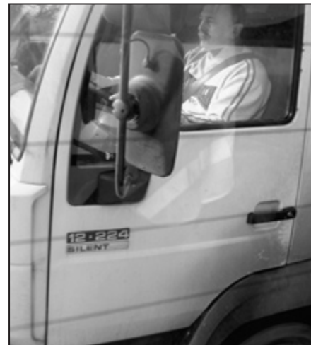
Kurs prawa jazdy – zajęcia praktyczne.

Projekt będzie realizowany w dalszym ciągu do października br. i zakończy się objęciem jego uczestników programem staży