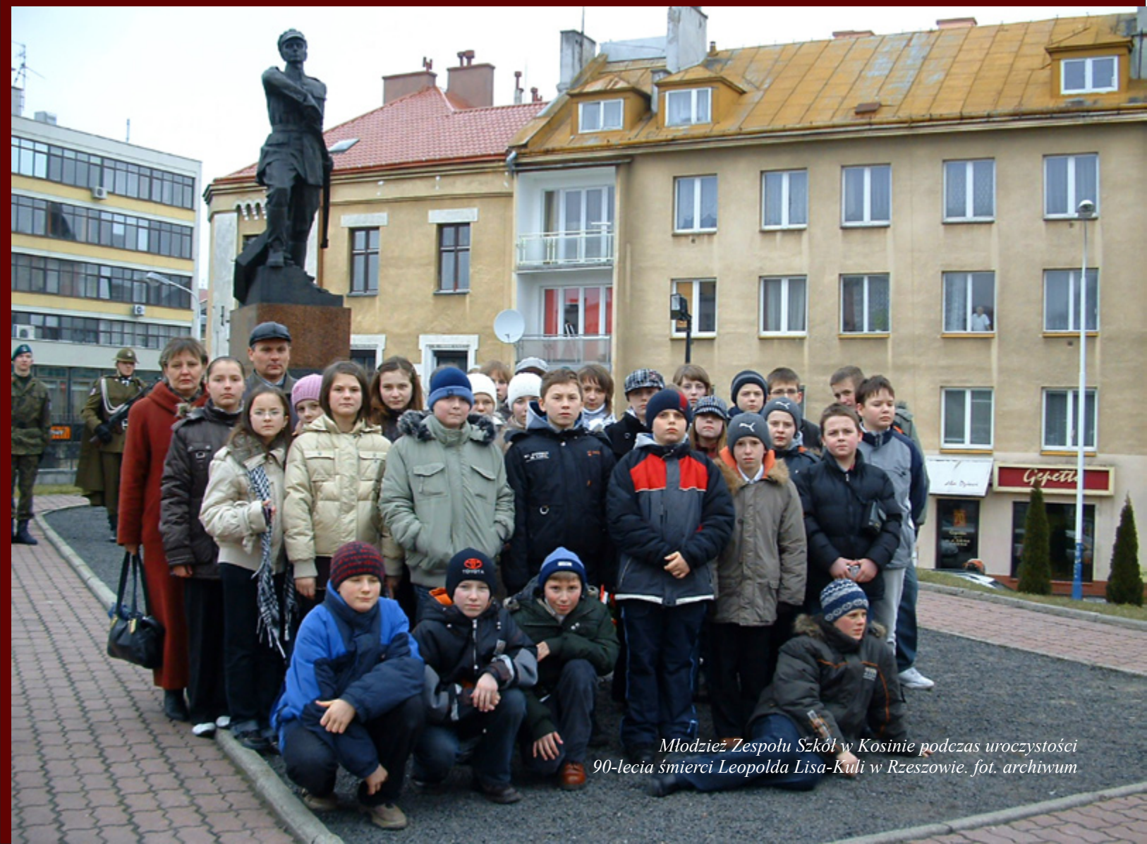
Młodzież Zespołu Szkół w Kosinie podczas uroczystości 90-lecia śmierci Leopolda Lisa-Kuli w Rzeszowie.