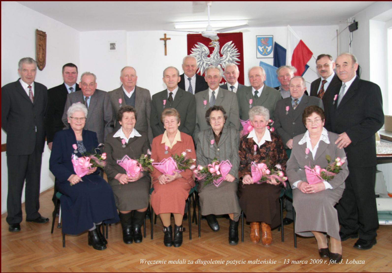
Wręczenie medali za długoletnie pożycie małżeńskie – 13 marca 2009 r.