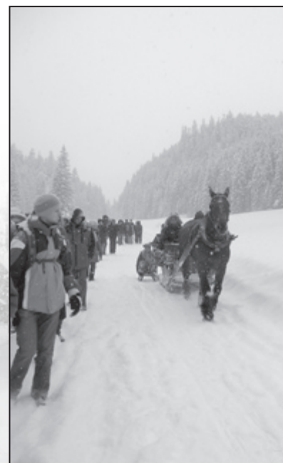
W Dolinie Kościeliskiej

zagranicznych. Pierwszego dnia naszego pobytu w stolicy Tatr mieliśmy przyjemność spacerować po Krupówkach, gdzie kupowaliśmy pamiątki, oscypki, podziwialiśmy zaprzęgi saneczkowe. Tego dnia byliśmy także w Bazylice Mniejszej ks. Pallotynów na Krzeptówkach, słynie ona z kunstownego, charakterystycznego dla stylu góralskiego wystroju. Uwieńczeniem dnia był koncert na scenie Domu Kultury w Bukowinie Tatrzańskiej, gdzie obydwie zespoły zaprezentowały swój program. Wysłuchaliśmy także gawęd opowiadanych przez członków zespołu „Zawaternik” piękną góralską gwarą. Kolejny dzień rozpoczął się koncertem „Młodych Albigowian” i kapeli w Zespole Szkół Leśnicy. Z wielką radością śpiewaliśmy piosenkę „Idzie dysc” wspólnie ze słuchaczami. Następnie udaliśmy się do muzeum – Zagrody Korkoszów w Czarnej Górze – zabudowania bogatego górala. Oglądając przedmioty codziennego użytku, narzędzia rolnicze usłyszeliśmy wiele ciekawych informacji o życiu i kulturze mieszkańców Podhala. Wieczór tego dnia był pełen wrażeń. Podczas spotkania integracyjnego z członkami zespołu „Zawaternik” oglądaliśmy tańce z ciupagami przy akompaniamencie kapeli smyczkowej. Wspólny śpiew i zabawy trwały do późnego wieczora.