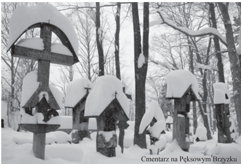
Cmentarz na Pęksowym Brzyzku

Polsce – po warszawskich Powązkach i krakowskim Cmentarzu Rakowickim. Odwiedziliśmy groby sławnych Polaków: Kornela Makuszyńskiego, Stanisława Witkiewicza, Heleny Marusarzówny. Piękne zimowe Tatry pożegnaliśmy po mszy św. odprawionej w niedzielny poranek w uroczym górskim kościółku w Leśnicy.