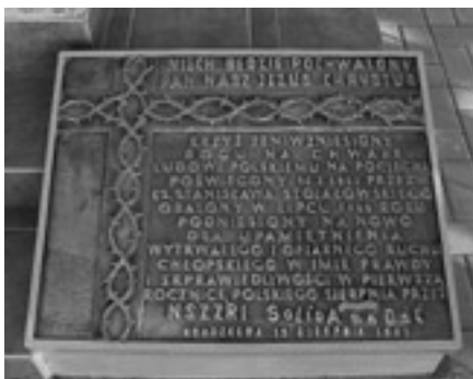
Pamiętkowa tablica z 1981 r.

Dopiero powstanie Solidarności dało nadzieję na odbudowę krzyża. Nowy Krzyż został postawiony ze zbiórki funduszy wśród mieszkańców Kraczkowej. Uroczystość postawienia nowego Krzyża na Błoniach miała miejsce 16 sierpnia