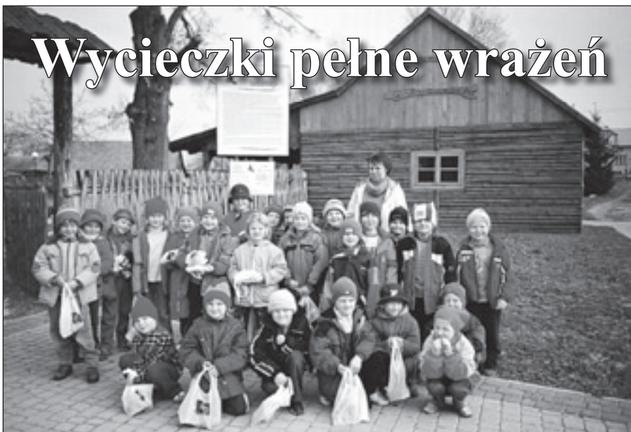
Przed Zagrodą Garncarską w Medyni Głogowskiej