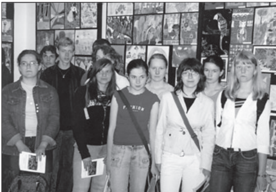
Młodzi artyści podczas wyprawy w BWA w Rzeszowie