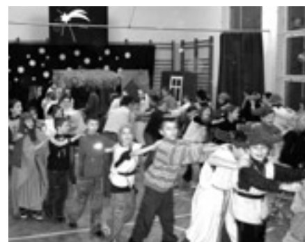
Bal z dziećmi z grupy integracyjnej