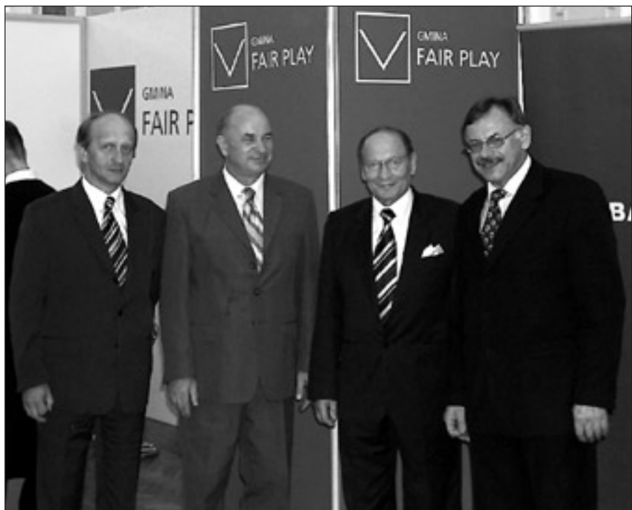
Zdjęcie: Wójt Gminy Łańcut wraz z Prezydentem Miasta Rzeszowa, Burmistrzem Miasta Łańcuta i Burmistrzem Miasta Leżajska.