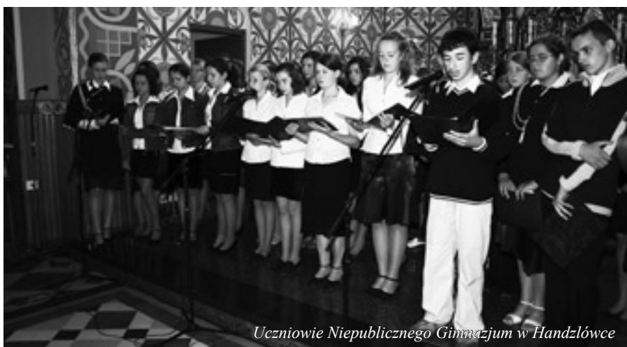
Uczniowie Niepublicznego Gimnazjum w Handzlówce