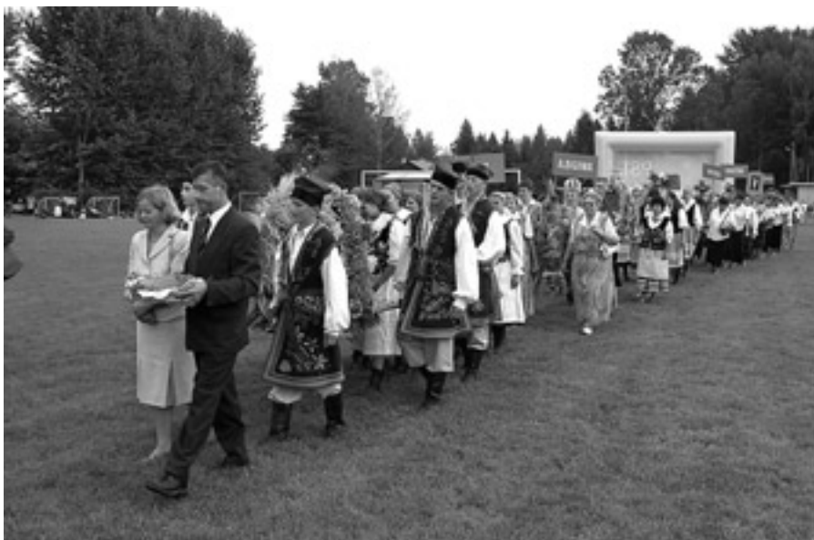
Korowód dożynkowy

W okresie międzywojennym zaczęto organizować dożynki gminne, powiatowe