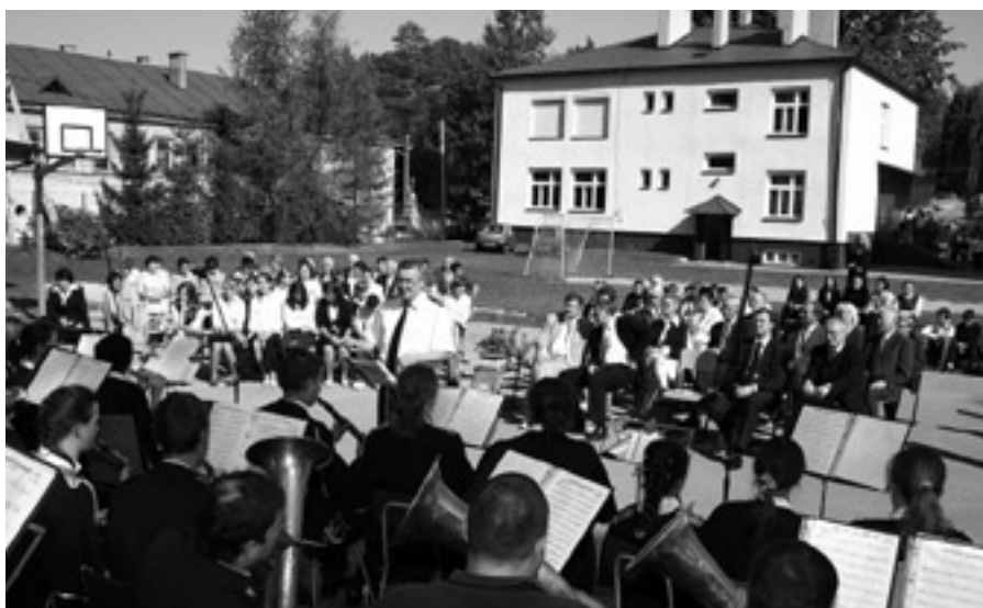
Koncert Orkiestry Dętej OSP w Handzlówce