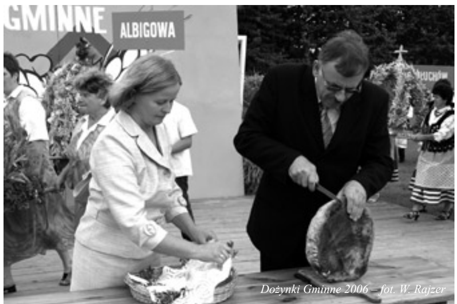
Dożynki Gminne 2006