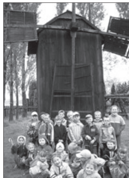
Skansen w Markowej

W maju 2006 r. głuchowskie przedszkolaki odwiedziły kolebkę dziedzictwa kulturowego naszego regionu-Skansen w Markowej. Podczas zwiedzania Skanse-