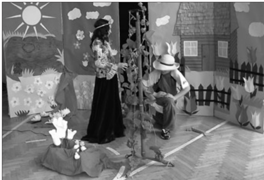
Jest taki kwiat

Od lutego rozpoczęły się przygotowania do następnego przedstawienia pt. „Wielkanocne świętowanie” . Dzieci wcielały się w role Skrybów, opowiadających o dawnych zwyczajach i obrzędach, w role Postu, Piątku, Wielkiej Soboty. Inne odtwarzały role pisanek pięknie wymalowanych czy też role wielkanocnych bab. Przygotowywały pracochłonne dekoracje i liczne rekwizyty. Śpiewały piosenki i opracowywały drobne elementy choreograficzne. Widowisko ukończono tuż przed świętami i zaprezentowano społeczności uczniowskiej i gimnazjalnej