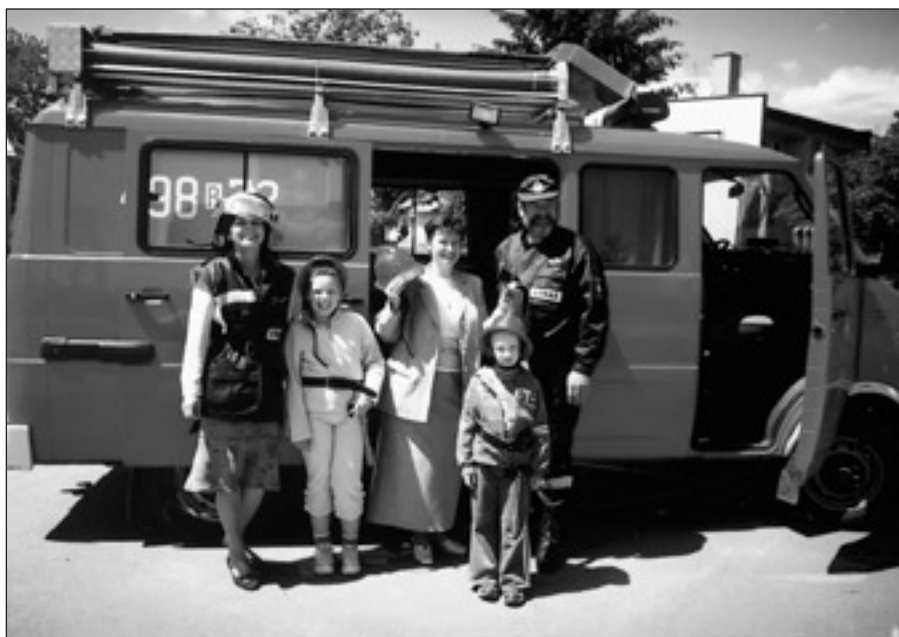
Wycieczka wozem strażackim „Florek”