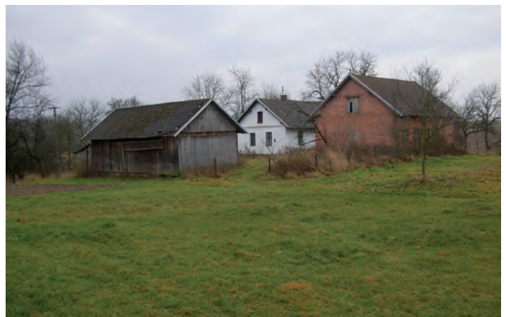
Działka oznaczona nr 206 o pow. 1.1407 ha w Zmysłówce

III przetarg ustny nieograniczony odbędzie się w dniu 06 maja 2011 roku o godz.10.00 w Urzędzie Gminy Grodzisko Dolne (pokój nr 5).