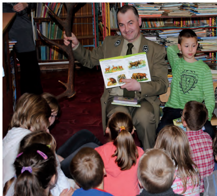
Na spotkanie z dziećmi leśniczy przyniósł wiele ciekawych rekwizytów

Wielkim atutem spotkania były liczne rekwizyty przyniesione przez gościa. Dzieci uwielbiają jak mogą o czymś usłyszeć i to zobaczyć... a tym razem było co oglądać. Skóra z lisa, wyprawiona wiewiórka, kuropatwa, ogromne poroże jelenia i kilka małych poroży kozioków. Poza tym tajemnicze sprzęty do pomiaru grubości i wysokości drzew, a nawet przenośny komputer leśniczego. Dzieci