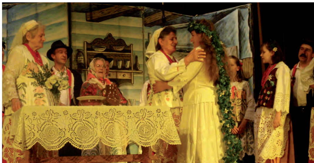
Grodziszczoki zaprezentowały fragment Wesela Grodziskiego

Wśród tych obrzędów charakterystyczne są obrzędy rodzinne, obrzędy i zwyczaje związane z cyklem prac na roli oraz obrzędy i zwyczaje doroczne, związane z cyklem wszystkich świąt kościelnych oraz okresem Wielkiego Postu i Adwentu.