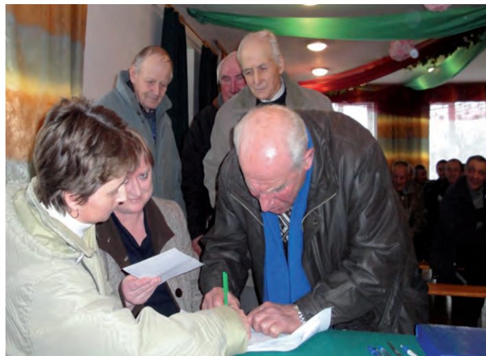
Głosowanie w Grodzisku Nowym