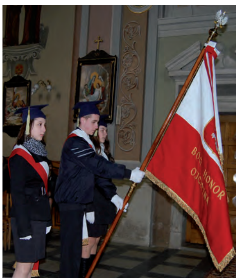
Młodzież gimnazjalna z pocztą sztandarowym