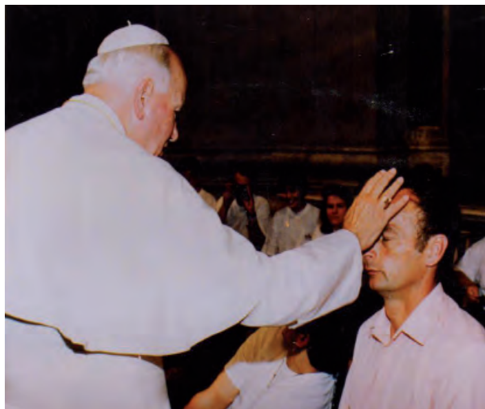
Niektórzy mieli szczęście otrzymać błogosławieństwo z rąk samego Ojca Świętego

Wizyta papieska z 1999 roku to kontynuacja katechez wygłoszonych w czasie podróży z 1997 roku. Świadectwem tej pielgrzym-