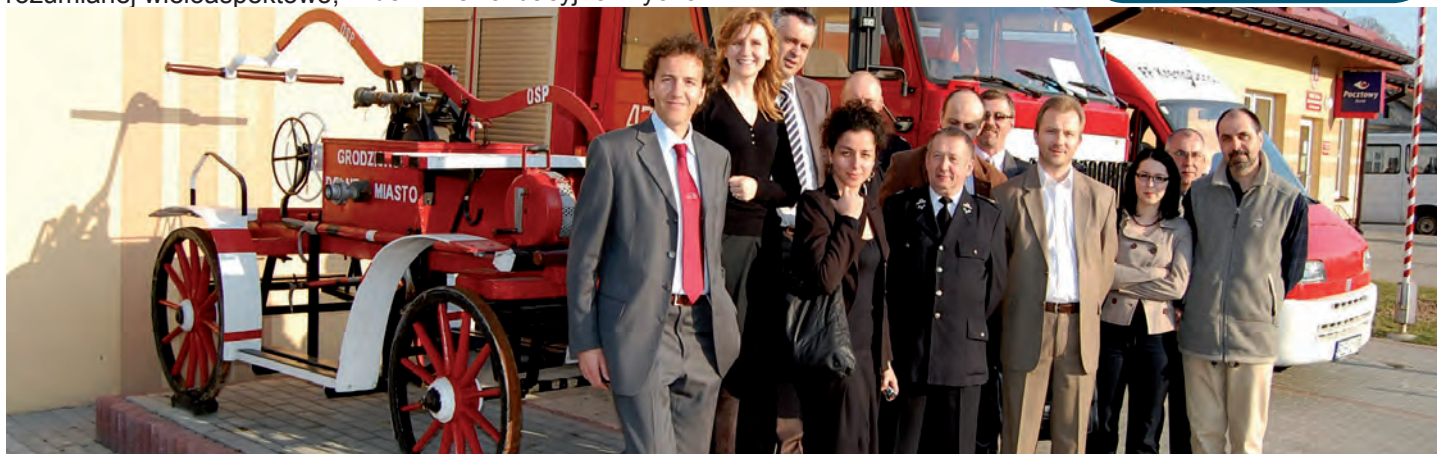
Wizytę delegacji w naszej gminie zakończyło spotkanie w remizie w Miasteczku

- projekt dotyczy opracowania i wdrożenia nowatorskiego systemu monitorowania usług publicznych w administracji samorządowej woj. lubelskiego i podkarpackiego. W ramach projektu powstanie nowatorski, wielopłaszczyznowy system monitorowania usług publicznych, który będzie badał kluczowe obszary działania samorządu i który zakłada pełne uczestnictwo odbiorców tych usług. System ten ponadto będzie pokazywał całościową analizę kosztów usług publicznych. Działania w ramach projektu odbywają się przy udziale partnera włoskiego, posiadającego wieloletnie doświadczenie w monitorowaniu usług świadczonych przez Region Lombardii i Sycylii. Grupą docelową projektu jest kadra kierownicza i pracownicy: Starostwa Powiatowego w Leżajsku, UG Leżajsk, UG Grodzisko Dolne w woj. podkarpackim oraz UM Lublin, UM Świdnik, UMiG Ponia-towa i UG Konopnica w woj. lubelskim oraz obywatele, radni, pracodawcy i przedsiębiorcy pracujący bądź zamieszkali na terenie wskazanych wyżej samorządów.