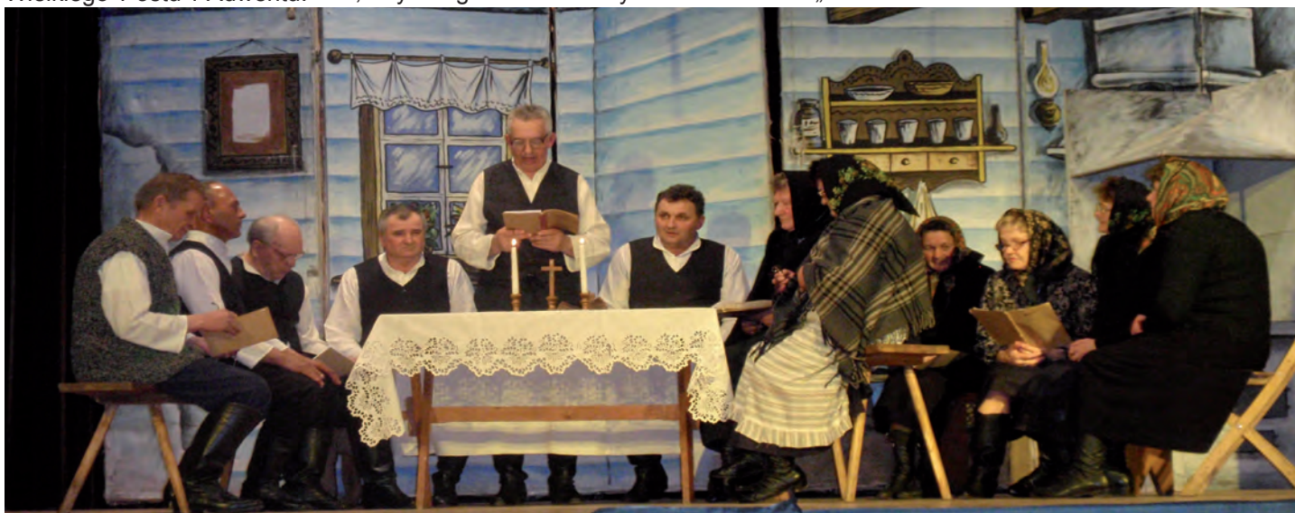
W tegorocznym konkursie Zespół Leszczynka zajął trzecie miejsce