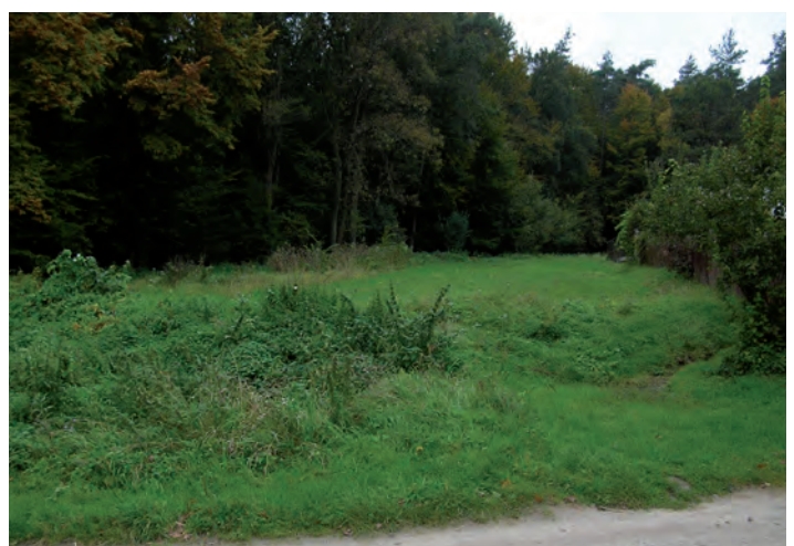
Działka nr 352/3 o pow. 0.2233 ha w Zmysłówce

Warunkiem przystąpienia do przetargu jest wpłata wadium gotówką lub obligacjami Skarbu Państwa w wysokości 10% ceny wywoławczej najpóźniej