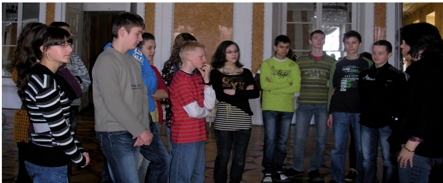
Lekcja muzealna na Zamku w Łańcutcie