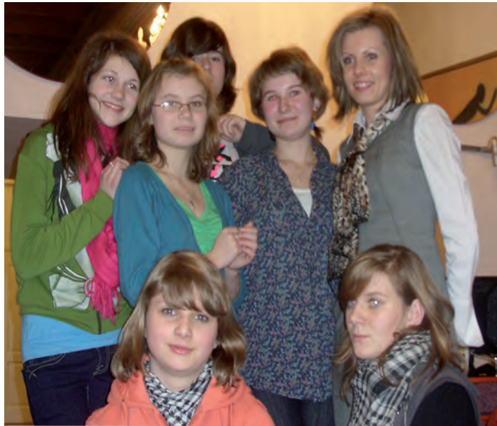
W krakowskiej siedzibie szkoły językowej British Council

Wizytę w dawnej stolicy Polski rozpoczęto od Wzgórza Wawelskiego. Przed wejściem do Katedry św. Stanisława i św. Wacława na grupę czekał przewodnik