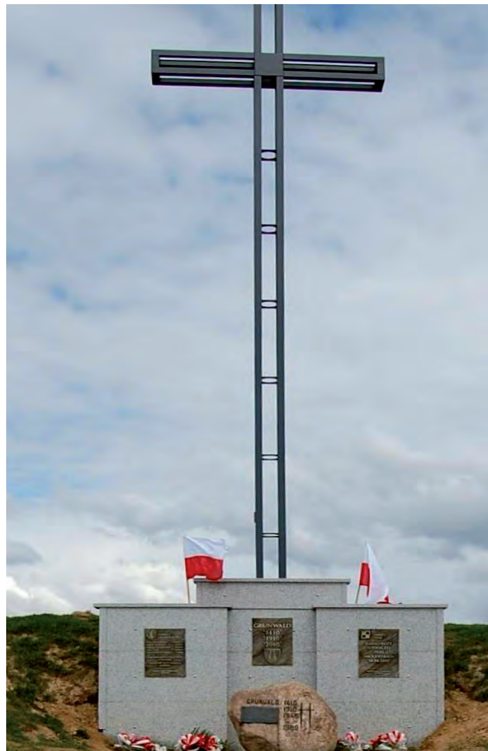
Krzyż Grunwaldu oraz tablice Grunwald, Katyń, Smoleńsk