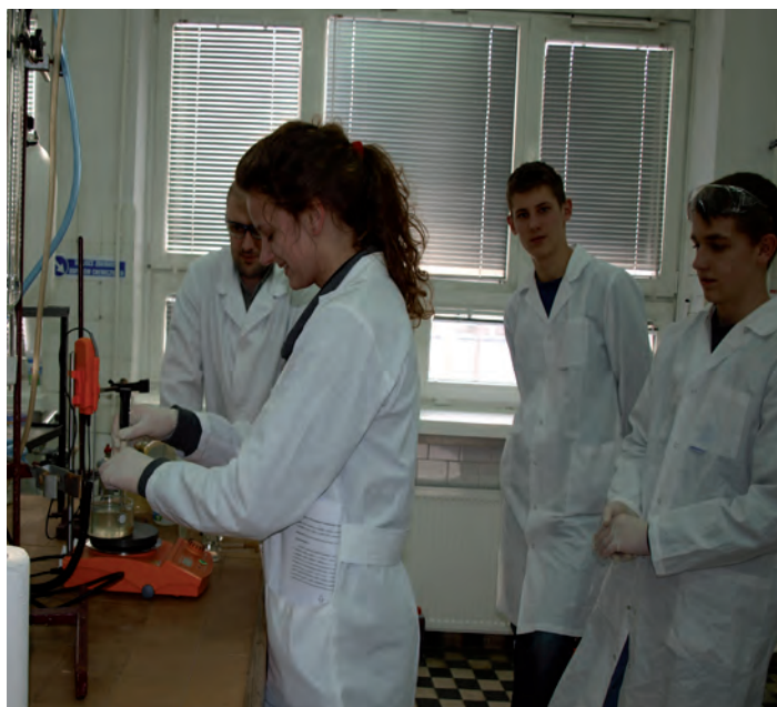
Każdy mógł się sprawdzić w roli chemika

Od października do marca przez dziesięć sobót braliśmy czynny udział w zajęciach wzbogacających naszą wiedzę o nowe, ciekawe wiadomości. Dzięki wykładom mogliśmy poczuć się jak prawdziwi studenci. Zobaczyliśmy mnóstwo ciekawych eksperymentów i przeprowadzaliśmy wiele różnych doświadczeń, które