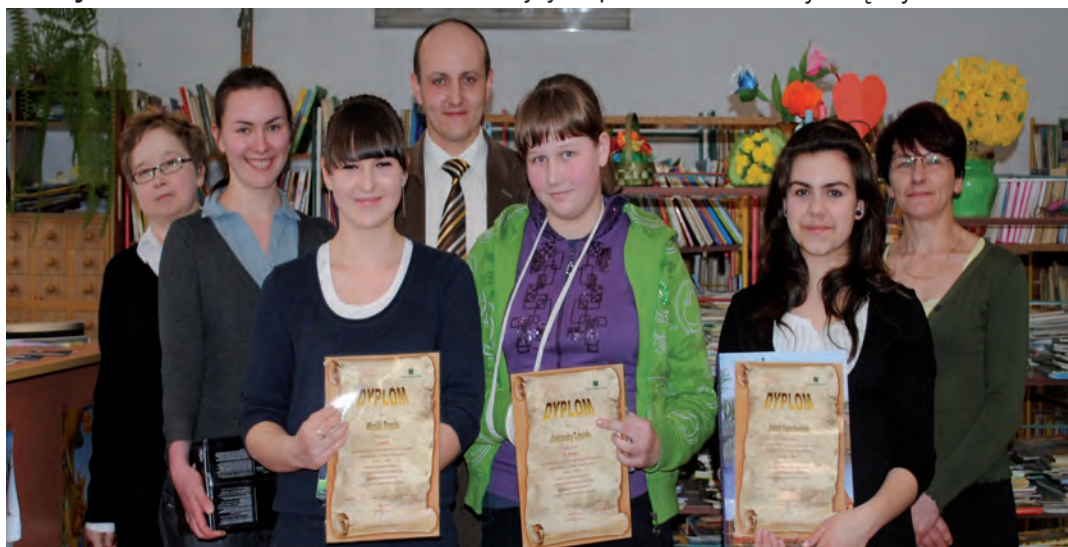
Laureaci pierwszego etapu konkursu fotograficznego