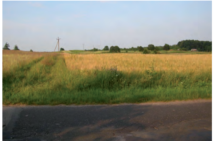
Działka oznaczona nr 228 o pow. 0.6754 ha w Zmysłówce

Warunkiem przystąpienia do przetargu jest wpłata wadium gotówką lub ob-