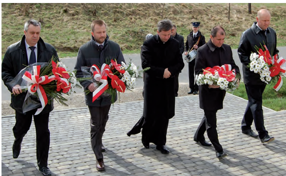
Złożenie kwiatów pod pamiątkowymi tablicami