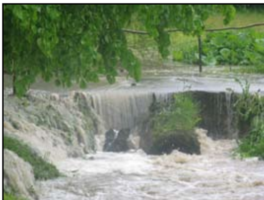
Zalane tereny w gminie Domaradz

Ponadto woda podmyła i zniszczyła 14 kilometrów dróg.