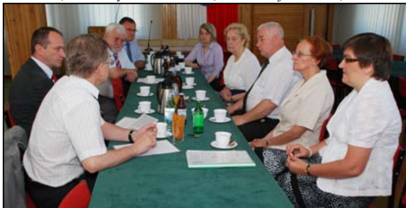
Obrady Zarządu Fundacji

Fundacja zorganizowała też m. in. akcję „Weekend dla serca”, podczas której mieszkańcy mogli bezpłatnie zmierzyć sobie ciśnienie, zbadać poziom cukru i cholesterolu we krwi, zrobić badania EKG oraz bezpłatne badania profilaktyczne w kierunku chorób nowotworowych. Zakupiła też piec gazowy c.o. (2500 tys. zł) rodzinie, która w wyniku pożaru znalazła się w trudnej sytuacji życiowej. Ogółem Fundacja pozyskała w roku 2009 blisko 105 tysięcy złotych. Najwięcej pochodziło od osób prywatnych (92 tys. zł. – w tym z odpisu 1 procenta podatku 46 tys. 500 zł.) i firm (9300 zł.). Realizacja celów statutowych w ubiegłym roku kosztowała Fundację 65 tys. 400 zł. – Zakładając Fundację chciałam pomagać ludziom,