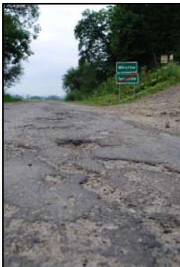
Droga Krzemienna-Witryłów-Jurowce przed remontem ...

W ramach przeprowadzania robót wykończeniowych nastąpiło umocnienie skarp i dna kanałów płytami prefabrykowanymi. Całkowicie wymieniono oznakowanie dróg (znaki nakazu, zakazu, ostrzegawcze i informacyjne). - Konstrukcja nawierzchni drogi została dostosowana do