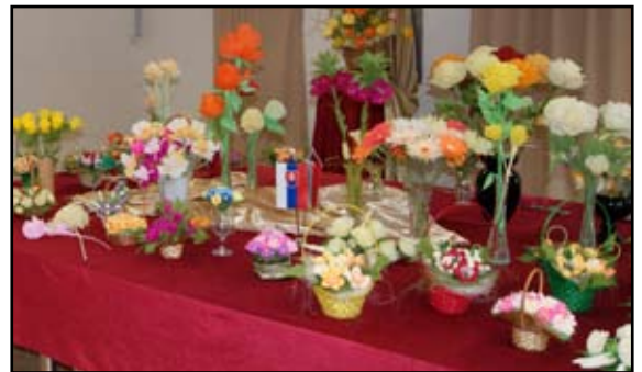
Efekty pracy z warsztatów bibułkarskich