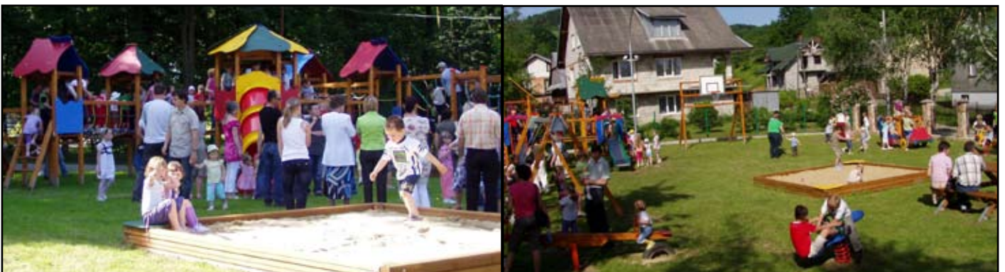
O konieczności powstania takich miejsc najlepiej świadczy potężne oblężenie zabawek zarówno w Jasienicy Rosielnej jak i w Bliznem