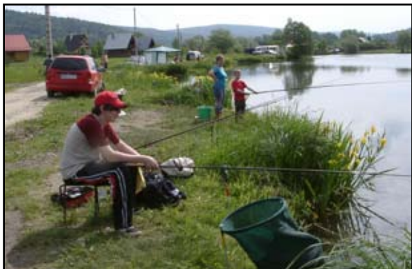
Zawody wędkarskie z okazji Dnia Dziecka

30 maja br. w Temeszowie odbyły się zawody wędkarskie z okazji Dnia Dziecka. Organizatorem imprezy był Polski Związek Wędkarski Koło „Bajkał” w Brzozowie.