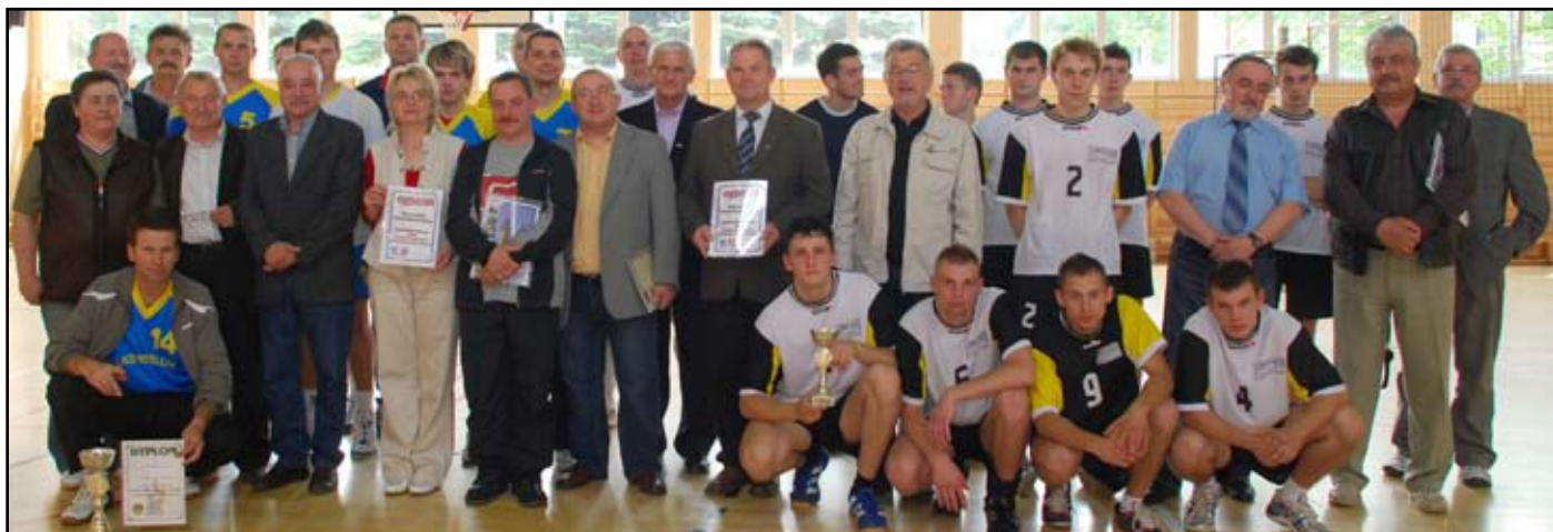
Pamiątkowa fotografia laureatów I i II miejsca wraz z uczestnikami integracyjnego spotkania