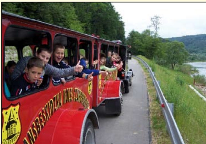
Dużą atrakcją dla dzieci były przejazdy kolejką „Strzała Południa”