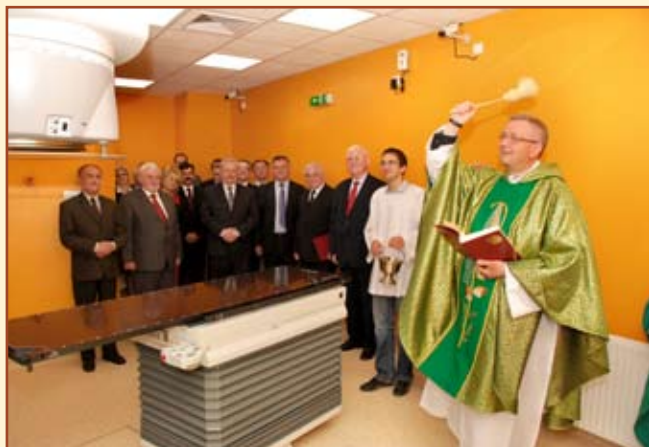
Poświęcenie nowego akceleratora