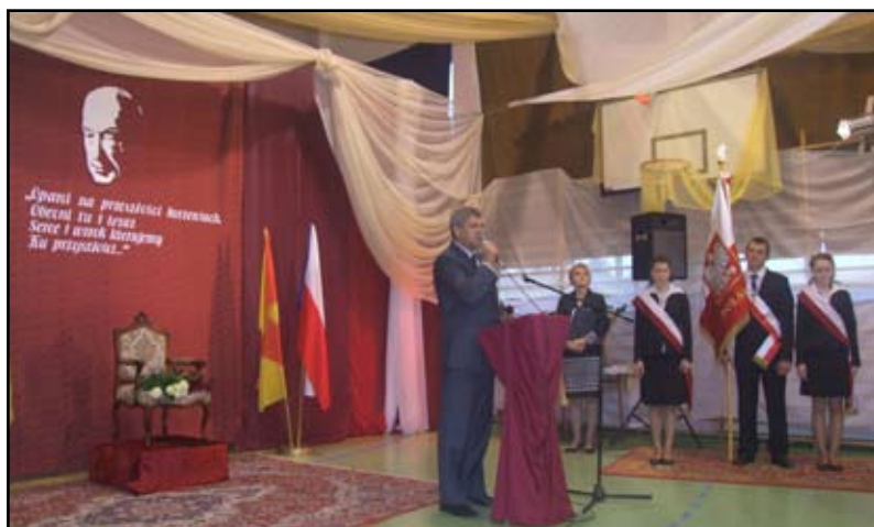
Uroczystość nadania imienia ks. Kardynała Stefana Wyszyńskiego Gimnazjum w Dydni