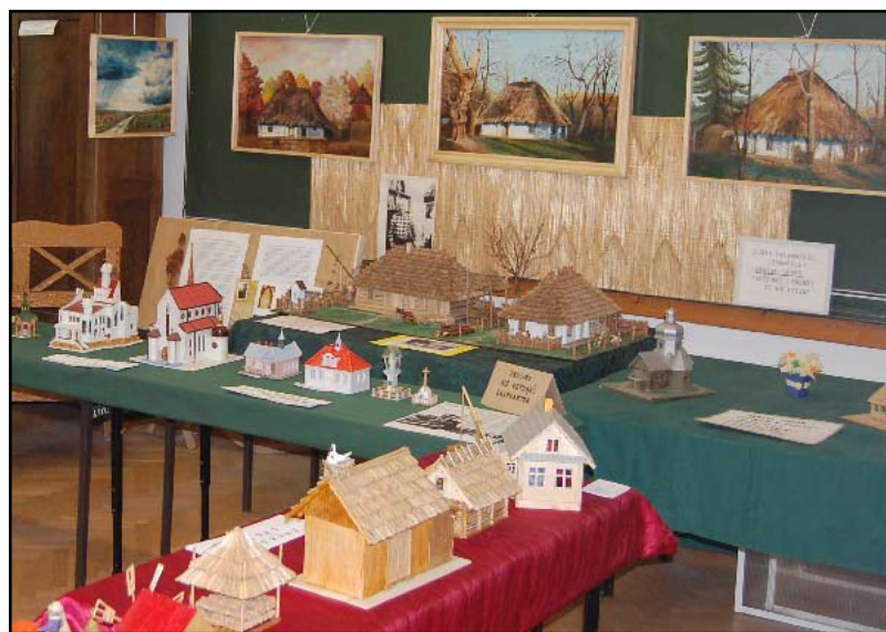
Wystawa „Cudeńka w miniaturze”

Jest to wystawa autorska Józefa Woźnika z Rzeszowa. Przez 5 lat na kuchennym stole odtwarzał zapamiętane z dzieciństwa miniaturowe maszyny i urządzenia gospodarstwa domowego dawnej wsi. Już jako dziecko strugał z drewna ptaszki, koniki i grzechotki. Choć nie ukończył żadnej szkoły technicznej odtworzył w miniaturze, z ogromną precyzją to, co dawno zapomniane lub to, co oglądać obecnie można w naturalnych rozmiarach w skansenach lub w muzeach mających zbiory etnograficzne.