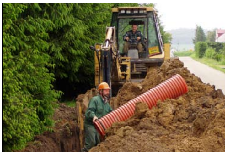
Obecnie sieć kanalizacji sanitarnej budowana jest w Jasionowie

jest ze środków RPO Województwa Podkarpackiego na lata 2007 – 2013 w zakresie infrastruktury energetycznej.