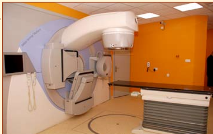
Szpital Specjalistyczny w Brzozowie wzbogacił się o nowoczesny, wysokoenergetyczny akcelerator