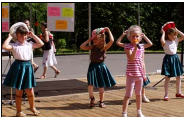
W czasie Pikniku Rodzinnego przed publicznością zaprezentowali się najmłodszy uczniowie jasienskiej Szkoły Podstawowej

sielnej mieści się on w parku gminnym, w Orzechówce – na wykupionej działce gminnej przy Zespole Szkół, w Woli Jasienskiej przy Szkole Podstawowej, zaś w Bliznem, gdzie wybudowano dwa takie place, dzieci mogą się bawić przy Zespole Szkół oraz przy Przedszkolu na małej stronie. – Każde z tych miejsc ma swojego opiekuna. Korzystanie z nich przez dzieci możliwe będzie tylko w towarzystwie osób dorosłych. Wstęp na nie jest oczywiście bezpłatny. Place otwarte będą do godziny 21.00 w lecie i 19.00 w zimie. Są one monitorowane i oświetlone – mówił Wójt Cwiakała.