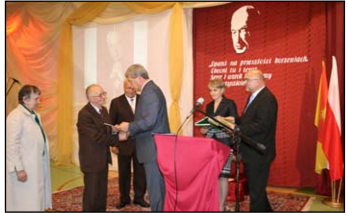
Impreza była okazją do przekazania podziękowań i gratulacji

Historyczne chwile szkoły miały wielu zacnych świadków, bowiem wśród uczestników licznie reprezentowane było: duchowieństwo, samorządowcy szczebla powiatowego i gminnego, Poseł na Sejm, dyrektorzy szkół podstawowych, gimnazjów i przedszkoli gminy Dydnia, radni Rady Gminy Dydnia, kierownicy referatów Urzędu Gminy Dydnia, sołtysi, przedstawiciele instytucji współpracujących z gimnazjum i gminą, fundatorzy sztandaru, Rada Pedagogiczna, Rada Rodziców oraz przedsta-