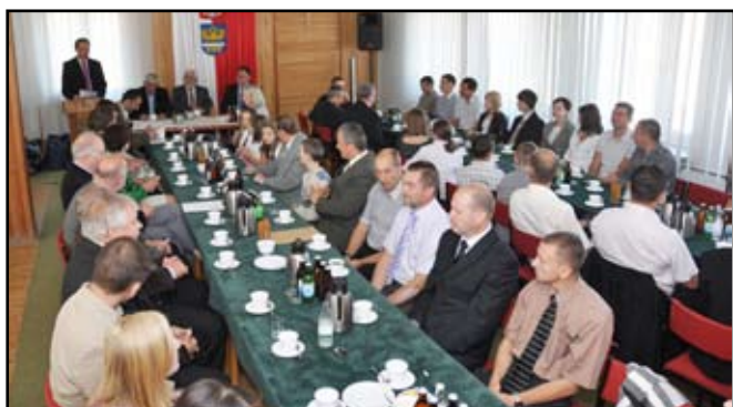
Uczestnicy sportowego podsumowania

Przez 10 miesięcy rywalizowali na lekkoatletycznych bieżniach, boiskach, pływackich torach, w halach, przy pingpongowych stołach, szachownicach. Poznawali smak zwycięstw i gorzyc porażek. Walczyli o jak najlepsze wyniki, jak