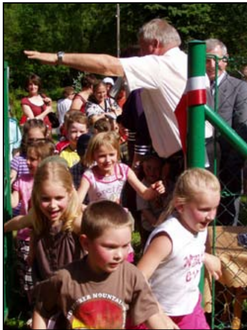
Najbardziej wyczekiwana przez dzieci chwila - moment otwarcia bramy placu, po oficjalnym przecięciu wstęgi

Place zlokalizowane zostały w miejscach wyznaczonych przez samorządy poszczególnych miejscowości. W Jasienicy Ro-