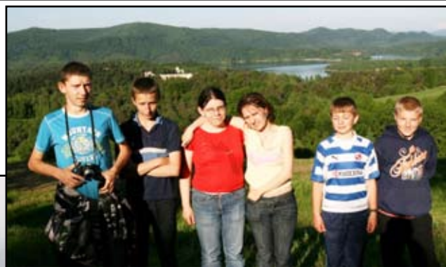
Nad Zalewem Solińskim w Polańczyku