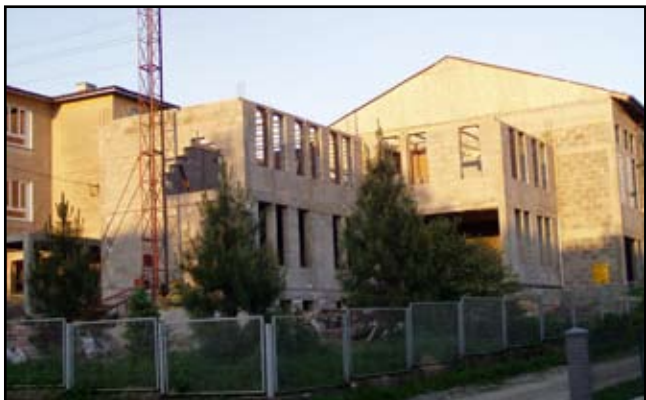
W przyszłym roku dzieci i młodzież ucząca się w Zespole Szkół we Wzdowie będzie mogła korzystać z nowej sali gimnastycznej

W ramach tego przedsięwzięcia elewację zewnętrzną wraz z dociepleniem budynku zyska również budynek Warsztatów Terapii Zajęciowej w Haczowie. Zostaną tam też