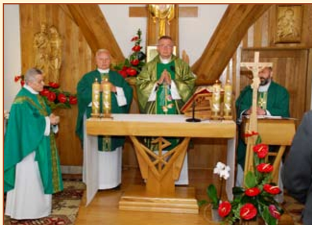
Uroczystości rozpoczęła msza św. w szpitalnej kaplicy