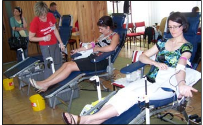
Pracownicy starostwa biorą udział w kolejnej akcji oddawania krwi