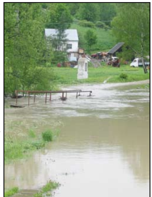
Woda wyrządziła znaczne szkody