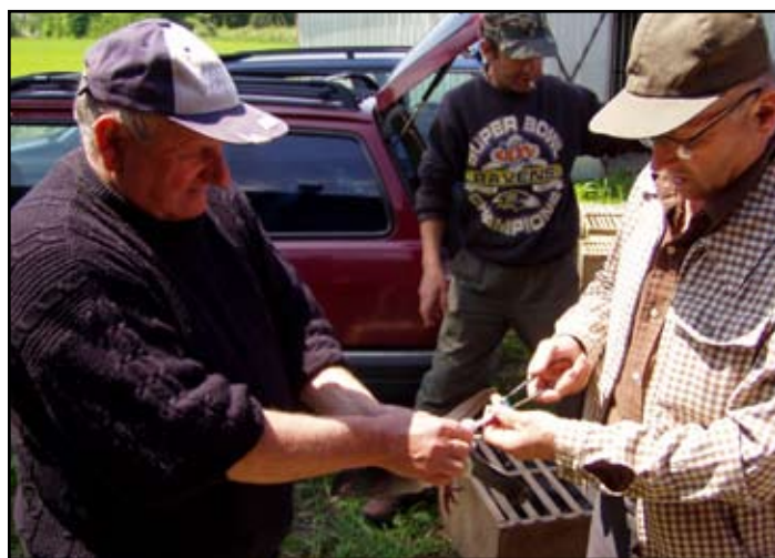
Odpowiednio zaobciążone gołębie...

Brzozowska sekcja PZHGP liczy 36 członków. Najmłod-