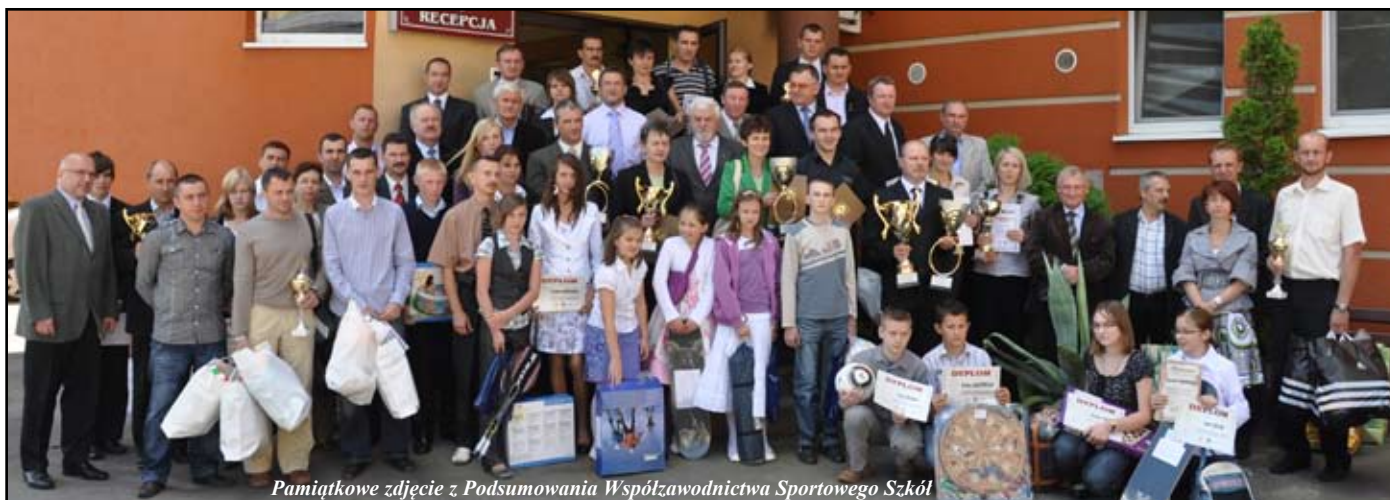
Pamiątkowe zdjęcie z Podsumowania Współzawodnictwa Sportowego Szkół