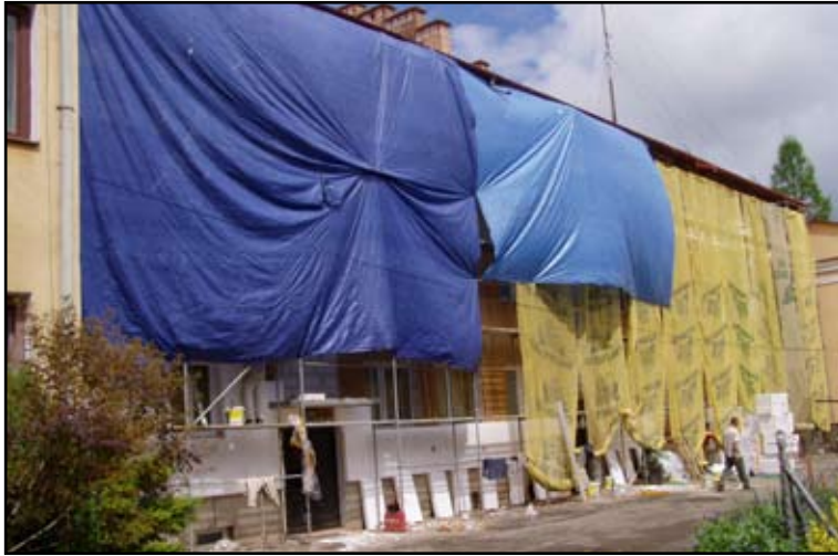
Nowa elewacja wykonywana jest na budynku Urzędu Gminy w Domaradzu

Ruszyły inwestycje przy obiektach użyteczności publicznej oraz na drogach w gminie Domaradz.