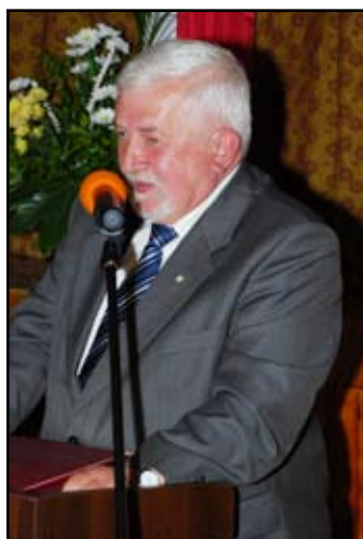
Zygmunt Błaż - Starosta Brzozowski