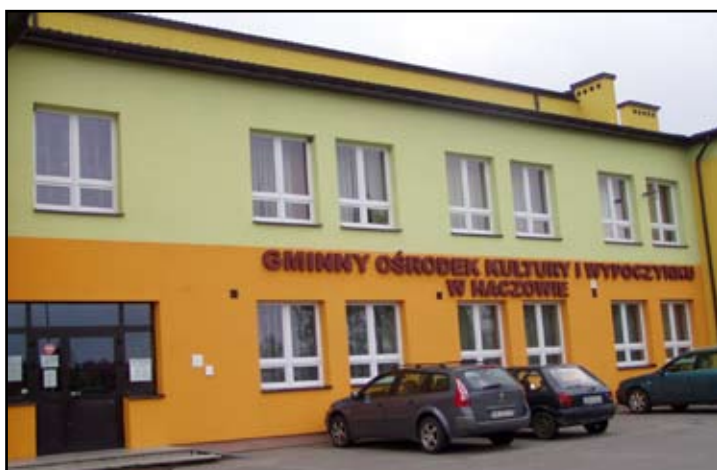
Nowa elewacja na budynku GOKiW w Haczowie

Na przełomie czerwca i lipca wykonywane będą prace konserwacyjne na budynku Gimnazjum w Haczowie. – Pomalowana zostanie elewacja i dach oraz wymienione rynny spustowe. Prace te wykonamy w ramach środków własnych gminy. Należy tutaj również