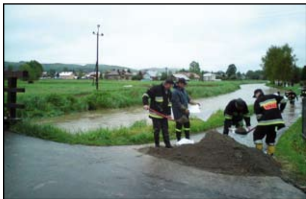
Brzozowscy strażacy podczas działań ratowniczych (fot.1)

Działania prowadzone były we wszystkich gminach powiatu brzozowskiego: Brzozów (253 zdarzenia),