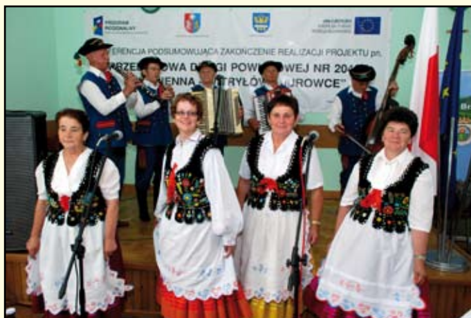
Kapela ludowa „Przepióreczka” z Niebocka