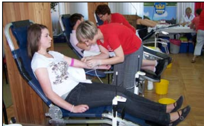
Na apel starosty odpowiedziała m.in. młodzież z brzozowskich szkół ponadgimnazjalnych

- Młodzież była bardzo dobrze przygotowana. Widać, że orientuje się w sprawach krwiodawstwa i chce oddawać krew. To budujące, że młodzi ludzie nie są obojętni na los drugiego czło-