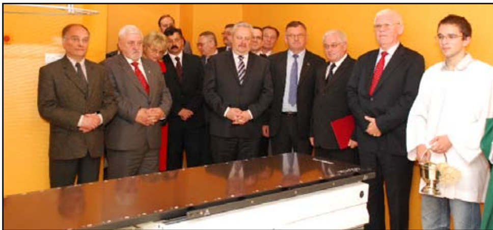
Akcelerator jest wysokoenergetyczny i posiada najnowsze technologie do zastosowania w leczeniu nowotworów