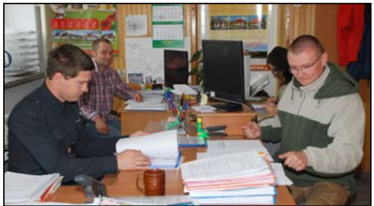
Szczegółowe sprawdzanie dokumentów

Projekt budowlany jest oprócz oświadczenia inwestora o posiadanym prawie do dysponowania nieruchomością na cele budowlane oraz decyzji o warunkach zabudowy i zagospodarowania terenu, dotyczącej inwestycji objętej wnioskiem o wydanie pozwolenia na budowę, zasadniczym dokumentem, bez którego nie jest możliwe wydanie tego pozwolenia. Projekt budowlany powinien spełniać wymagania określone w decyzji o warunkach zabudowy, o ile jest ona wymagana zgodnie z przepisami o planowaniu i zagospodarowaniu przestrzennym. Należy podkreślić, że organ administracji architektoniczno - budowlanej jest związany ustaleniami tej decyzji i niedopuszczalne jest wydanie pozwolenia na budowę