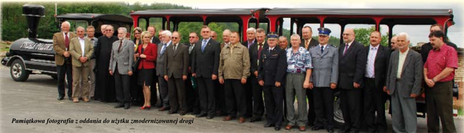
Pamiątkowa fotografia z oddania do użytku zmodernizowanej drogi

W ramach prac zmodernizowano 3 zatoki autobusowe, zamontowano bariery energochłonne o łącznej długości 480 metrów. Na dwóch mostach ułożono nową nawierzchnię bitumiczną. Blisko 600-metrowy odcinek leśny wyłożony został płytami betonowymi (zbrojonymi) typu JOMB. W ramach przeprowadzania robót wykończeniowych nastąpiło umocnienie skarp i dna rowów płytami prefabrykowanymi. Całkowicie wymieniono oznakowanie dróg. Droga powiatowa Krzemienna – Witryłów – Jurowce jest jedną z ważniejszych w sieci dróg powiatowej.