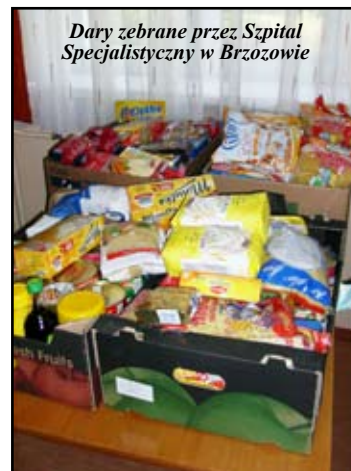
Dary zebrane przez Szpital Specjalistyczny w Brzozowie