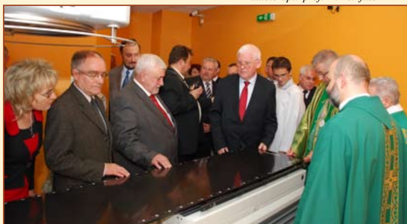
Zaproszeni goście obejrżeli nowozakupiony akcelerator