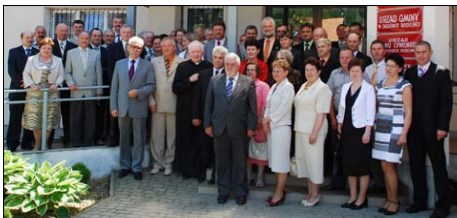
Pamiątkowe zdjęcie z Jubileuszu 20-lecia samorządu terytorialnego