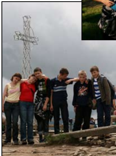
Uczniowie SOSW na Tarnicy

Kiedy rankiem wsiedliśmy w szkolnego busa, by wyruszyć w drogę do Ustrzyk Górnych, nastroje nieco psuła nam deszczowa aura i niskie chmury ograniczające widoczność. Tak było przez całą drogę w Bieszczady. Jednak na miejscu kapryśna pogoda stopniowo się poprawiała. Wyruszyliśmy na szlak turystyczny prowadzący z Wołosatego na najwyższy szczyt polskich Bieszczad, czyli Tarnicę (1346 m). Na szczycie rozpogodziło się. Góry wynagrodziły nasz wysiłek i determinację pięknymi widokami i wrażeniami. Większość uczestników rajdu była w Bieszczadach po raz pierwszy, zgodnie twierdzili oni, że to jedno z najpiękniejszych miejsc w jakich byli. Kto był ten wie, że trudno się z nimi nie zgodzić.