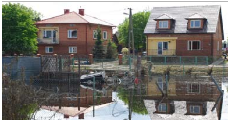
Popowodziowe tereny w gminie Gorzyce