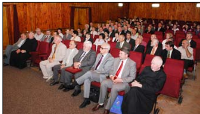
Uroczysta sesja Rady Gminy w Jasienicy Rosielnej