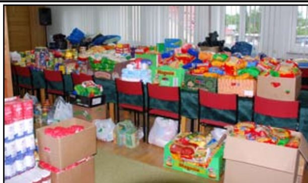
Zbiórka darów dla powodzian

W zbiórkę zorganizowaną i prowadzoną przez Starostwo Powiatowe w Brzozowie włączyli się: Szpital Specjalistyczny w Brzozowie Podkarpacki Ośrodek Onkologiczny, Urząd Skarbowy, Zarząd Dróg Powiatowych, Dom Pomocy Społecznej, Powiatowy Urząd Pracy, a także I Liceum Ogólnokształcące, Zespół Szkół Ekonomicznych,