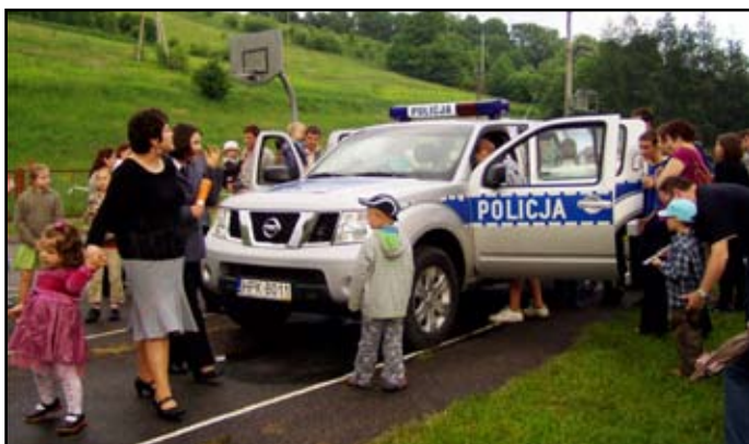
Policyjny samochód wzbudził wielkie zainteresowanie nie tylko milusińskich, ale również i ich rodziców

zachęcamy również do zdrowego, aktywnego trybu życia oraz do wykonywania badań profilaktycznych. Wiadomo przecież, że „zdrowie i siła lepsze są niż wszystko złoto”.