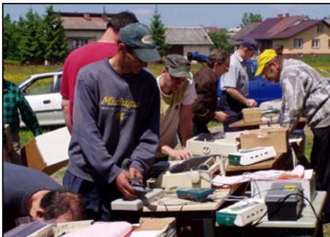
W punkcie wkładań gołąb rejestrowany jest w zegarze