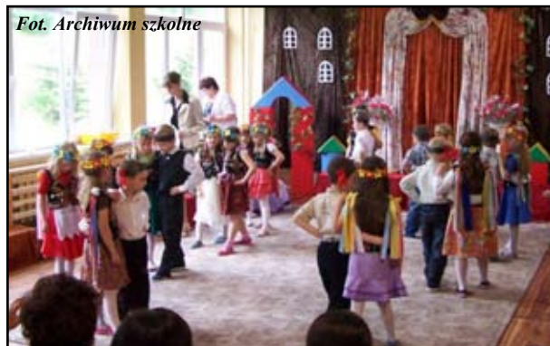
Fragmety przedstawienia z okazji Dnia Matki

Uroczystość była niezapomnianym przeżyciem dla dzieci, myślimy, że również dla naszych gości. Składamy serdeczne podziękowania wszystkim, którzy wzięli udział w uroczystym spotkaniu z okazji Dnia