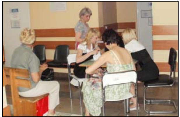
Chętnych do badań profilaktycznych nie brakowało