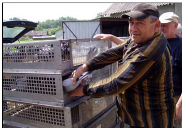
... delikatnie pakowane są do odpowiednich klatek