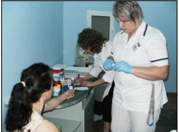
W organizację badań zaangażowały się m.in. pielęgniarki