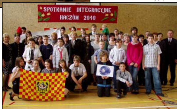
Pamiątkowe zdjęcie młodzieży i opiekunów z Dolnego Śląska z ich haczowskimi gospodarzami

obcych, miał świetny głos, niegdyś słyszany w krakowskiej operze, jednak nigdy się nie wywyższał. Dla nas rodzeństwa, a było nas jedenaścioro, i dla wielu innych osób był on prawdziwym wzorem.