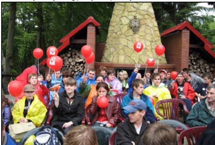
Piknik majowy w Heluszu

Imprezę zaszczycili duszpasterze wraz z Abp. Józefem Michalikiem, Goście ze Słowacji, Władze Samorządowe i Parlamentarzyści. Rozpoczęliśmy uroczystą mszą świętą po przewodnictwem Abp. J. Michalika, który poświęcił nową kaplicę w budynku Ośrodka, ołtarz polowy, drogę krzyżową oraz pomnik Jana Pawła II.