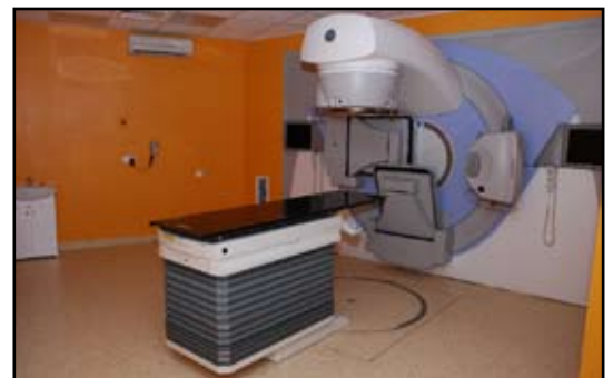
Nowy akcelerator w brzozowskim szpitalu

Na sukcesy i skuteczność leczenia składa się nie tylko dobry, nowoczesny sprzęt, ale też – a może przede wszystkim - wykwalifikowana kadra