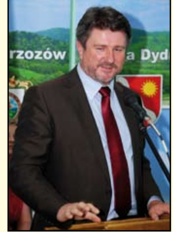
Bogdan Rzońca - Wicemarszałek Województwa Podkarpackiego