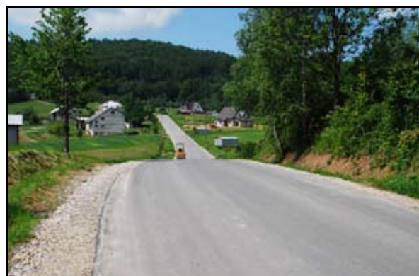
Nowa nakładka bitumiczna w Końskim

obecnie przyjętych standardów. Wyremontowana droga ułatwi życie mieszkańcom powiatu brzozowskiego oraz turystom korzystającym z tego ciągu komunikacyjnego, prowadzącego na tereny atrakcyjne do odwiedzania – podsumował Zygmunt Błaż, Starosta Brzozowski.