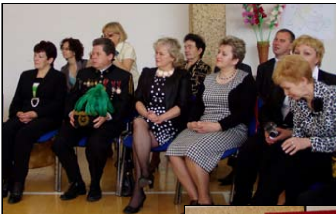
Do Haczowa przybyła młodzież wraz z opiekunami z Lubina, Polkowic, Głogowa, Chocianowa, Domu Dziecka z Wilkowa.

Niemal sześćdziesięcioosobową delegację z Dolnego Śląska gościło haczowskie Gimnazjum. Znaleźli się w niej przedstawiciele KGHM Polska Miedź SA w Lubinie oraz placówek szkolnych i wychowawczych.