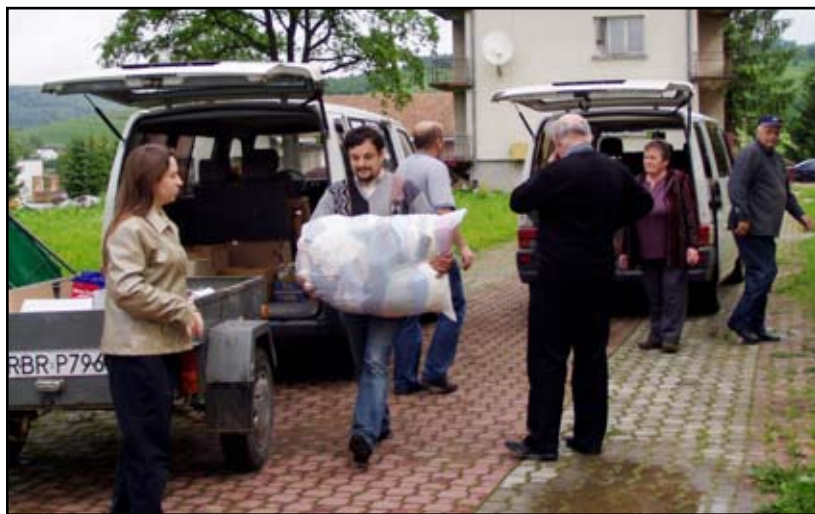
Spakowane i posegregowane dary zostały zapakowane na busy i odjechały do Gorzyc Tarnobrzeskich