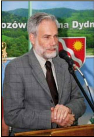
Andrzej Radwański - Wicestarosta Sanocki