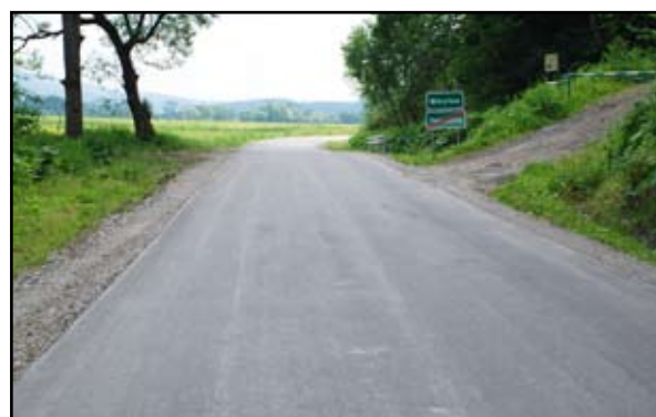
... i po remoncie