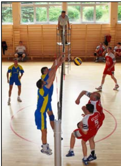
Rozgrywki pomiędzy drużynami SM Team Brzozów a Krościenkiem Wyżnym

współpracy na inne płaszczyzny np. w zakresie infrastruktury drogowej. W trakcie dyskusji poruszono również istotę i potrzebę scaleń gruntów oraz konieczność odpowiedniego do-