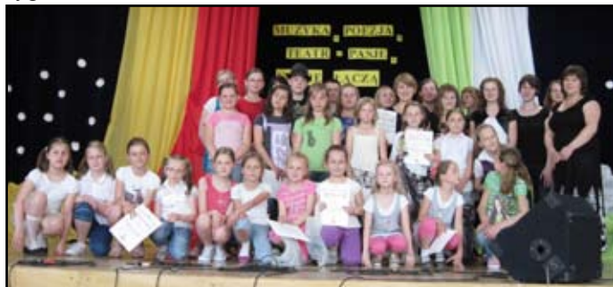
Pamiątkowe zdjęcie z Festiwalu Szkolnych Form Artystycznych (fot.1)

W dniach 7-11 czerwca br. w Zespole Szkół w Bliznem odbył się Festiwal Szkolnych Form Artystycznych. Wzięli w nim udział uczniowie ze szkół z terenu powiatu brzozowskiego. Patronat honorowy nad imprezą objął Starosta Brzozowski Zygmunt Błaż.