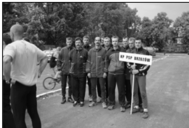
Reprezentacja KP PSP w Brzozowie

W wyniku przeprowadzonych konkurencji w 1 i 2 dniu klasyfikacja generalna VI Mistrzostw Województwa Podkarpackiego w Sporcie Pożarniczym przedstawia się następująco: ( pierwsze 5 miejsc)