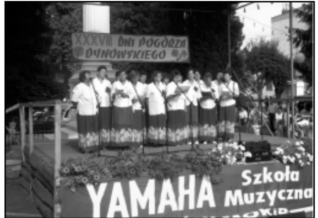
Koło Gospodyń Wiejskich z Izdebek