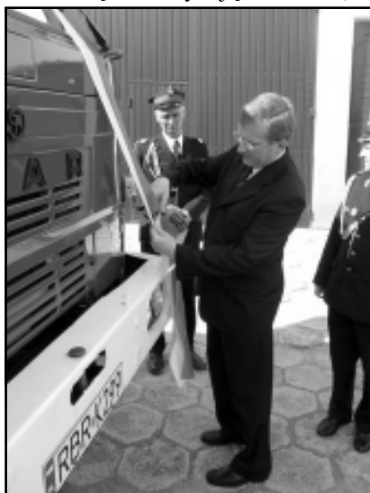
Uroczyste przecięcie wstęgi przez Wójta Gminy Haczów

Uroczystość rozpoczęła się mszą świętą w kościele parafialnym, w której uczestniczył poczet sztandarowy jednostki wraz z kompanią honorową. Tworzyli ją druhowie, strażacy jednostki miejscowej oraz