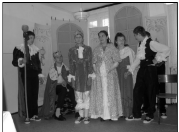
„Kopciuszek” w wykonaniu dzieci z SOSW w Brzozowie