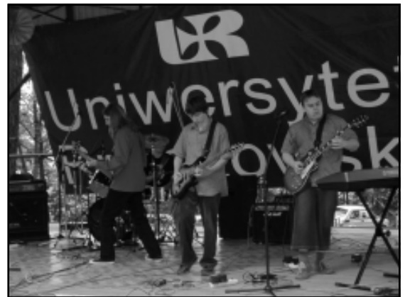
Ostrzejsze rytmy w wykonaniu Zemsty Chone-Kera

Miłośnicy nieco ostrzejszych rytmów rozkoszowali się występami zespołów Zemsta Chone-Kera , Hall of