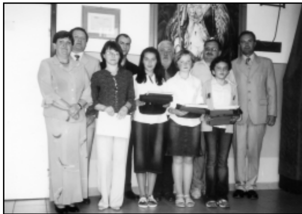
Goście wraz z laureatami konkursu