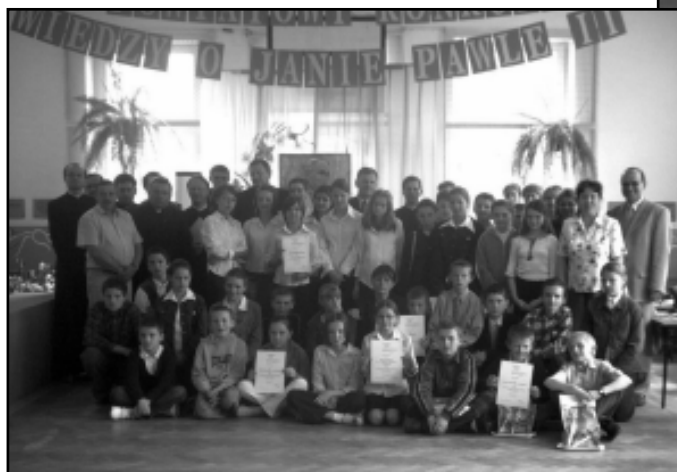
Zdjęcie zbiorowe uczestników konkursu

przyczyni się do lepszego poznania osoby i nauczania Papieża - Polaka, udzielił kardynalskiego błogosławieństwa organizatorom i uczestnikom konkursu.