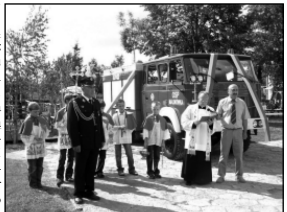
Poświęcenie nowego wozu strażackiego

Druza część imprezy odbyła się już na placu przy Domu Strażaka i rozpoczęła się raportem, który przyjął Prezes Zarządu Oddziału Powiatowego ZOSP RP w Brzozowie. Następnie