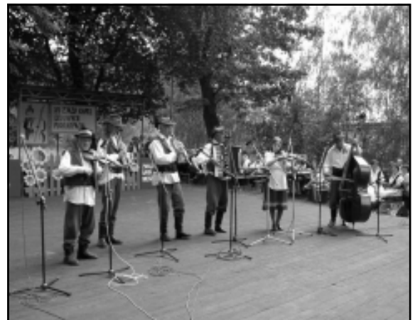
Występ kapeli „Rymanowianie” z Rymanowa

Rola kultury ludowej staje się coraz ważniejsza jest bowiem wyznacznikiem naszej tożsamości. W wielu kapelach muzykuje młodzież, co daje nadzieję na ich przetrwanie. Organizowanie takich wspólnych koncertów to wspaniała okazja do zaprezentowania się istniejących kapel na naszym