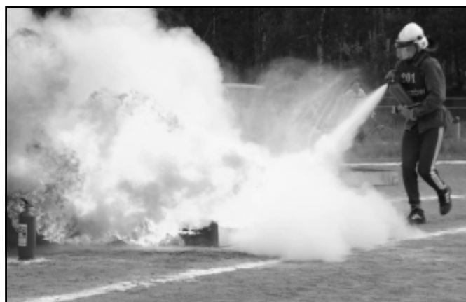
Asp. sztab. Leszek Zarych podczas sztafety pożarniczej 4x100 m przy gaszeniu wanny z palącą się cieczą