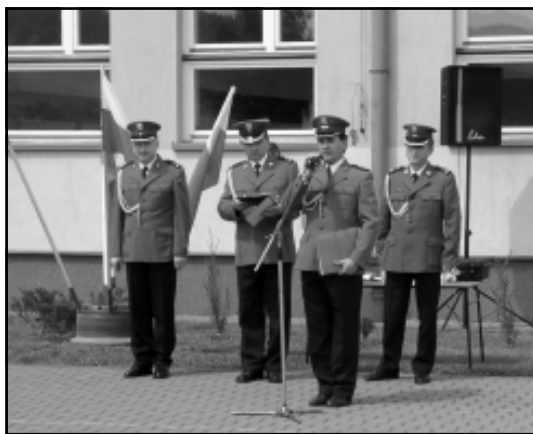
Święto Policji. Nozdrzec, 23 lipca 2004 r.

Podczas uroczystości brzozowska policja otrzymała od Burmistrza