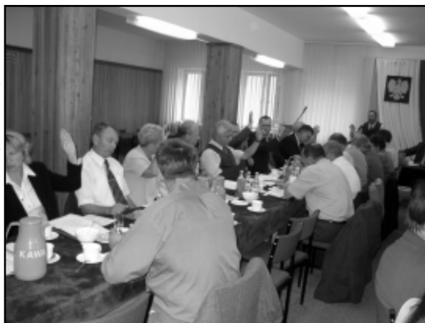
PRL Powiatu Brzozowskiego radni uchwalili jednogłośnie

Radni przegłosowali też szereg uchwał dotyczących oświaty. Zdecydowali o utworzeniu środka