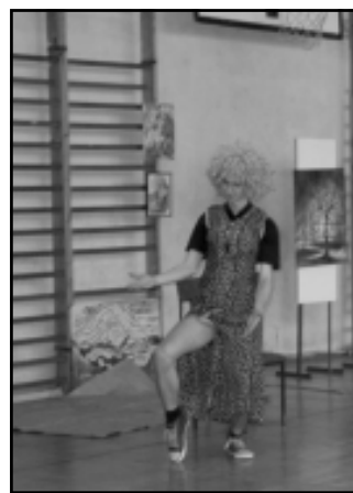
Szkolny kabaret KIT

Mamy nadzieję, że szkoła spodobała się gimnazjalistom i, jak co roku, większość z nich złożyła podania o przyjęcie do Liceum.