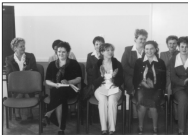
Członkinie KGW emanują optymizmem i radością ducha

Jedwabistość skóry okryciem precudnym Spojrzeniem kieruje czasem nieco złudnym Postać twa kreuje ruchy wymarzone, By zmysły mężczyzn były poruszone.