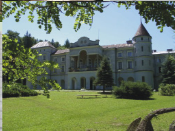
Palac we Wzduwie, siedziba Małopolskiego Uniwersytetu Ludowego

„Brzozowska Gazeta Powiatowa” - miesięcznik samorządu powiatowego.