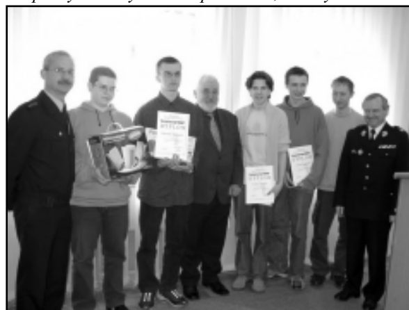
Zwycięzcy w kategorii powyżej 16 lat