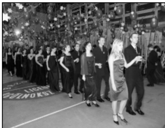
Imprezę tradycyjnie rozpoczęto polonezem

Rozpoczyna się szereg pozdrowień oraz podziękowań dla wychowawców i innych profesorów oraz koleżanek i kolegów. Noc mija, a zabawa rozkręca się. Rodzice pilnują, aby na stołach niczego nam nie zabrakło. Na twarzach czwartoklasistów widać radość i beztroskę, nikt nie myśli teraz o tym, że za 100 dni, a dokładnie za 80, czeka nas jeden z najważniejszych egzaminów w życiu – MATURA. Tego wieczoru wszyscy są roześmiani i weseli. Częste błyski fleszy, kamerzyści, eleganckie stroje, wszystko to sprawia, że przez ten jeden wieczór czujemy się jak prawdziwe gwiazdy filmowe w „pełnej gali”.