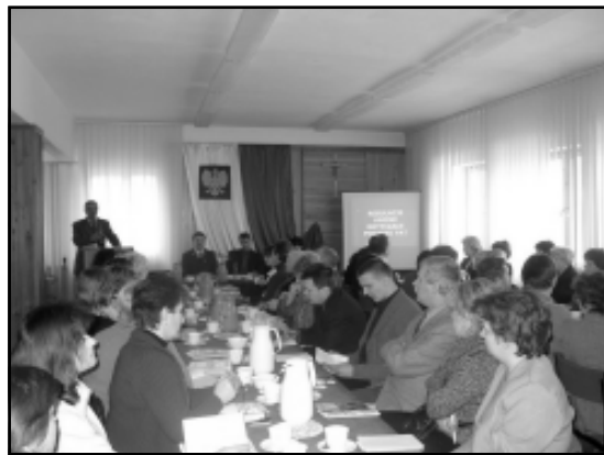
Seminarium cieszyło się dużym zainteresowaniem

Starostwo Powiatowe w Brzozowie było jednym z organizatorów seminarium na temat: „VAT w Unii Europejskiej”. Wzięli w nim udział przedstawiciele przedsiębiorstw oraz jednostek samorządowych z terenu powiatów: brzozowskiego, jasielskiego, krośnieńskiego, leskiego i strzyżowskiego.