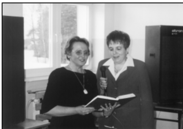
Program artystyczny w wykonaniu kobiet z KGW Rudawiec

Kobieto – co kryjesz w swej osobowości Pieśczęcią, cierpliwością, żart i wesołości, Przystań dla mężczyzny, który chce zagościć Na stałe w twym życiu, czując smak miłości.