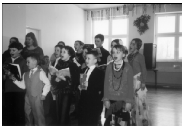
Pelen wdzięku występ chóru dziecięcego „Wschodzące Promyki”

Niech woń nektaru słodczy kobiecej Spocznie w sercu tego, który jest w zachwycie Mogąc cię oglądać, wzrokiem postać śledzić Potencjał męskości – w związku dwojga zmieścić.