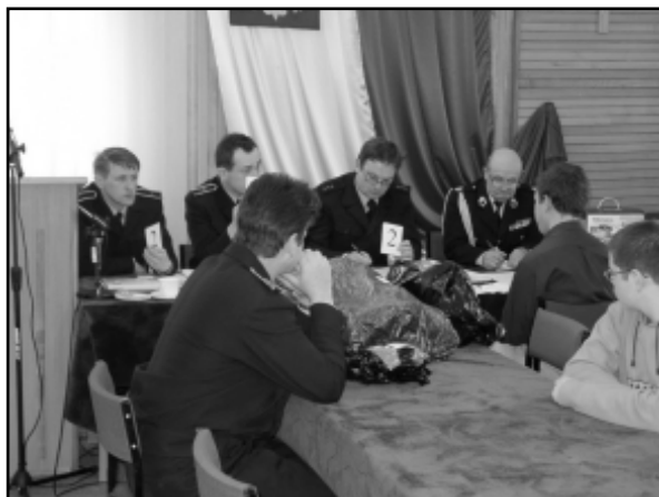
Najlepsi odpowiadali w części ustnej