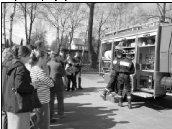
Prezentacja nowego wozu bojowego

31 marca br. w świetlicy Starostwa Powiatowego w Brzozowie odbyły się eliminacje powiatowe Ogólnopolskiego Konkursu Wiedzy Pożarniczej „Młodzież Zapobiega Pożarom”. Do konkursu przystąpiło 24 uczestników, wyłonionych w eliminacjach gminnych. Rywalizowali oni w dwóch kategoriach wiekowych: do i powyżej 16 lat.