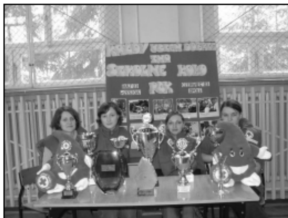
Swoje osiągnięcia zaprezentowali również członkowie koła PCK