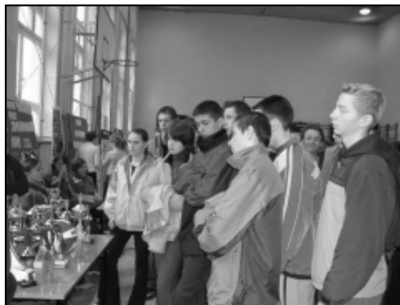
Puchary i dyplomy - sportowe trofea ZSE