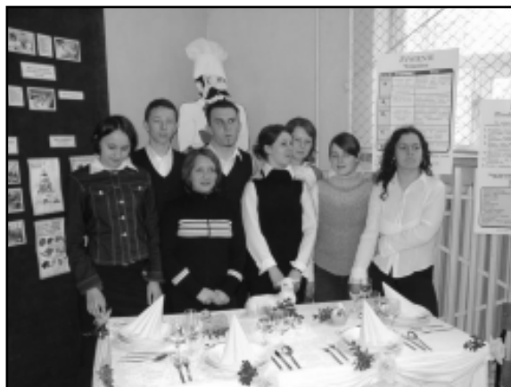
Stoisko technikum żywienia i gospodarstwa domowego