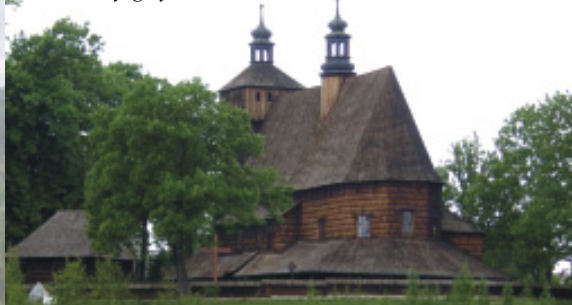
XV-wieczny gotycki kościół w Haczowie