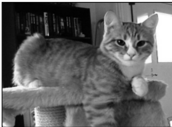
Wszystkie koty mają wyrazistą osobowość

Koty są indywidualistami. Dzikie koty są niezależne i niezbyt towarzyskie. Koty domowe niewiele się od nich różnią. Jak wszystkie zwierzęta domowe, ich byt zależy od tego, czy zostaną nakarmione, czy sprzątnię im się kuwety, mimo wszystko pozostają niezależne.