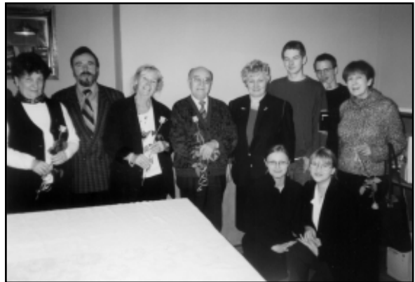
Brzozowski licealiści z dumą reprezentowali region

Nie jest to jedyne osiągnięcie artystyczne uczniów Liceum Ogólnokształcącego w Brzozowie. Z pełnym zaangażowaniem i zamiłowaniem biorą udział w konkursach, przeglądach i festiwalach muzycznych na szczeblu powiatowym, rejonowym, wojewódzkim i ogólnopolskim. Działalność artystyczną prowadzą również w naszym mieście, chociażby udział w pokonkursowej wystawie