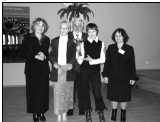
W kategorii gimnazjów zwyciężył biznesplan z Izdebek

Najbardziej oryginalnym spośród wszystkich projektów był biznesplan Spółdzielni Młodzieżowej „Talent” przygotowany przez Gimnazjum Nr 1 w Izdebkach. Autorami projektu są uczniowie klasy II b, pracujący pod opieką Marty Baranieckiej. Po gruntownej analizie rynku oraz własnych możliwości pomysłodawcy postanowili, że Spółdzielnia Młodzieżowa „Talent” na początek będzie działała w 4 kierunkach. Sekcja I zajmie się sprzedażą wykonanego przez spółdzielców rękodzieła (haftowane obrazy, flakony, ozdobne