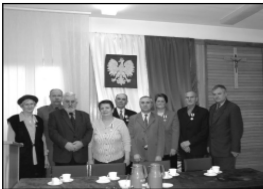
Pamiątkowe zdjęcie z uroczystości wręczenia odznaczeń