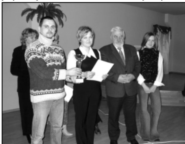
Lureaci konkursu z gimnazjum w Starej Wsi