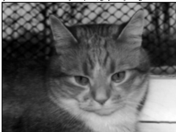
Mina kota wiele mówi o jego odczuciach

się nie dzieje. W ten sposób kot pokazuje, że jest zadowolony, zrelaksowany i panuje nad sytuacją. Wyginając grzbiet w łuk, twój ulubieniec jest zdenerwowany! Stara się zastraszyć przeciwnika. Napuszywszy sierść - „rośnie”, a wszystko po to, by zademonstrować naturę dzikiego drapieżcy. Jeżeli kuli się, to oczywisty sygnał, że zwierzę jest wystraszone. Zachowuje się tak, gdy czuje zagrożenie. Kuli