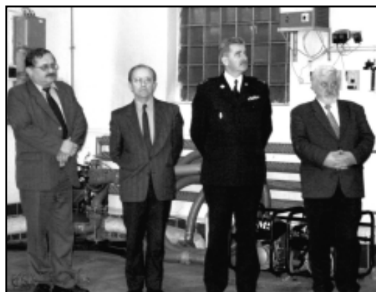
Nowy wóz bojowy - kolejna, miła okazja do spotkania