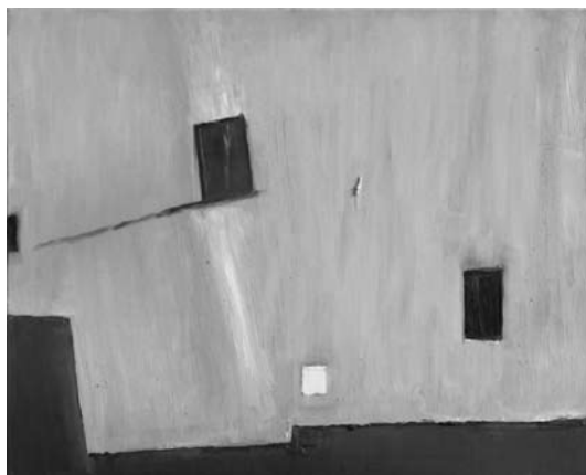
Marek Pokrywka - Dom na skarpie

W ślad za hasłem promującym miasto, które określa je jako położone „w wyjątkowym miejscu i niepowtarzalne”,