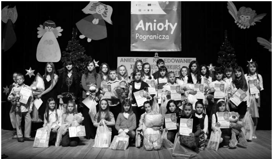
Uczestnicy konkursu kołęd