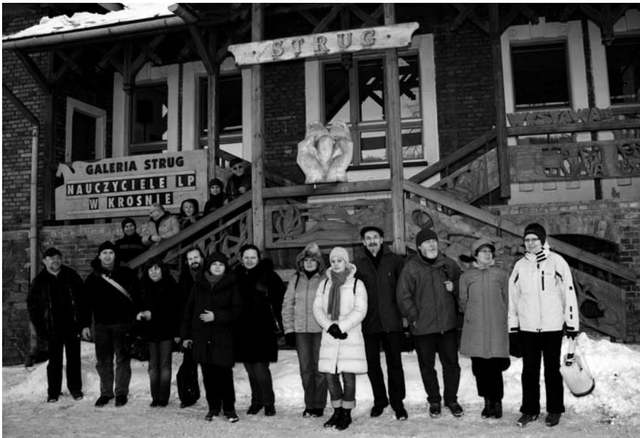
Autorzy wystawy przed Galerią „Strug” w Zakopanem.