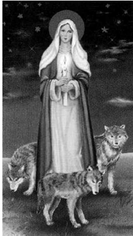
Wizerunek z obrazka odpustowego