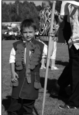
Jeden z najmłodszych żniwiarzy – z Zagorzyc Dolnych.

Z kościoła orszak dożynek, poprzedzony konną banderą, podążył na stadion, gdzie grupy