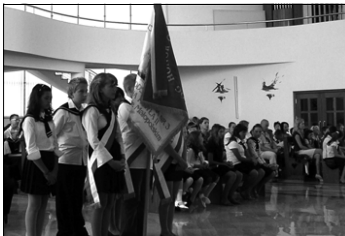
Uroczystość rozpoczęcia roku szkolnego 2011/12 w Szkole Podstawowej nr 3 w Sędziszowie Młp.