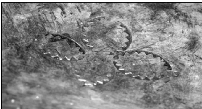
Charakterystyczne zdobienia, wybijane za pomocą specjalnych stempli np. na okuciach wozów.

Na kopycie konia jest wszystko napisane: pierwsza linia to róg twardy, można gwoźdźcia całego w kopyto wbić na 7 cm i koniowi nic nie zrobi – tłumaczy. Tylko żeby nie poszedł w