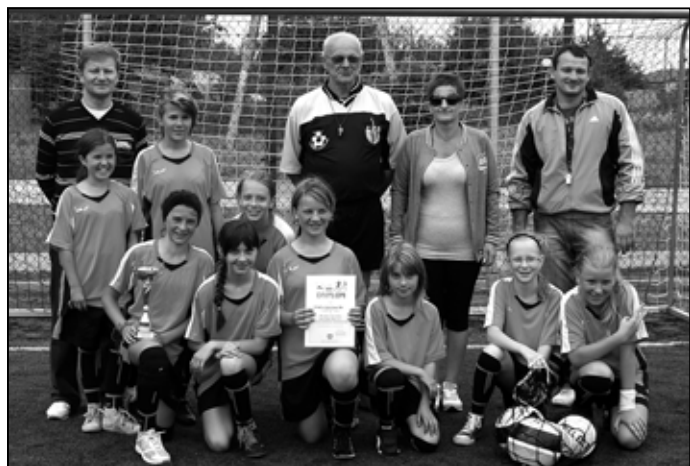
Dziewczeta z SP3 w Sędziszowie Młp.