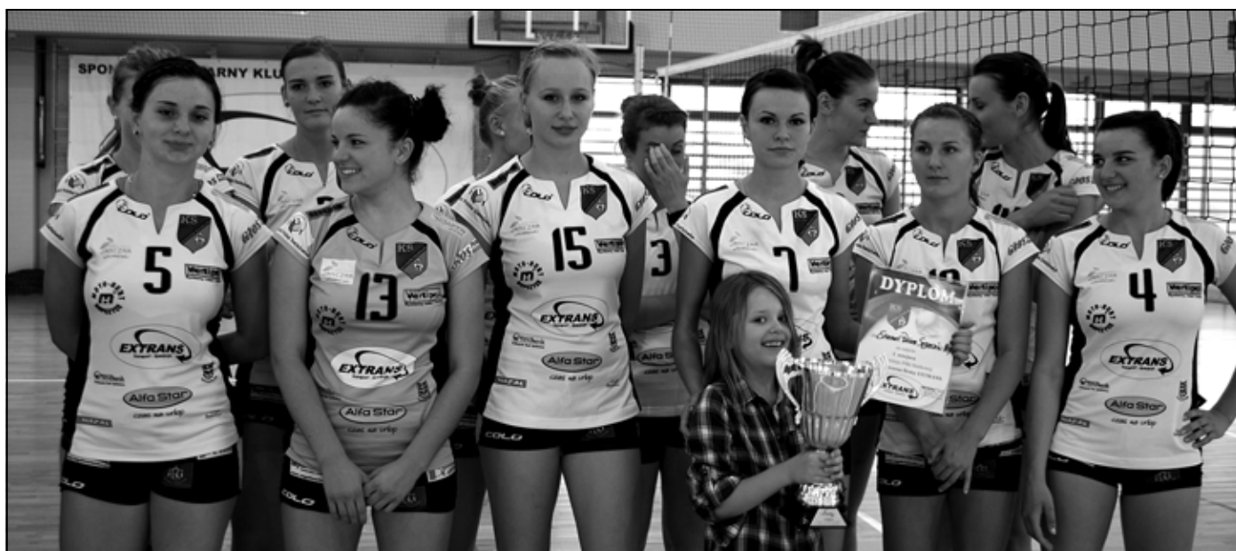
Drużyna Patrii z pucharem za zwycięstwo w turnieju.