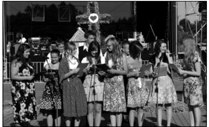
W grupach wieńcowych dominuje młodzież – tu z Boreczku.