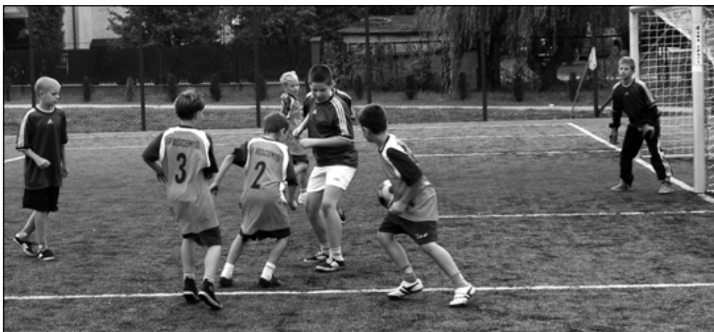
Mecz SP3 Sędziszów Młp. – SP Będziemiśl.

Zwycięskie drużyny rywalizować będą w kolejnym etapie rozgrywek.