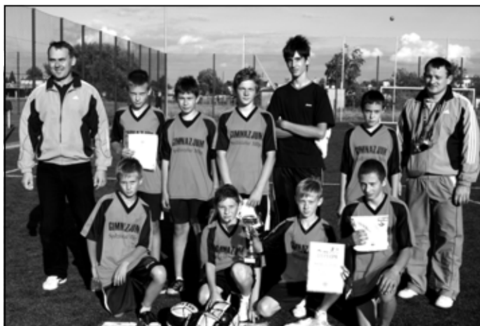
Chłopcy z Gimnazjum w Sędziszowie Młp.