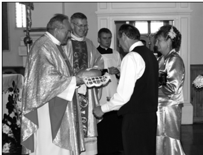
Dary ofiarne składają przedstawiciele Zagorzyc Górnych.