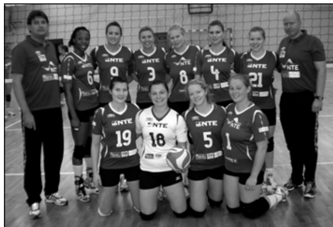
Goście z Norwegii – Stod Volley.

Przed inauguracyjnym meczem ligowym, 24 września z Anser Siarką w Tarnobrzegu , siatkarki Extrans Patrii czeka jeszcze dwudniowy turniej w Tomaszowie Lubelskim , 17 i 18 września, z udziałem Tomasovii , Anser Siarki , Szóstki Biłgoraj i Sobieskiego 46 Lublin . 1 października Extrans Patria, w II kolejce, zagra w Sędziszowie Młp. z Pogonią Proszowice .