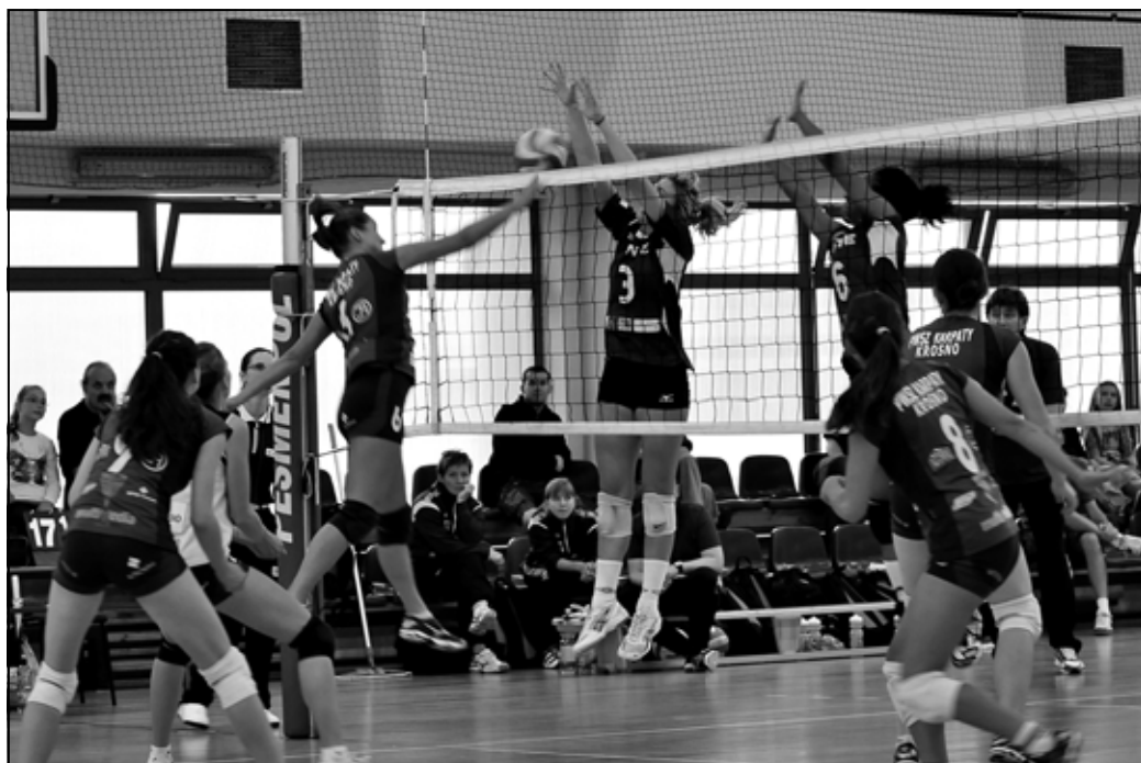
Fragment meczu Karpaty Krosno – Stod Volley.