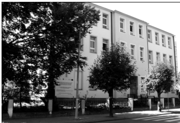
Gimnazjum w Sędziszowie Młp.

Inwestujemy w rozwój województwa podkarpackiego