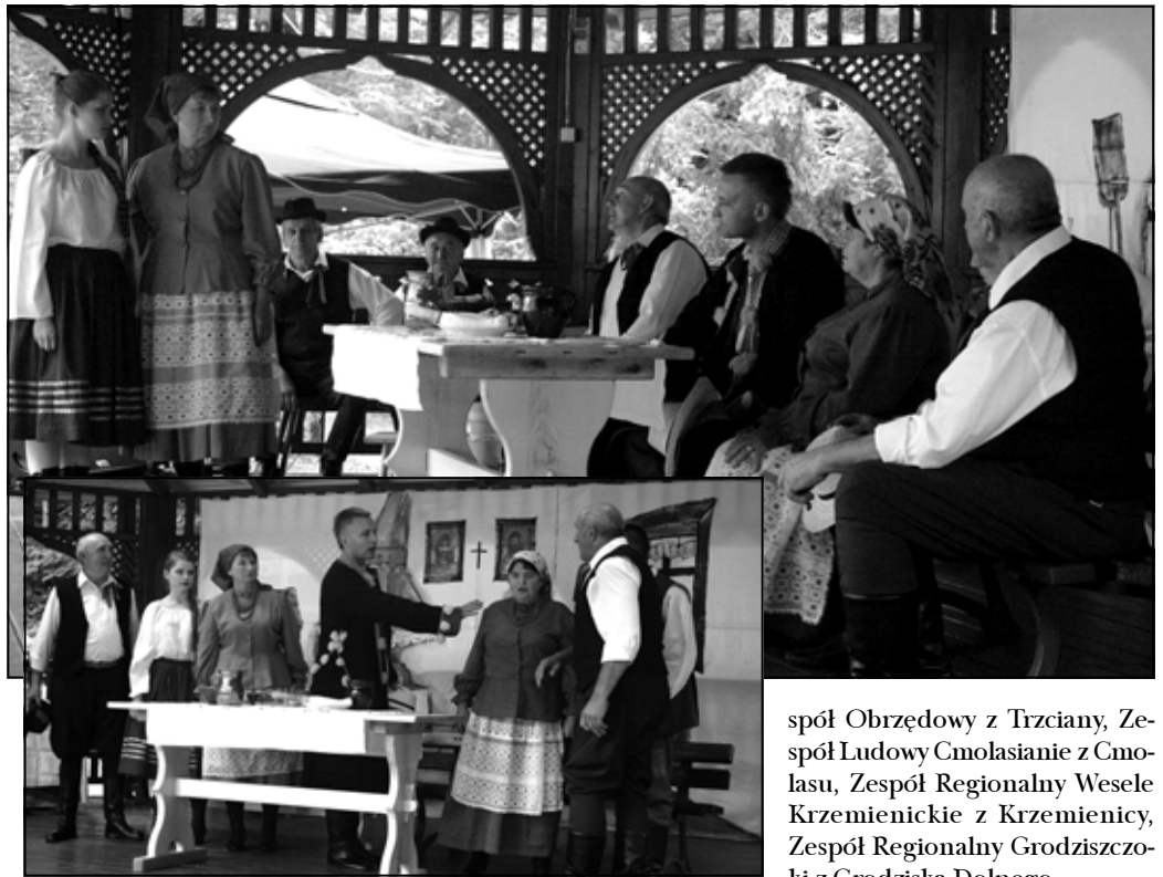
Zespół z Zagorzyc na scenie w Rymanowie w obrzędzie zmównin.

Oprócz zespołu z Zagorzyc, podczas tegorocznego Wesela Podkarpackiego wystąpiły: Regionalny Zespół Ludowy Ziemia Sanocka z Nowosielec, Zespół Teatralno - Obrzędowy Wielopoleanie z Wielopola Skrzyńskiego, Zespół Ludowy z Soniny, Zespół Obrzędowy Rymanowianie, Ze-