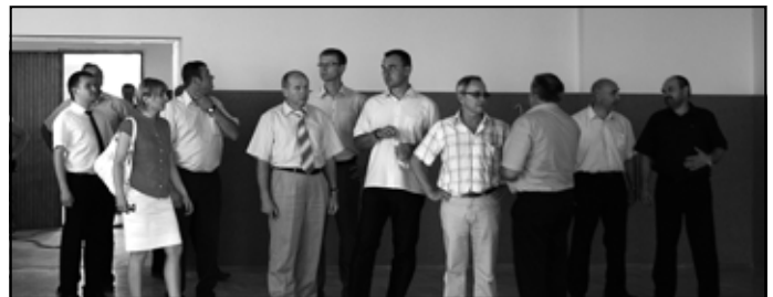
W odnowionym Domu Strażaka w Górze Ropczyckiej.