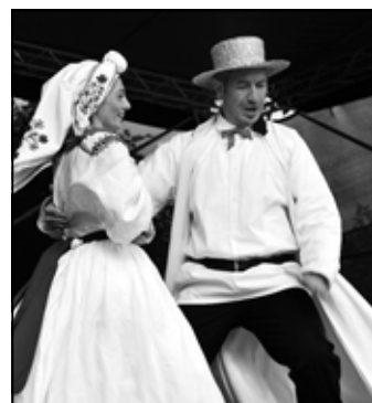
Na scenie „Wiosna w Szamotulach” w tańcach lasowiackich.

Szczególnym momentem był finał koncertu, gdy zespoły wraz z publicznością odśpiewały hymn rzeszowskiego festiwalu, którego refren: Daleko, daleko, za morzem, daleko przepiękna kraina, kraj rodzi-ny matki mej – niósł się hen daleko, nad Ziemią Sędziszowską. (Warto zaznaczyć, że w zespole „Tatry” z Australii zatańczyła