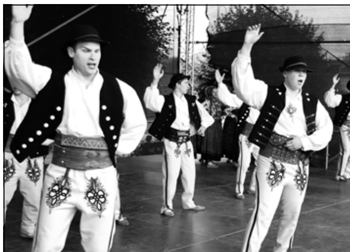
Australijskie „Tatry” oczywiście w tańcach góralskich.