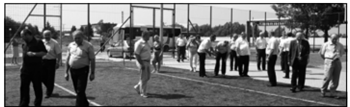
Na boisku „Orlik 2012” na Osiedlu Młodych.

wieloletniej prognozie finansowej Gminy Sędziszów Młp. Do Wieloletniej Prognozy Finansowej wprowadzono następujące zadania: