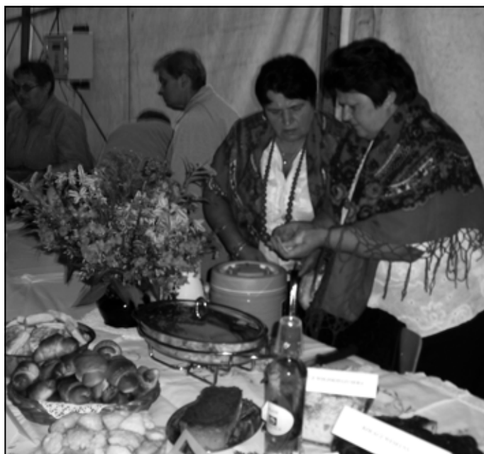
Panie z SGW „Zagorzanki” w Lesku.

To drożdżowe ciasto było prototypem dzisiejszych tortów. Pieczone w chlebowym piecu osią-