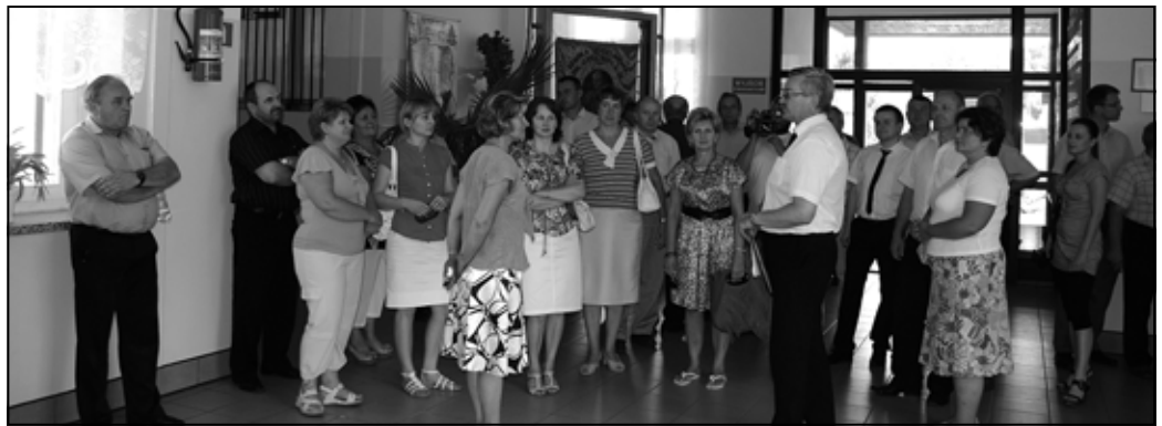
Radni Rady Miejskiej, kierownicy referatów Urzędu Miejskiego, przewodniczący Zarządów Osiedli oraz sołtysi wizytowali wraz z Burmistrzem obiekty gminne w południowej części gminy. Tu w Szkole Podstawowej w Zagorzycach Górnych.