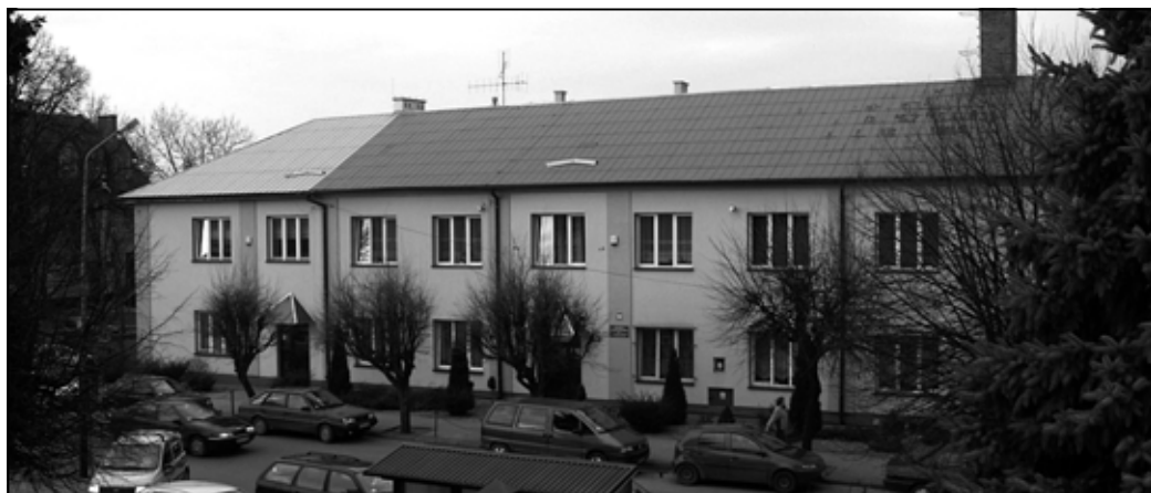
SP 2 w Sędziszowie Młp.

Celem projektu było zwiększenie efektywności energetycznej obiektów oświatowych w Gminie