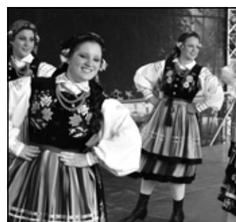
„Biały Orzeł” z Toronto.